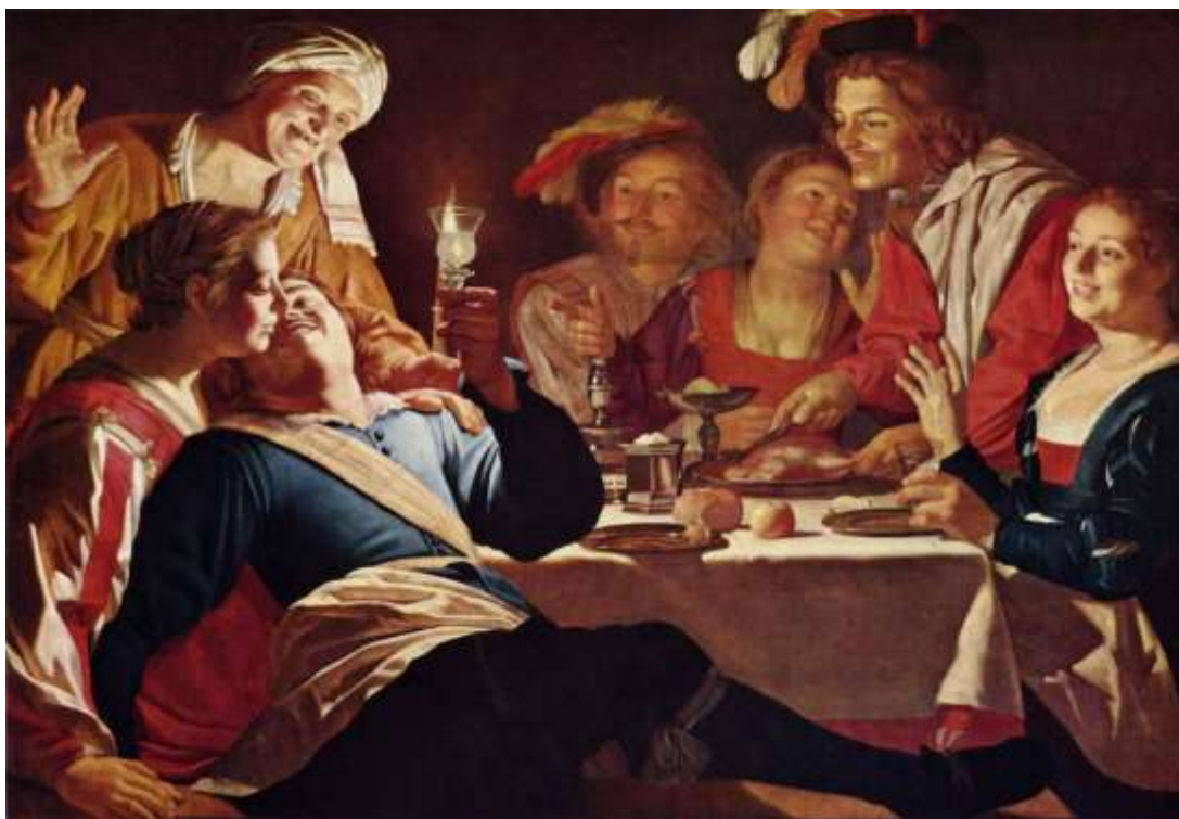
SLIKA 14: Gerard van Honthorst „Sretno društvo“, 1619. godine