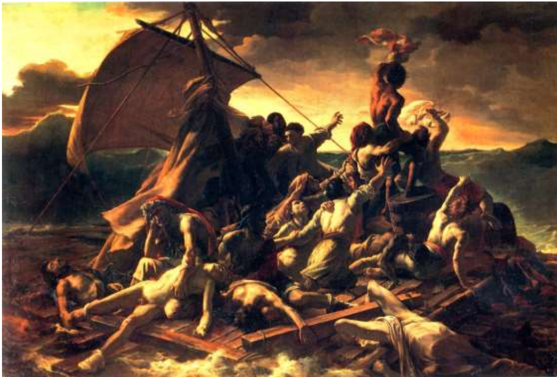
(prema: Janson, H. W. i Janson, A. F. (2005), Povijest umjetnosti. Varaždin: Stanek d.o.o. str. 677.) SLIKA 6: Theodore Gericault „Splav meduze“, 1819. godine