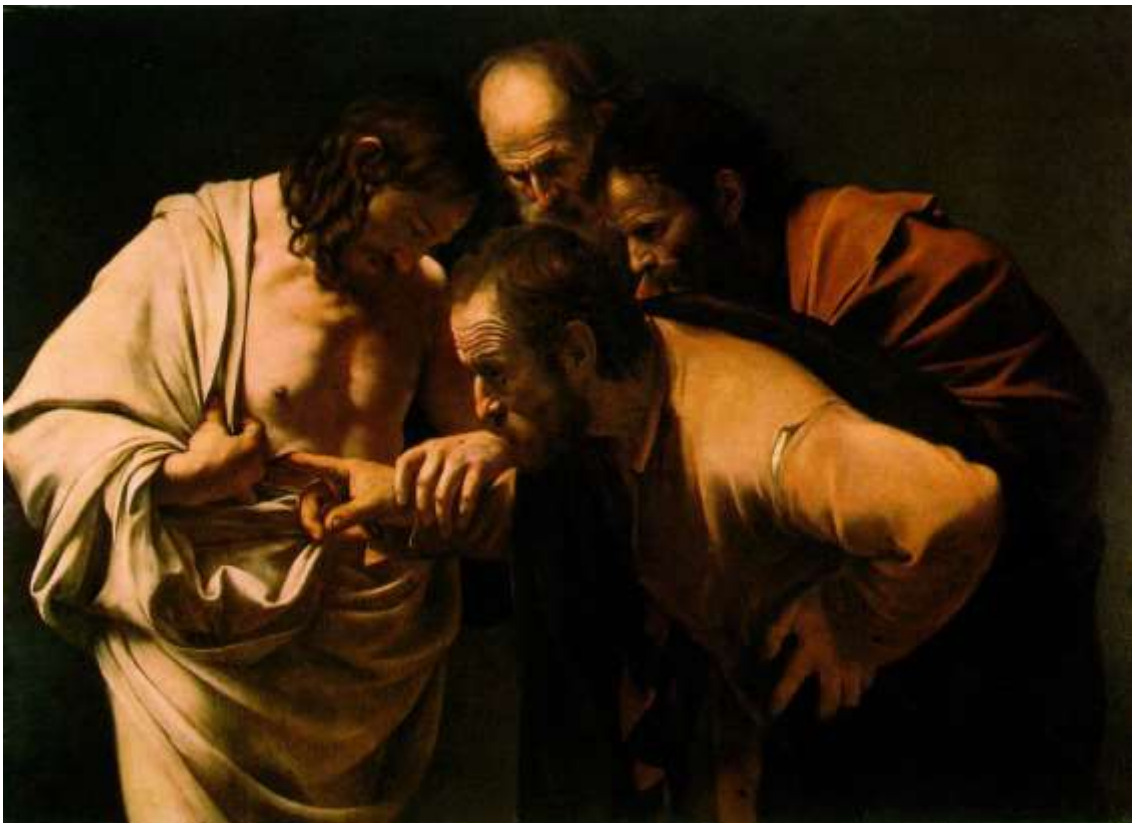
(prema: Gombrich, E. H. (1999), Povijest umjetnosti: Zagreb: GOLDEN MARKETING. str.392.) SLIKA 3: Michelangelo Merisi da Caravaggio „Nevjetni sv. Toma“, 1601.-02. godine

Dramatičnost u navedenom prizoru pojačava i Isusova ruka koja drži ruku sv. Tome kao da njome upravlja i zabija ju duboko u ranu, odnosno u dubinu sv. Tominog nepovjerenja. Njegov je prst toliko duboko zabijen u ranu da nam napeta koža oko rane djeluje kao komad tkanine a ne živog tkiva, obzirom da Isusov izraz lica ne odaje osjećaj fizičke boli zbog ranjenog tijela. Na dramatičan je način promijenjen doživljaj i definiranje umjetničkog djela kao prikaza uljepšane stvarnosti ili imaginacije. Caravaggio je izabrao prikazati stvarnost i imaginaciju kako bi ih približio promatraču, bez skladnih lica i magičnih atmosfera. Njegovi su prikazi smješteni u interijere i eksterijere iz svakodnevnog života, ljudi koji predstavljaju određene likove nose lica iz običnog puka, a prizori su predstavljeni u krupnim kadrovima s naglašenim chiaroscuroom koji vlastitim ritmom čine snažne kontraste koji su u službi dramatičnosti određenog trenutka. 29