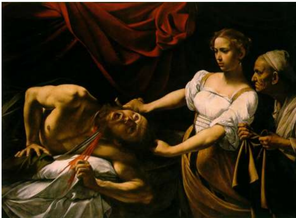
SLIKA 1: Artemisia Gentileschi „Judita ubija Holoferna“, 1614.-20. godine

(prema: https://www.ibiblio.org/wm/paint/auth/caravaggio/ )