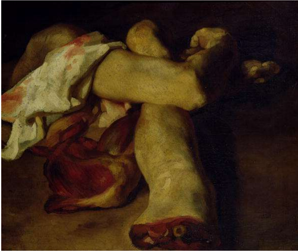
SLIKA 22: Theodore Gericault „Anatomski komadi“, 1819. Godine