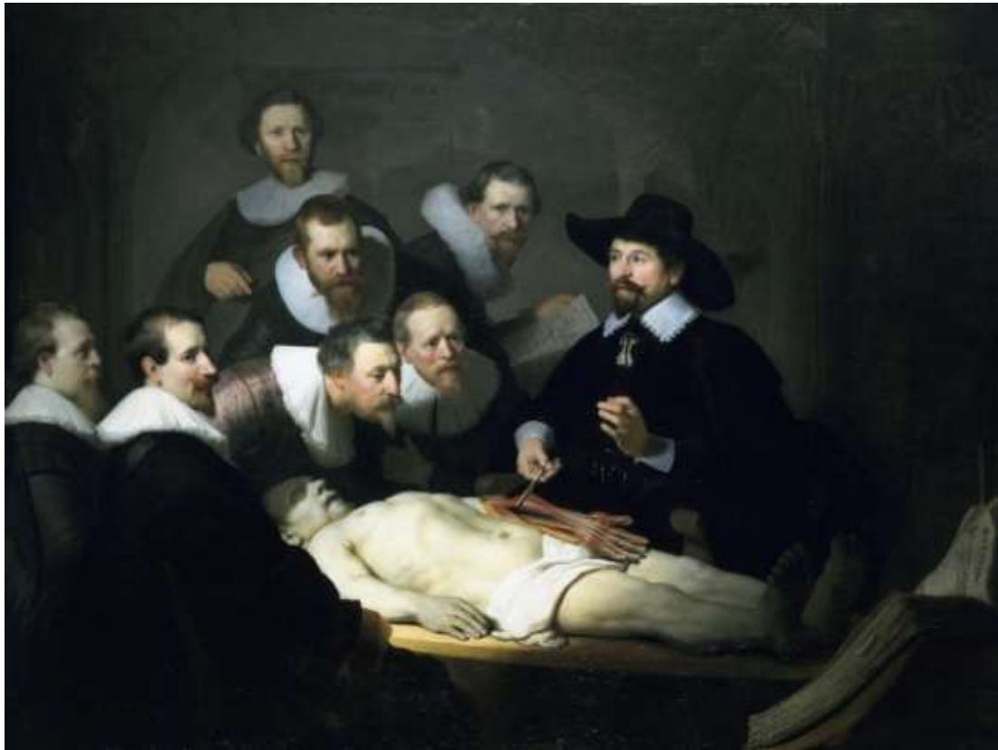
(prema: Bockemühl, M. (2006), Rembrandt - Misterij otkrivene forme. Zagreb: V.B.Z. d.o.o. str. 42 i 43.) SLIKA 21: Rembrandt van Rijn „Dr. Nicolaes Tulp pokazuje anatomiju ruke“, 1632. godine

Kako barok donosi promjene doživljaja i definiranja umjetničkog djela kao takvog, te kada je riječ o čovjeku kao jednom od glavnih okupacija u umjetnosti, prema već navedenom jasno je kako će upravo čovjek postati predmetom proučavanja gotovo svakog umjetnika, te da će se u nekom trenutku na ljudsko biće gledati kao na objekt proučavanja od psihologije do anatomije. Čak i pri afirmaciji umjetničkog izraza u pogledu prikaza seciranja ljudskog tijela u baroku i dalje je jasno kako je riječ o seciranju čovjeka kao modela, bio on živ ili mrtav. Trenutak kada više neće biti moguće čovjeka definirati kao takvog, bez obzira na stanje, život ili smrt, biti će razdoblje romantizma. Slikom 22 „Anatomski komadi“ Theodore Gericault prikazuje udove, odnosno komade ljudskoga tijela, te ovdje nije riječ o ljudskom biću i ne može se svrstati u studiju ljudske anatomije, već je riječ o objektima koji bi se prema kategorizaciji tematike mogli svrstati, bez obzira na morbidnost, u prikaze mrtve prirode. Kroz prikaze ljudske anatomije jasno je kako je čovjekova fizionomija proučavana kroz stoljeća, a sve u svrhu što vjerodostojnijeg uprizorenja čovjekova tijela, te potom i prikaza ljudskoga karaktera i psihologije čovjeka što isto tako zahtjeva umjetnikovo poznavanje fizičkih obilježja. Kako bi se umjetnik mogao dublje posvetiti proučavanju čovjeka, te na kraju prikazati ljudsku psihu, stanje, raspoloženje i drugo na što utječe položaj mišića ili za prikaze za koje su potrebna