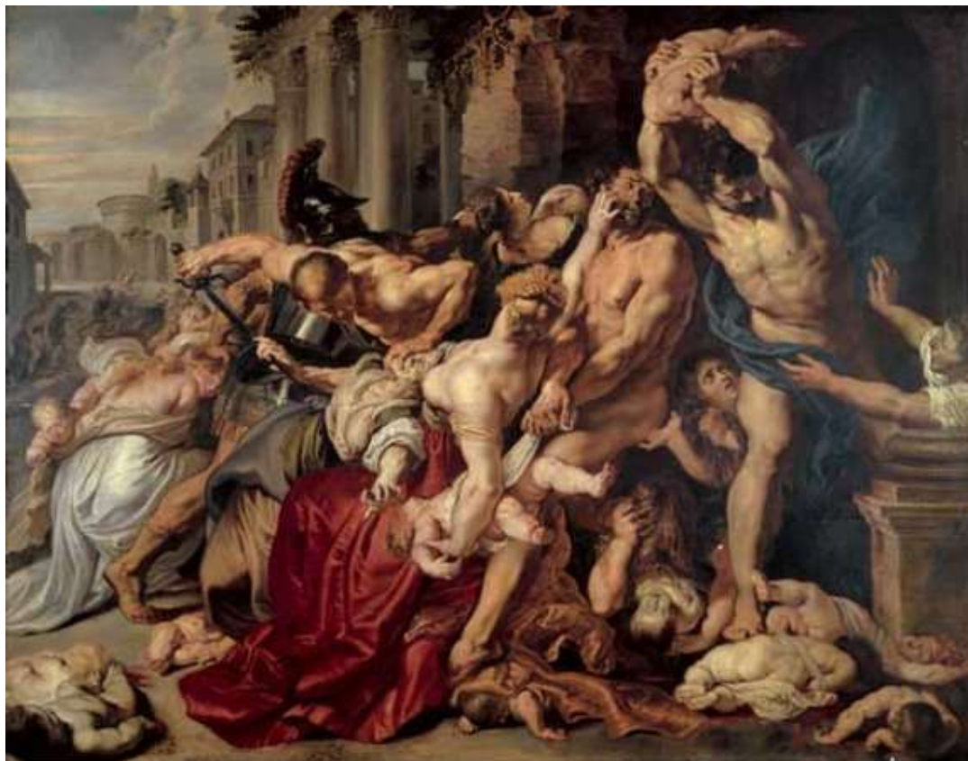
SLIKA 7: Peter Paul Rubens „Pokolj nevinih“, 1611. godine