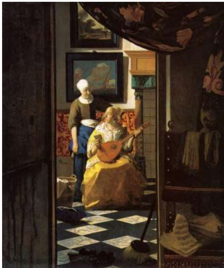
(prema: Kjarini, M. (1987), Vermer. Beograd: „Vuk Karadžić“) SLIKA 17: Jan Vermeer „Ljubavno pismo“, 1666. godine

Slika 17 pod nazivom „Ljubavno pismo“ Jana Vermeera prikazuje uobičajenu ljubavnu priču kroz motiv žene. Mlada žena prima ljubavno pismo te s iščekivanjem gleda u svoju sluškinju držeći u ruci loutu. 44 Prema znakovima unutar slike možemo zaključiti da se radi o pismu njezina zaručnika ili supružnika. Lauta kao simbol ženske seksualnosti upućuje nas na zaključak da se radi o vezi seksualne prirode, brod na mirnom moru koji je naslikan na slici u pozadini znak je ljubavne veze s porukom kako je sve u redu, odnosno da mlada dama prima pozitivne vijesti. Naizgled jednostavan prikaz iz svakodnevice mlade žene donosi nam ljubavnu priču, bez nazočnosti muškarca, koja se skriva u suptilnim znakovima koji su bili karakteristični za čitanje genre scena u baroku.