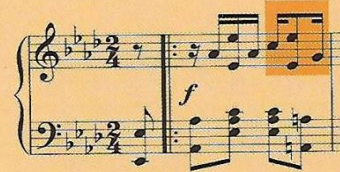
Sinkopa u Maple Leaf Ragu Scotta Joplina

Harmonija ranoga jazza slična je harmoniji klasične glazbe i koristi se uglavnom osnovnim harmonijskim funkcijama. S godinama su harmonijski jezik jazza i ritam postali nevjerojatno složeni i profinjeni.