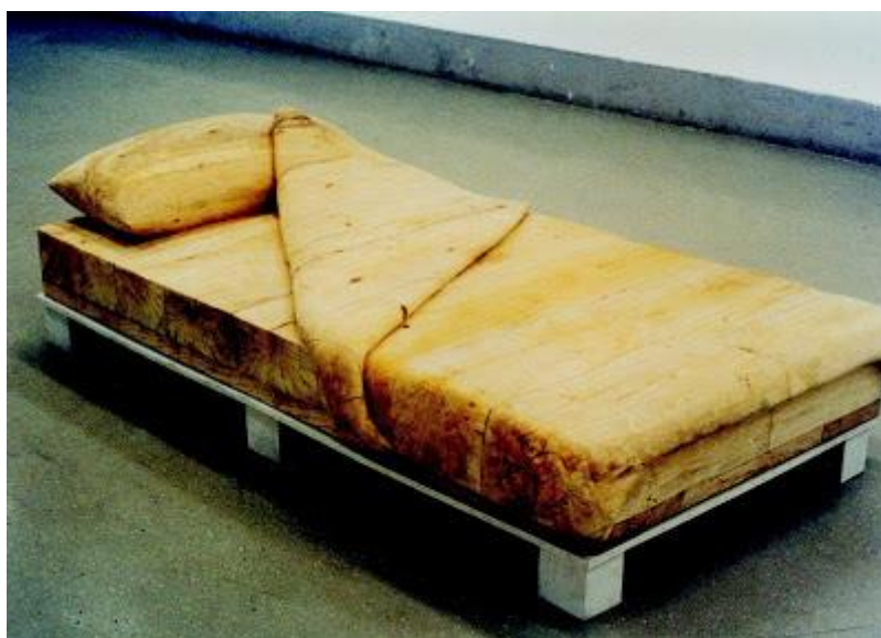
Prilog 10 – Krašković, Denis, Krevet , 1998. Prema: http://kraskovic.blogspot.hr/2006/12/krevet.html