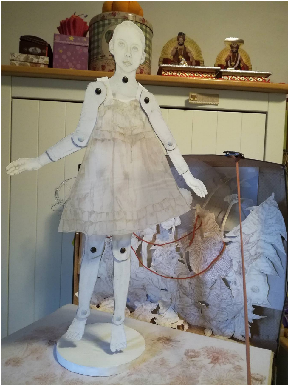
Slika 4: Scena 3- Livada, v.101 x š.78 cm., crtež crvenom i smeđom kredom

Scena smještena u putnom kovčegu sastavljena je od mnoštva detalja oslikanih u Škrinjaričinoj priči koji nam dočaravaju radnju. Valovit tok crte dominira i oblikuje scenu. Crtež oblikovan linijom – listovi, cvjetovi i cvijetne stapke, pauk, klupko vune- naknadnim izrezivanjem iz bjeline papira dobiva dubinu i mogućnost kretanja u prostoru koji nije ograničen na plohu. Iscrtani detalji poprimaju volumen gotovo nezamjetne mase, a masa materijalizira crtu u prostoru tvoreći prostorni crtež. Oblici linijski istanjene i plošno istanjene mase složeni su u slojevitu trodimenzionalnu kompoziciju. Kompozicija je poput