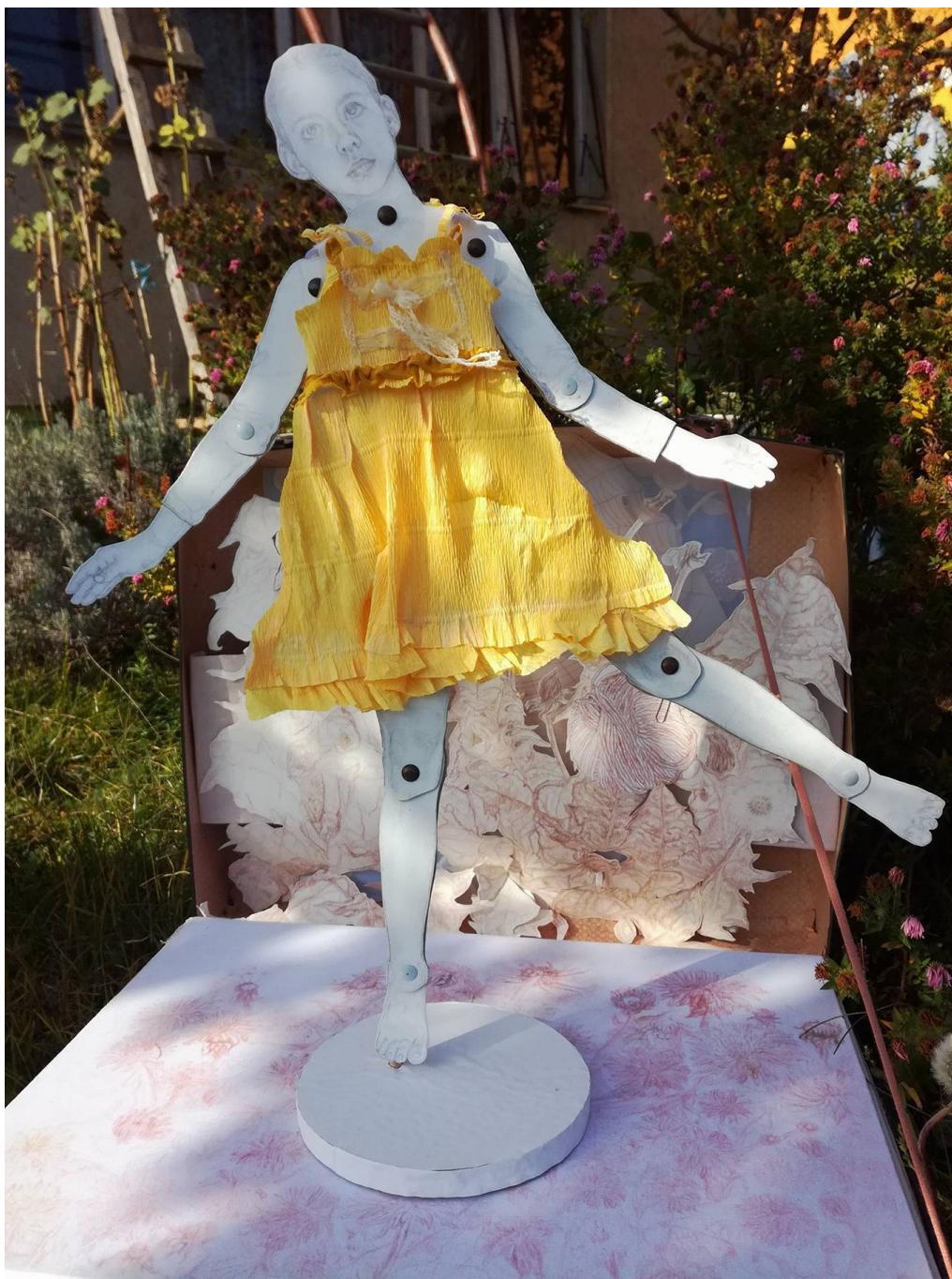
Slika 5: Plesna haljina žutog maslačka, v.101 x š.78 cm., crtež crvenom