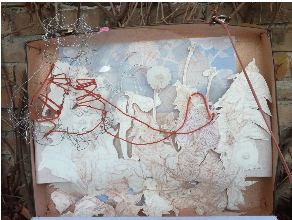
Slika 4: Scena 2 – Livada, detalj, v. 101 x š. 78 cm., crtež crvenom i smeđom kredom