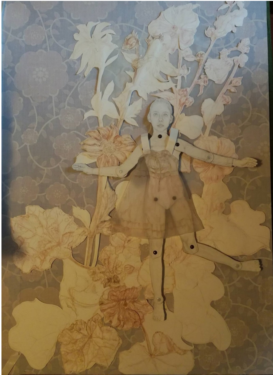
Slika 3: Scena 2 – Cvjetnjak sljeza i georgina, v.101 x š.78 cm., crtež kredom i olovkom na papiru

Na drugoj sceni prikazana je studija cvijeća. Oblik prostora unutar slike izgrađuje tok i karakter crte u raznim formama cvjetova i listova oblikujući vizualni doživljaj prirode. Uprizorenjem cvjetnog vrta ispunjenog sljezovim cvijećem i georginama s djetetom koje u njemu pleše izrazila sam unutarnju potrebu za igrom ispunjenom ljepotom i radošću kakvu samo djeca poznaju. Crvena kreda i suhi pastel oker nijanse crtačka su sredstva kojima je oblikovana kompozicija. Toplina boja crteža koja izvire iz zgusnutijih i rjeđih linija listova i