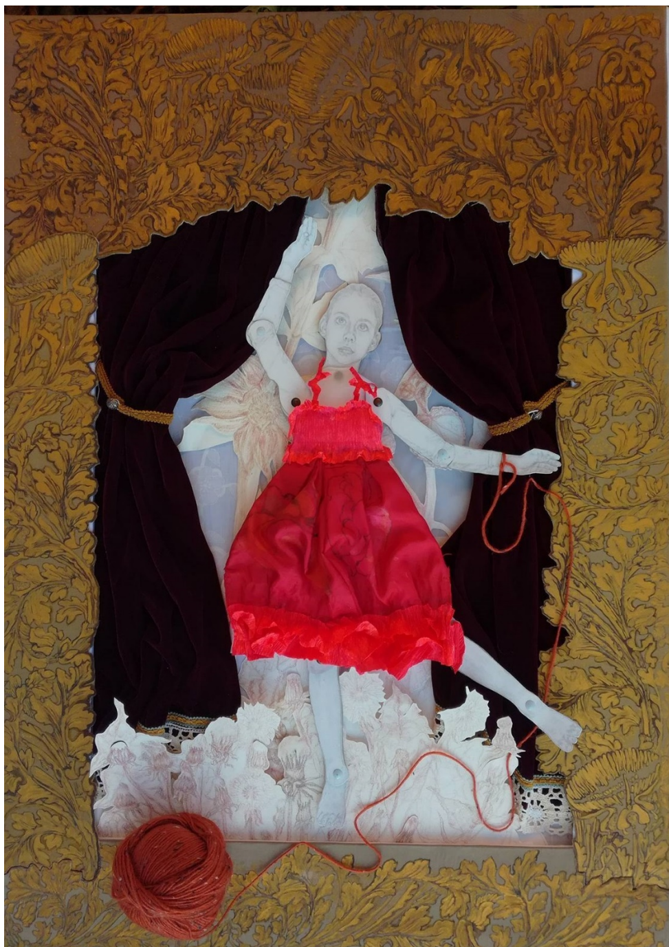
Slika 1: Središnji list sa scenom - prvi plan, v. 101 x š. 78 cm., akril na tkanini i crtež na papiru

Na prvoj slici pred nama se rasprostire središnji list iz kazališne knjige. U otvoru lista „ulaz“ je u unutrašnjost scenskog prostora. Scenski prostor je bojama, ornamentikom i teksturom osmišljen po uzoru na interijer baroknog kazališta. Raščlanjen je bogatim florealnim okvirom, gustim zastorom i cvijetnim interijerom. Barokiziran otvor, bujnim zlatno oslikanim