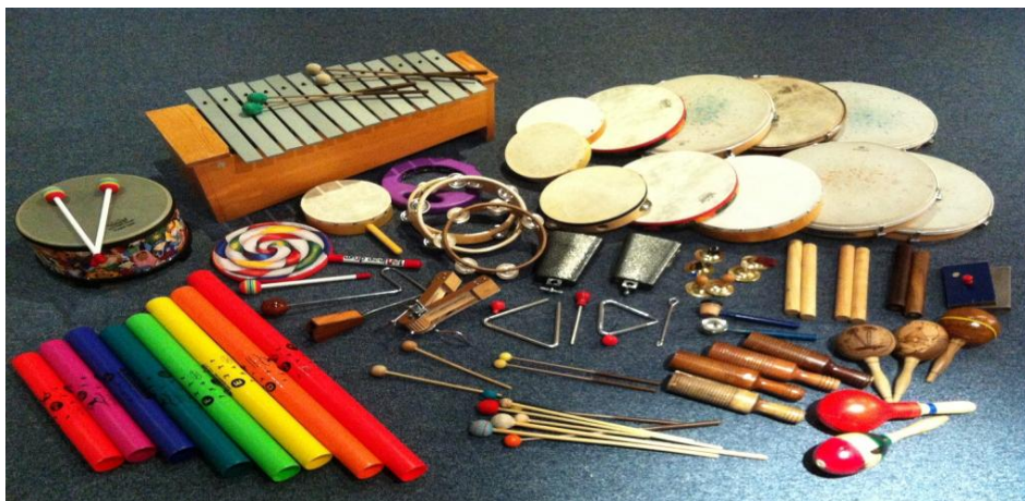
Slika 1. Orffov instrumentarij

Orff-Schulwerk predstavlja aktivan i kreativan način glazbenog obrazovanja. Glazba se uči kroz pjesmu, govor, ples i sviranje. Naročito je bitna atmosfera koja nije natjecateljska već se temelji na osjećaju zadovoljstva. Uz pjevanje ili recitiranje djeca mogu izvoditi pratnju na melodijskim instrumentima (metalofonu, ksilofonu, blok-flauti) ili raznim udaraljkaama koji dobivaju zajednički naziv tzv. Orffov instrumentarij (slika 1). S takvim instrumentima postižu se visoki stupnjevi muziciranja već u ranoj dječjoj dobi. Djeca se mogu skupiti i u manje orkestre pojedinačno svirajući neki instrument (Požgaj, 1975; Kennedy, 2004).