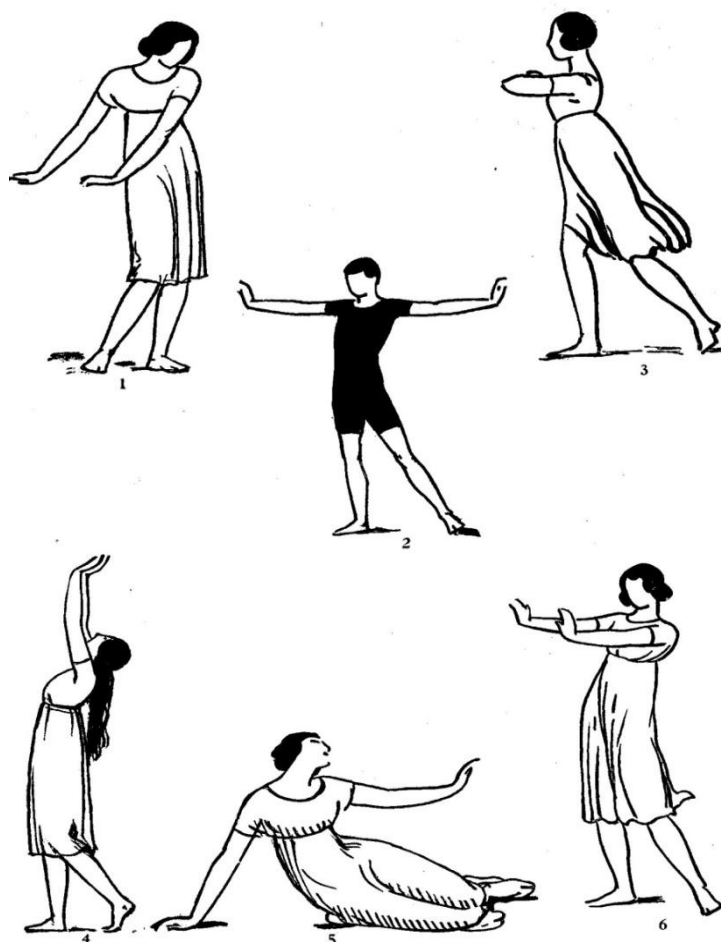
Slika 3. Šest faza Dalcrozeove euritmike (Naumburg, 1914)

na drugoj prema gore, iznad glave. U \frac{3}{4} mjeri ruke su dolje pored tijela na prvoj dobi, potom podignute na bočnim stranama, zatim iznad glave na trećoj dobi. U \frac{4}{4} mjeri umetnut je još jedan pokret. Prvi je pokret spuštene ruke pored tijela, drugi su ruke prebačene ispred tijela, treći pokret ruke su na svakoj strani i četvrti pokret su ruke iznad glave na završnoj dobi. Pogled na sliku ovu ideju će učiniti jasnijom (slika 3). Figura pod brojem jedan pokazuje varijaciju prvog pokreta u bilo kojoj mjeri. Druga figura pokazuje drugu poziciju u \frac{4}{4} mjeri, četvrta figura prikazuje konačnu poziciju u bilo kojoj mjeri. Prateći ilustraciju po redu od brojeva jedan, tri, dva, četiri, prikazane su 4 pozicije. Kad ih poredamo imamo pokrete za \frac{4}{4} mjeru. Figura pod brojem pet je slobodna interpretacija, u kojoj pokret tijela izražava notno trajanje, dok pokret ruku izražava mjeru. Figura pod brojem šest je četvrta pozicija ruku u \frac{6}{4} mjeri. Notno trajanje se izražava unaprijed pokretom nogu i tijela (Naumburg, 1914).