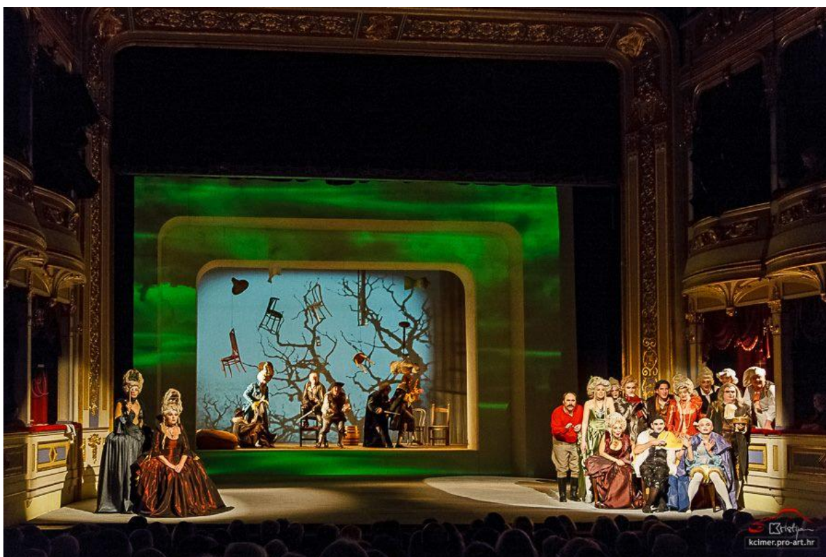
Slika 4: Cjelokupna scena; zadnja scena u predstavi