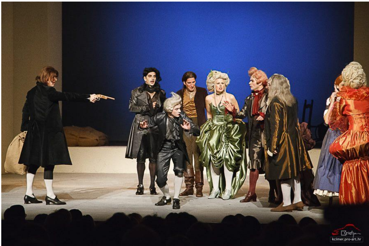
Slika 5: Gašo priznaje gospodi svoje grijehe

Kostim Gaše je u originalnom stilu rokokoja; duge bijele čarape, poluotvorene crne cipele, uske crne hlače do koljena, raskošna široka siva košulja, uski crni sako te pufasta marama oko vrata. Šminka je također u istom stilu – ten je posvijetljen tako da se pokaže porculanska put s rumenim obrazima i crveno istaknutim ustima. Na glavi je bijela,visoko počešljana stilska perika. Cijeli kostim je skrojen tako da je sam po sebi nametnuo kôd kretanja jer zbog svoje neelastičnosti i uskog kroja nisam ga mogao udobno obući ako nisam imao pravilan stav. Doduše, to je sa sobom nosilo i određena ograničenja u izvedbi, ponajprije u trećoj sceni, kada razbojnici upadaju na dvor. Scena u kojoj sam trebao glumiti udarce razbojnika, koji su gradirali od slabijih prema jačima, zahtijevala je od mene prilagodbu u načinu primanja tih udaraca. Kostim me ograničio da dižem ruke visoko u zrak, ali i da se sagnem ili previjem u struku. Ono što sam mogao napraviti jest kleknuti i još se pritom spustiti na ruke tako da sam četveronoške. Zato sam prvi udarac primio tako što sam izdužio tijelo do granice koje sam mogao i pripomogao si naslanjanjem na ložu, drugi udarac sam primio blago se sagnuvši u tijelu prema naprijed, koliko god mi je kostim do dopuštao, a treći udarac sam odigrao padom na pod u ispruženom stavu, ustajući vrlo polako i pažljivo do uspravnog stava.