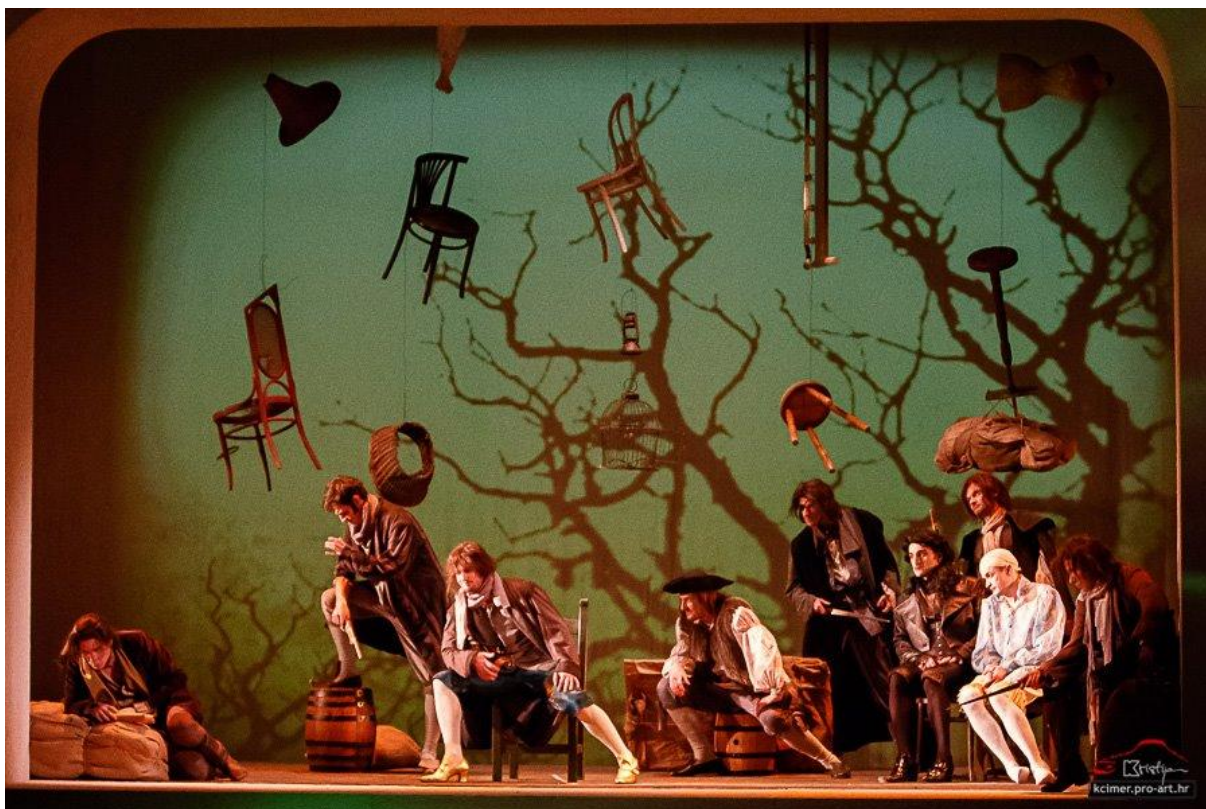
Slika 3: Razbojnički logor