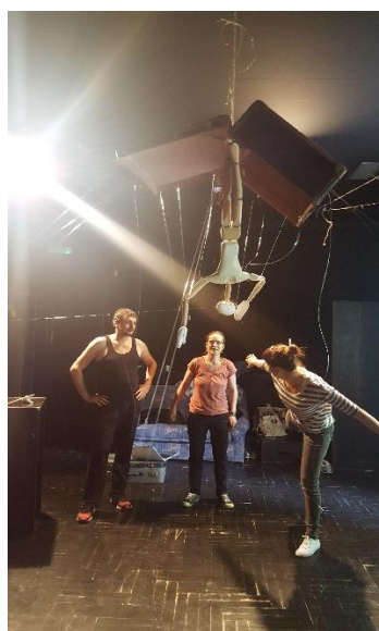
Slika 7: Isprobavanje pada