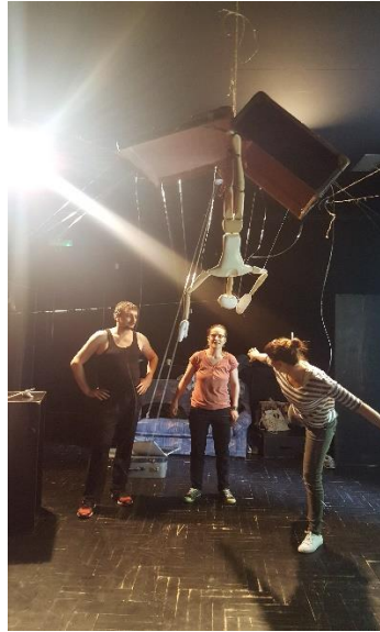
Slika 7: Isprobavanje pada