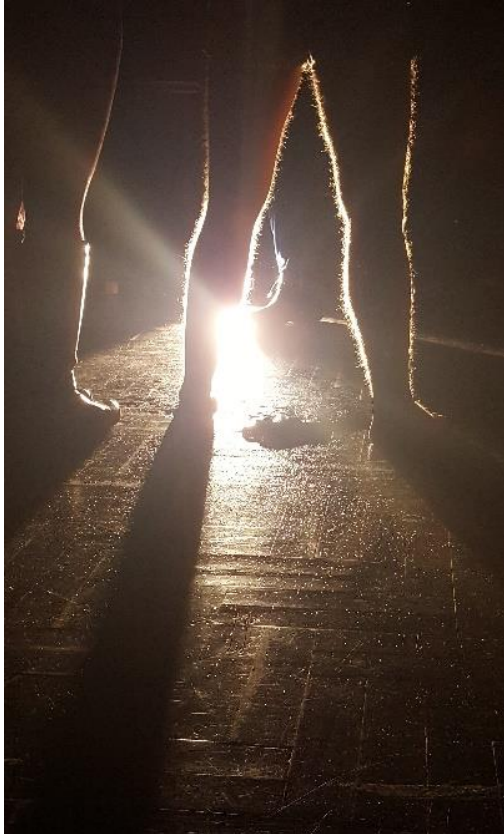
Slika 2: Lutkari na ispitivanju

ostatak publike iz linije sa zida smo izveli vani, gdje ih je na podu dočekala krv ubijenog bjegunca. To je bio kraj. Publika je izašla puna dojmova, neki od njih u šoku i strahu, a neki od njih uzbuđeni. Naš cilj da što vjerodostojnije uprizzorimo život lutkara na frontu bio je uspješno izvršen. Svime ovime zakoračili smo u moguću tematiku našeg daljnjeg rada na diplomskom ispitu iz lutkarstva.