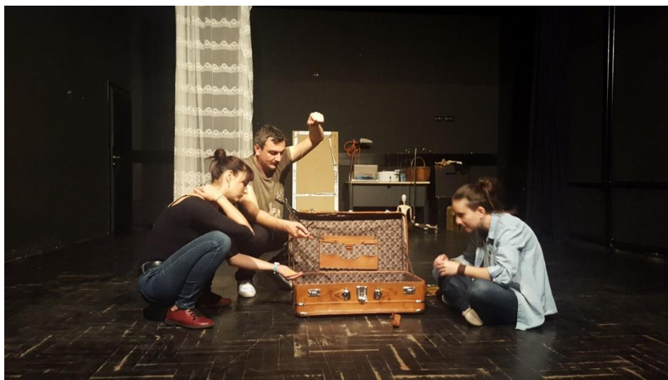
Slika 11: Radni kofer kupatila

Drugi važan kofer bio je kofer u koji se morala instalirati mala kupaonica za marionetu. Taj kofer je morao biti posebno čvrst, tako da smo tražili najčvršći, a opet i dovoljno velik kofer. Nakon što smo ga pronašli, predali smo ga Aleni, a ona je unutar njega ugradila malenu kadu, pločice i ogledalo te držač za četkicu za zube. Nakon što ga je Alena sredila, kofer je poprimio sasvim drugo značenje, nego što je imao do tada.