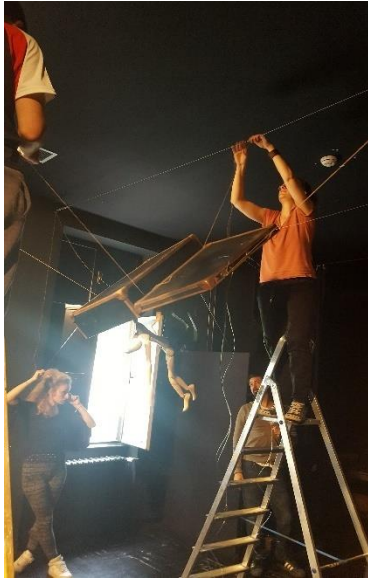
Slika 6: Namještanje lutke