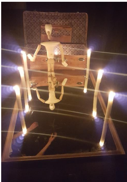
Slika 9: Marioneta pred koferom

Sedma scena, ujedno i posljednja u našoj predstavi bila je rastanak od lutke. Svi animatori zajedno vodili smo lutku od ruke do ruke, prebacujući njezin križ od jednog do drugog sa velikim oprezom. Lutka je hodala po ogledalu između svijeća i svatko od nas morao ju je oprezno voditi da slučajno