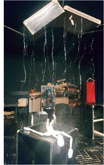
Slika 8: Lutka nakon pada

Sedma scena, ujedno i posljednja u našoj predstavi bila je rastanak od lutke. Svi animatori zajedno vodili smo lutku od ruke do ruke, prebacujući njezin križ od jednog do drugog sa velikim oprezom. Lutka je hodala po ogledalu između svijeća i svatko od nas morao ju je oprezno voditi da slučajno