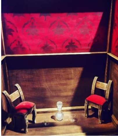
Slika 18: Pravi kovčeg u nastanku

Kovčeg za ručne lutke bio je kvadratnog oblika i iznutra je bio osmišljen kao vrsta saune. Unutar drvenog kovčega oslikano je kao da izgleda da su unutra na zidovima ljestvice, a u kutovima su postavljene suhe biljčice. Taj kovčeg je imao rupu odozdo na dužoj strani, da bi se kroz njega moglo igrati ručnim lutkama, a vrata su mu se otvarala prema publici i visjela prema dole, tako da sakrije animatore tokom igre.