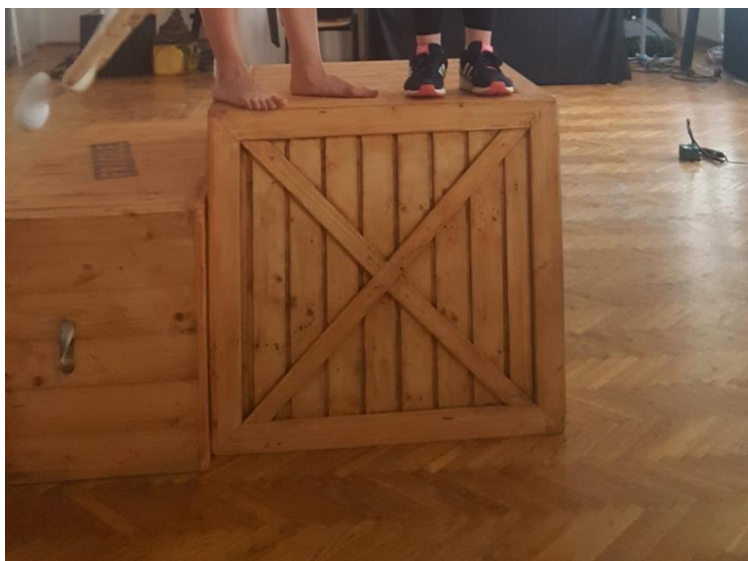
Slika 16: Kockasti kovčeg

No, tu nije kraj našim kovčezima. Neki od najzanimljivijih kovčega, koji su se trebali izraditi, bili su oni za lutke, dakle, kovčezi, u kojima će zaista neke lutke s nama putovati u Italiju, odnosno kovčezi, unutar kojih će se odigravati lutkarske etide s marionetama, ručnim lutkama i štapnim lutkama. Ti kovčezi su imali mogućnost otvaranja te smo tako dobili dojam da publika ulazi u priču, koja se događa unutar kovčega.