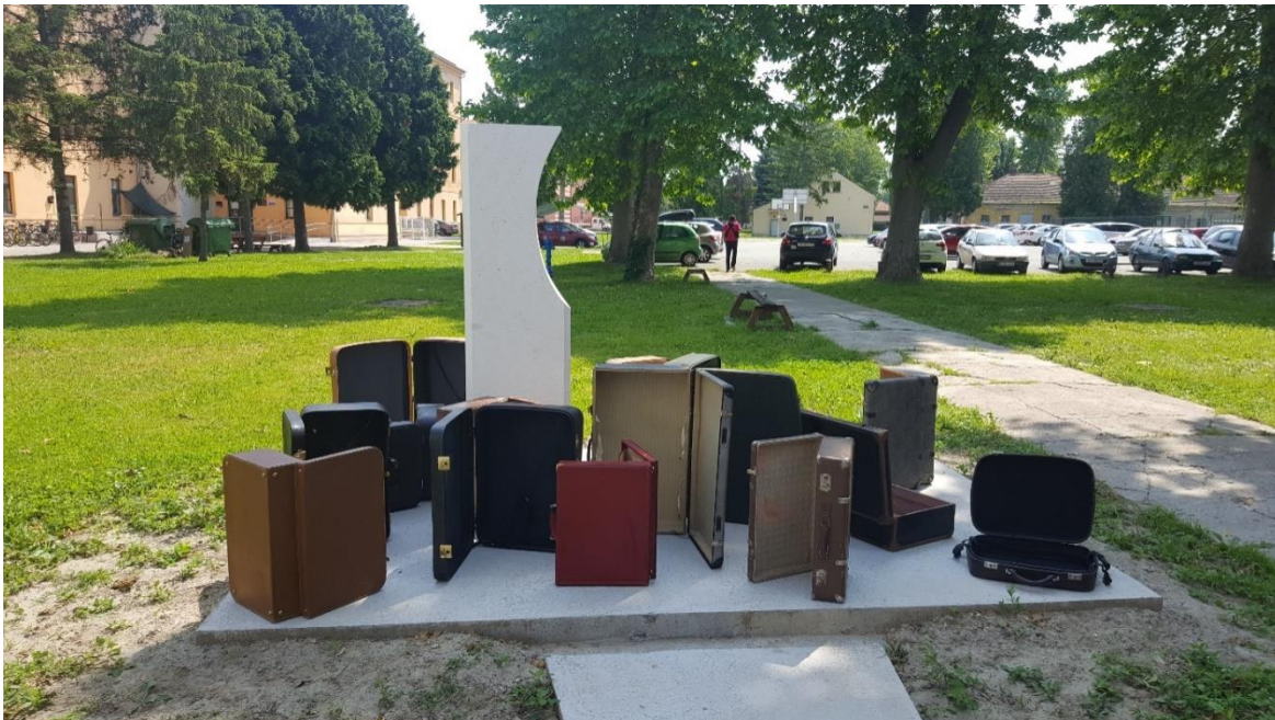
Slika 10: Koferi nakon čišćenja

Sa svim idejama koje smo imali na papiru i u glavi krenuli smo raditi na našoj predstavi. Za početak smo se poigrali s koferima, koji označavaju putovanje negdje. Budući da su naši veliki lutkari stalno putovali po svijetu, tako smo i mi odlučili da će putovanje biti jedna od poveznica naše predstave s njihovim životom. Tako smo se angažirali oko pronalaženja i sakupljanja kofera, koji bi bili adekvatni za lutkarsku igru i koji bi se možda mogli prilagoditi za neku drugu upotrebu unutar predstave. Svoju potragu smo suzili na traženje starinskih kofera, koji su se nekad koristili, a ne današnjih, modernih kofera na kotačiće. Tražili smo kofere, koji su po svojoj strukturi krući, tako da se s njihovim kosturima može nešto izraditi. Budući da smo zamislili određene dijelove gdje bi sami koferi imali drugačiju funkciju, osim prostora za pakiranje robe i potrebitih stvari u njih. Tražili smo ih na raznim lokacijama, ali ipak je odlazak docentice, Tamare Kućinović na tržnicu automobila najviše urodio plodom. Sakupili smo dovoljno kofera s kojima smo mogli početi osmišljavati i dalje graditi scenografiju. Do tog trenutka posjedovali smo samo nekolicinu starih kofera, koje smo našli u fundusu Akademije i koje smo koristili kao moguće opcije unutar igre. No nakon pronalaska novih kofera, zamijenili smo ih, jer su već bili dosta istrošeni.