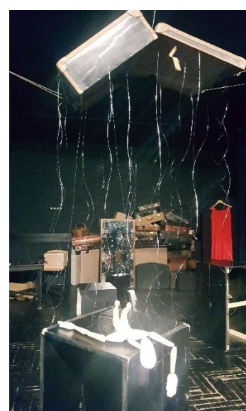
Slika 8: Lutka nakon pada

Sedma scena, ujedno i posljednja u našoj predstavi bila je rastanak od lutke. Svi animatori zajedno vodili smo lutku od ruke do ruke, prebacujući njezin križ od jednog do drugog sa velikim oprezom. Lutka je hodala po ogledalu između svijeća i svatko od nas morao ju je oprezno voditi da slučajno