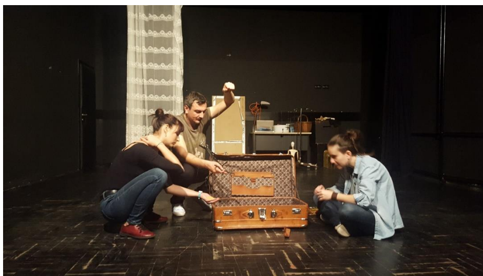
Slika 11: Radni kofer kupatila

Drugi važan kofer bio je kofer u koji se morala instalirati mala kupaonica za marionetu. Taj kofer je morao biti posebno čvrst, tako da smo tražili najčvršći, a opet i dovoljno velik kofer. Nakon što smo ga pronašli, predali smo ga Aleni, a ona je unutar njega ugradila malenu kadu, pločice i ogledalo te držač za četkicu za zube. Nakon što ga je Alena sredila, kofer je poprimio sasvim drugo značenje, nego što je imao do tada.