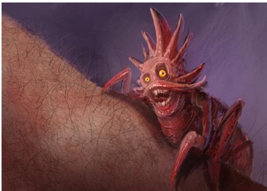
1. Basna „Buha“

Buha je u ovom slučaju je prikazana kao čudovište te joj je veličina prenaplašena kako bi se dočarala nepotrebna muka i strah čovjeka u basni. Bezopasna mala buha ilustrirana je kao veliko čudovište koje predstavlja pravu prijetnju .