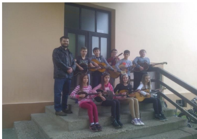
Slika 3. Školski (mali) tamburaški orkestar 9