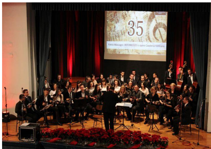
Slika 4. Veliki tamburaški orkestar 10

U tamburaškom orkestru, kao i u ostalim orkestrima, osnovnu tonsku sliku čini zborna postava dionica, odnosno kvartet: brač prvi, brač drugi, čelović (e-brač) i čelo. Svaku dionicu jednakom tehnikom, dinamikom, artikulacijom, agogikom 11 i dr. izvode dva ili više svirača isključujući svaku improvizaciju ili individualizaciju interpretacije (Leopold, 1995:34). Nadalje, Leopold navodi da je od svih hrvatskih narodnih glazbala tambura jedina koja se od solističkoga glazbala razvila u orkestralno (Leopold, 1995). Razvojni vrhunac orkestralnog muziciranja obilježen je 1961. godine utemeljenjem Festivala tamburaške glazbe u Osijeku (Leopold, 1995). Ciljevi Festivala: