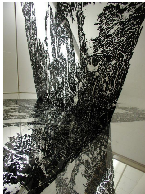
Slika 2. „BABEL“ poledina drvorez na foliji 2007 Slika 3. „PROSTOR“ drvorez na foliji detalj 2007.

koja u ovom slučaju prikladno za motiv uzima modernu ikonografiju nebodera s neonskim reklamama na vrhu zgrade. Dvije identične okomice nebodera, dobivene inverzijom zrcaljenja, spojene su pod kutom prema unutra. Na taj se način “plašt” zgrade iracionalno udvostručuje i razvija, umjesto da zatvara volumen.