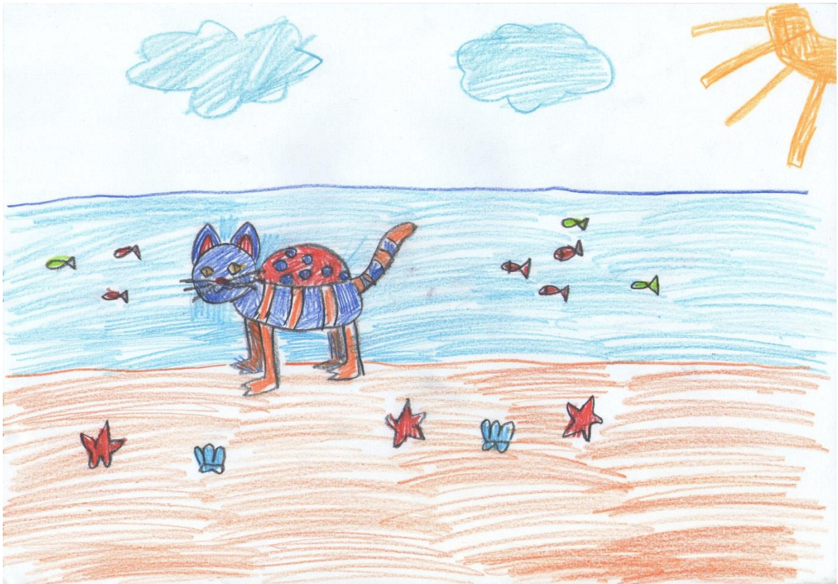
"Oklopljena mačkopatka", Viktorija, 11 godina

Viktorija je izvukla papiriće s imenima mačke, patke i kornjače. Brzo je povezala oklop kornjače s bubamarinim, nacrtavši prepoznatljive bubamarine točke. Stvorenje ima glavu i rep mačke, a noge patke. Smještaj kojeg je Viktorija izvukla je obala mora. Napravila je tri plana: u prednjem je pješčana obala na kojoj je smjestila morske zvijezde i školjke, u drugom planu je more s jatom šarenih riba, a u trećem planu šablonsko sunce u kutu kao i plavi oblaci.