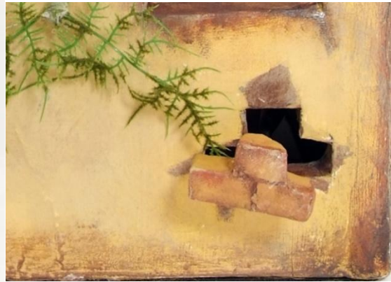
Slika XIV. Milijevova ciglica koja može ispasti