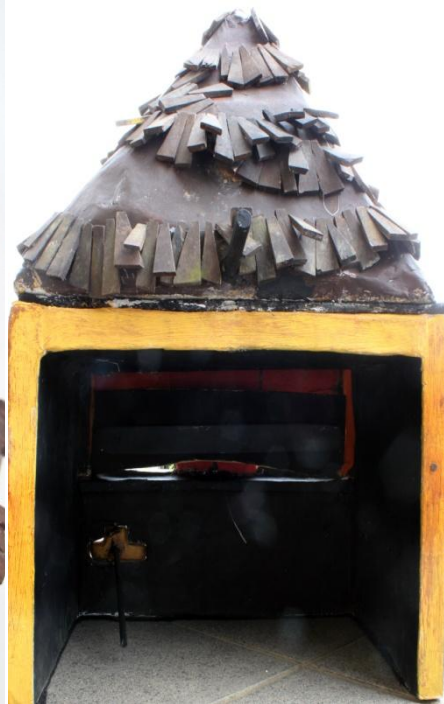
Slika XVI. Milivoj stražnji dio, mehanizmi