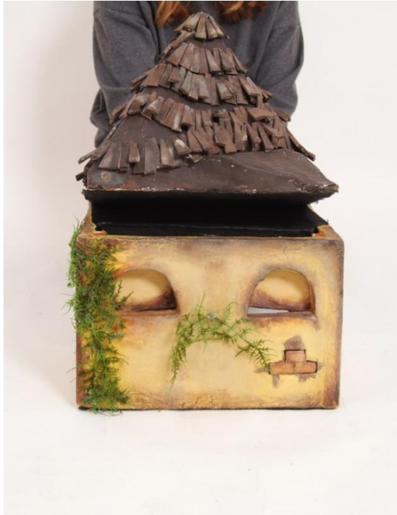
Slika XIII. Milivojev krov – zijevalica