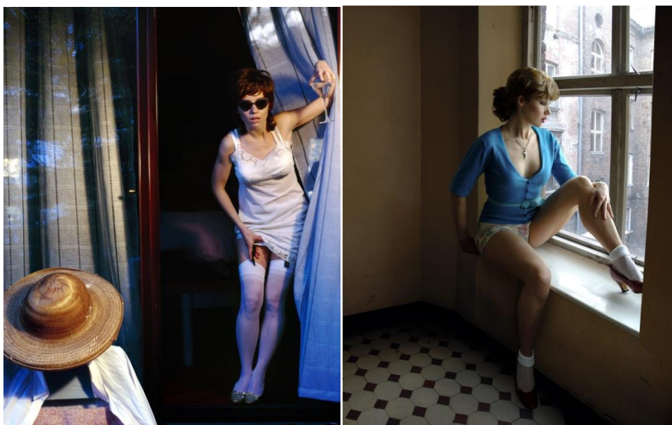
Aneta Grzeszykowska Untitled Film Stills (2006.)