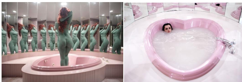
Juno Calypso Honeymoon