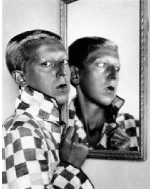
Claude Cahun Self Portrait (1928.)