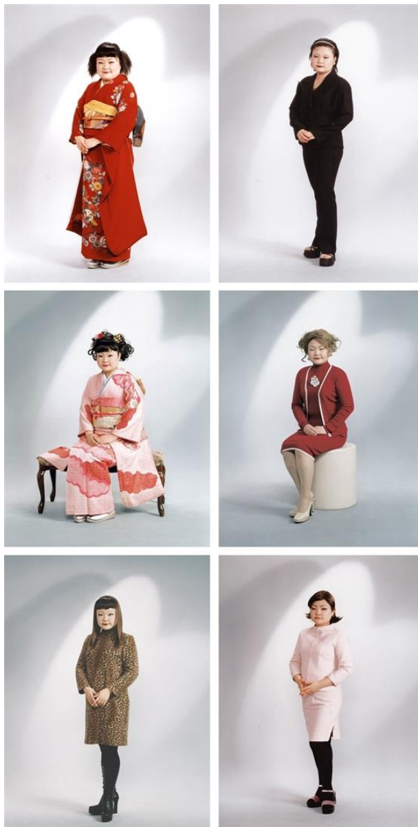
Tomoko Sawada OMIAI

suvremene ekvivalente koji se uklapaju u scenu Varšave. Anita autoreprezentaciju prikazuje kroz višeslojnu imitaciju i lažan identitet koji je umjetnički i fiktivan.