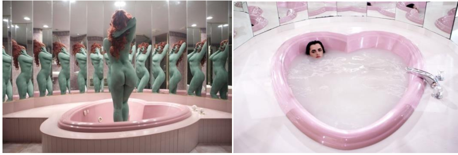
Juno Calypso Honeymoon