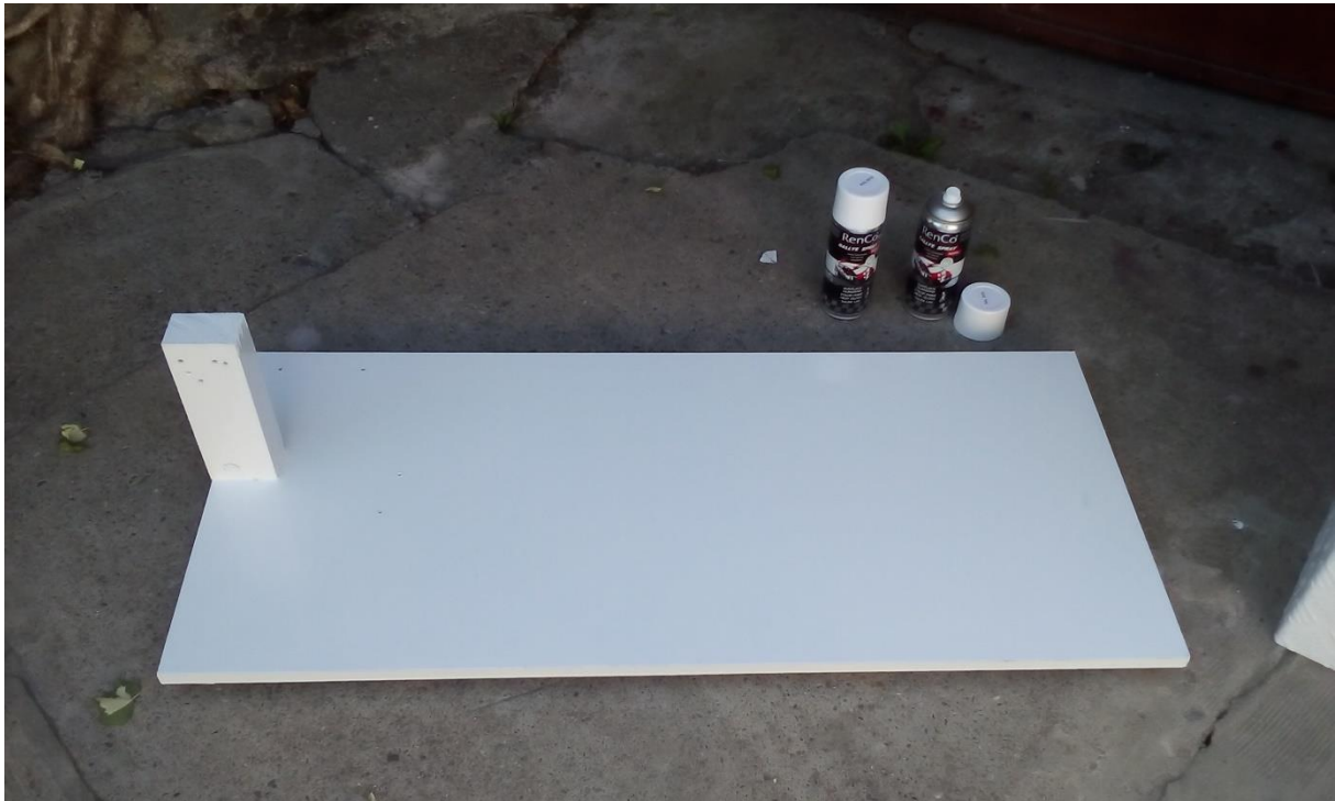
15. Bojanje podloge za českalicu u bijelu boju