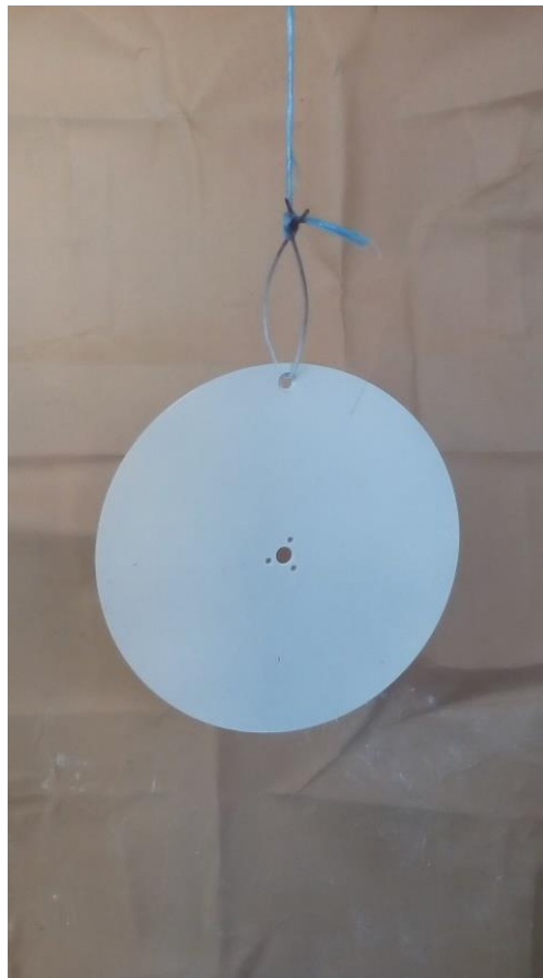
16. Bojanje diska za českalicu u bijelu boju