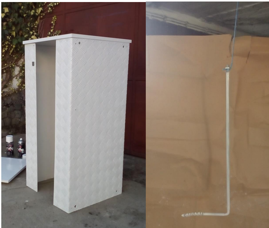
18. Bojanje postolja i "svrdla" (elementa koji ide na postolje) u bijelu boju