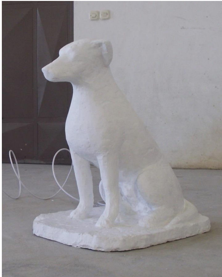
8. Pas u sjedećem položaju, poluprofil