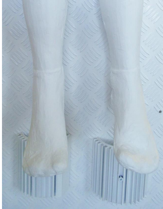
26. Čarape simuliraju udobnost doma

Danas znam da su djeca najpodložnija manipulacijama i obmanama i da sam i sama bila. Zbog silnih reklama, spavala sam sa kutijom slatkiša ispod kreveta, budila se nekoliko puta tijekom noći i kroz san sam ih jela te nastavljala spavati dalje, toliko sam bila ovisna o slatkom. Jednom sam pojela više od pola kile Raffaello kuglica i cijeli sljedeći dan povraćala. Poslije toga, nisam ih mogla okusiti godinama a želudac mi se dizao i kad bi vidjela reklamu. Zato sam nakon toga žderala Mars, Snickers, Twix, Milky way i ostalo!