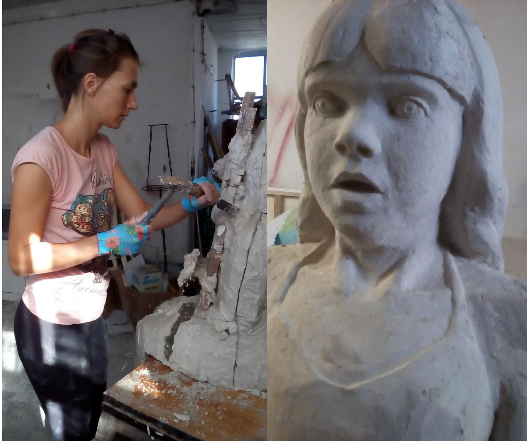
12. Razbijanje kalupa i odljev pozitiva te retuširanje