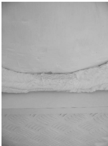
22. Različiti materijali i strukture (gips, sintetička tkanina, oplemenjeni iveral, aluminij)

Odluka da cijelu instalaciju predstavim u bijeloj boji, produkt je svjesnog htjenja da oslobodim publiku boje i tako njihov doživljaj usmjerim prema oblicima, strukturi i značenju cjelokupne kompozicije.