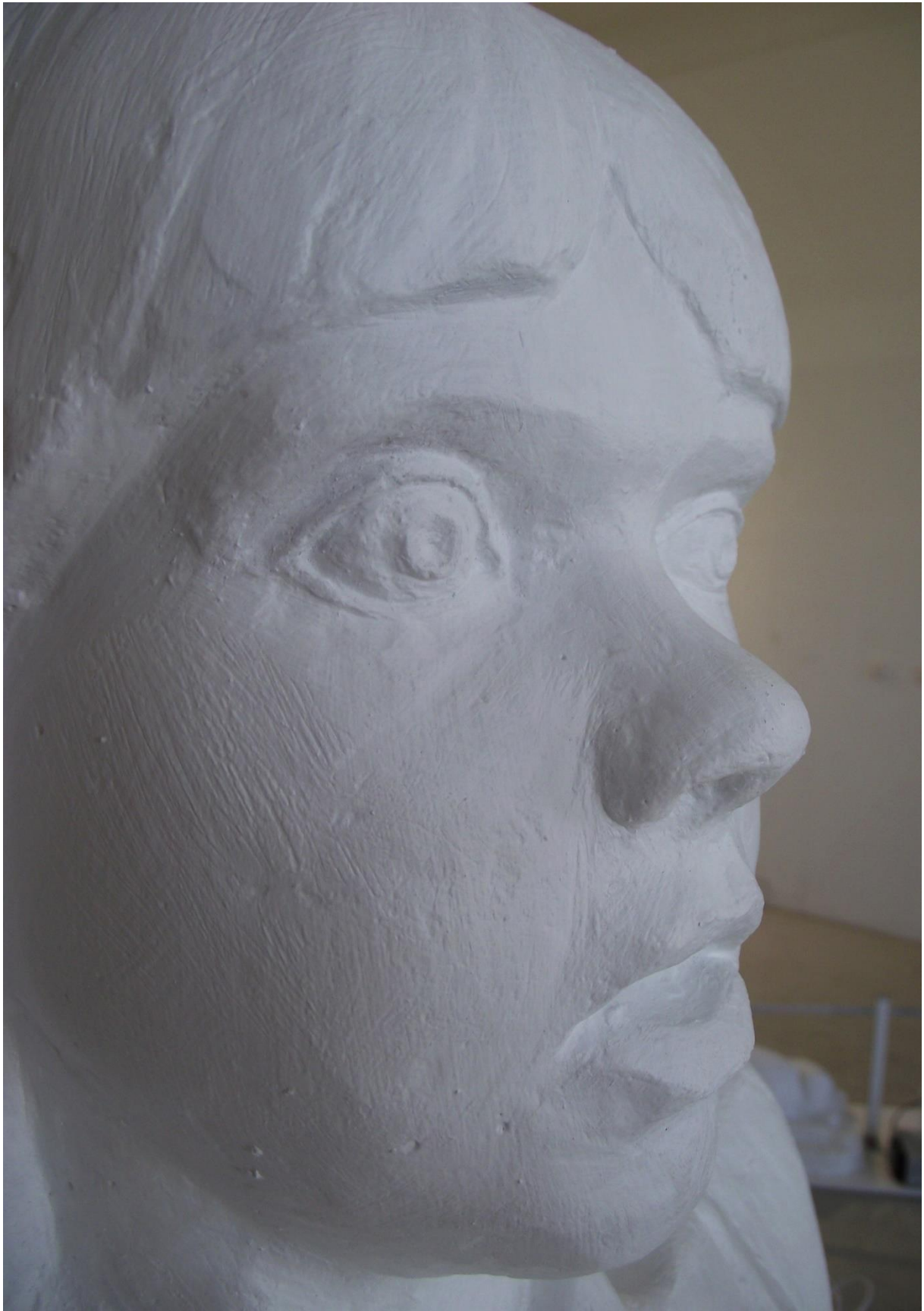
3. Portret djevojčice, poluprofil