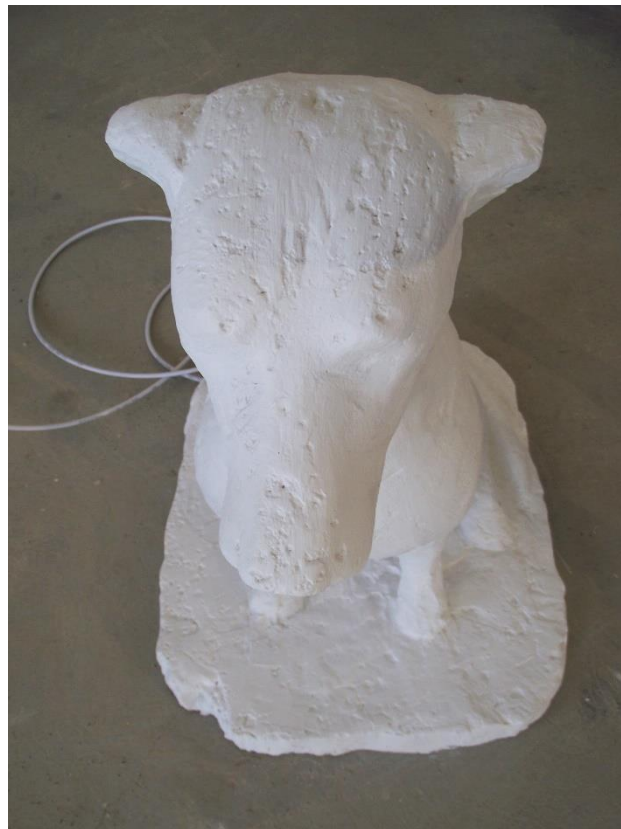
9. "Nagrižena" površina