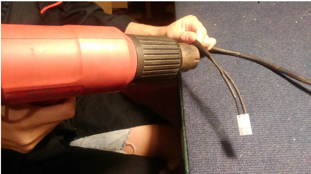
14. Spajanje kablova na naponskom pretvaraču el. en. lemljenjem i stavljanje termo bužira