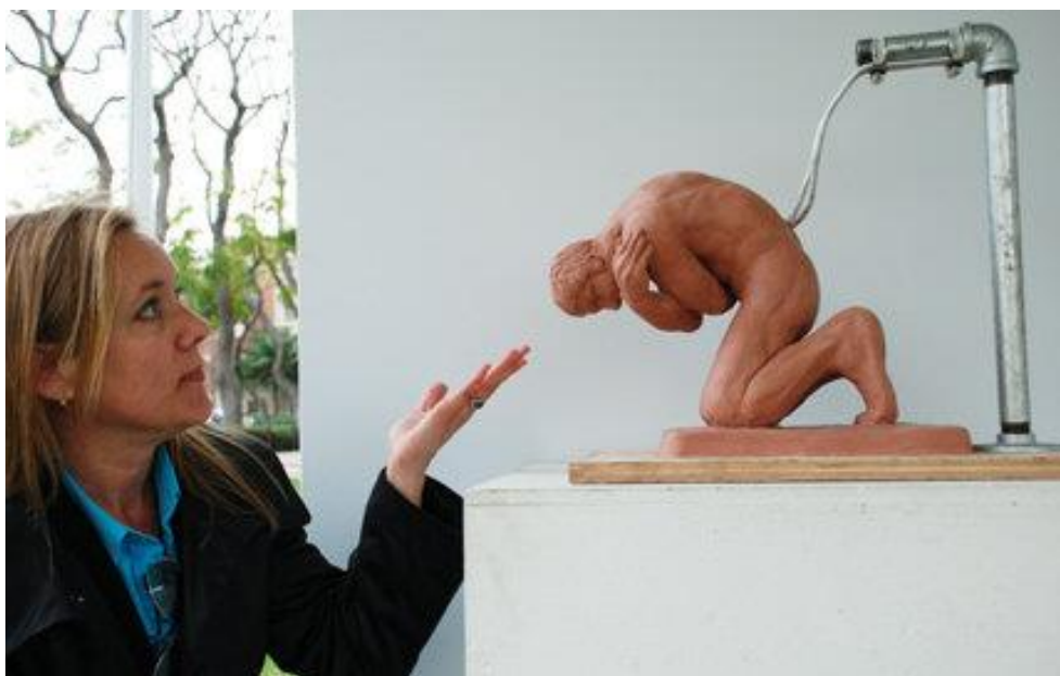
20. Junxian Poon , “Life“ ( www.dornsife.usc.edu )

Pitanjem etike i morala bavi se i umjetnica Kara Walker. Ona radi skulpturu nage žene (crnkinje) od 35 tona šećera u pozi sfinge koja u ovom slučaju aludira na intimnu pozu vođenja ljubavi a predstavlja pitanja rase, seksualnosti (iskorištavanja žena robova), ugnjetavanja, rada i prolaznosti. Mogli bismo reći da je ovdje estetika stavljena u službu etike.