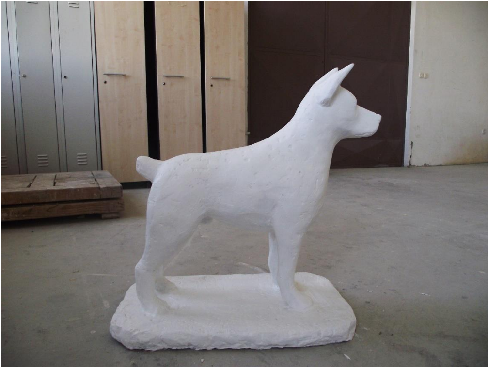
6. Pas u stajaćem položaju, profil