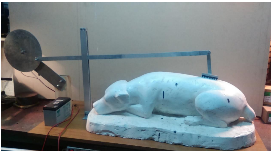
13. Idejno rješenje češkalice za psa (aluminij, iveral, električni motor i naponski pretvarač el. energije)