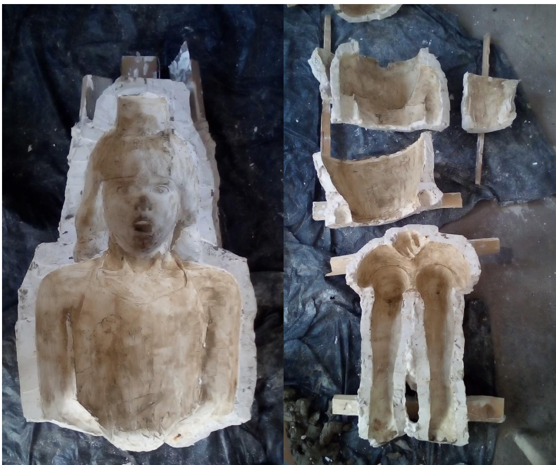
11. Kalupi od gipsa