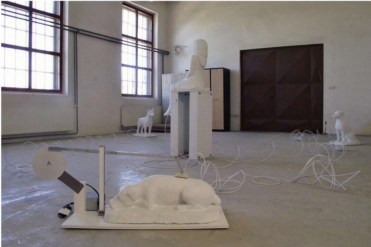
1. Instalacija "Nečujni komarci u noći mladog mjeseca" (četiri figure u gipsu, postolje od aluminija, češkalica na električni pogon, posuda i kabel)