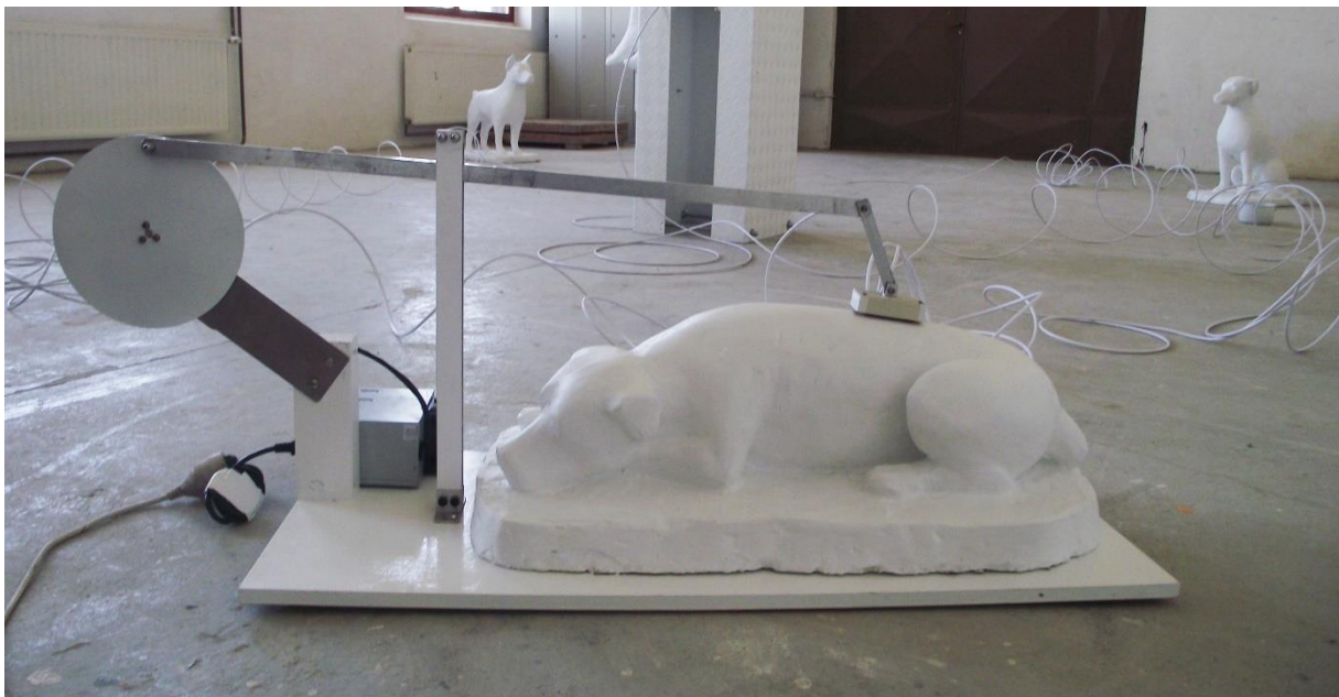
2. Pas u ležećem položaju i el. češkalica