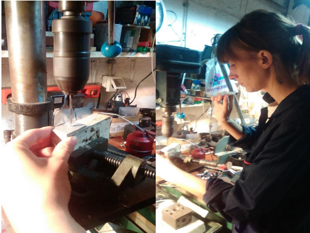
17. Bušenje rupa za vijke koji drže stranice postolja i ploču od iverala