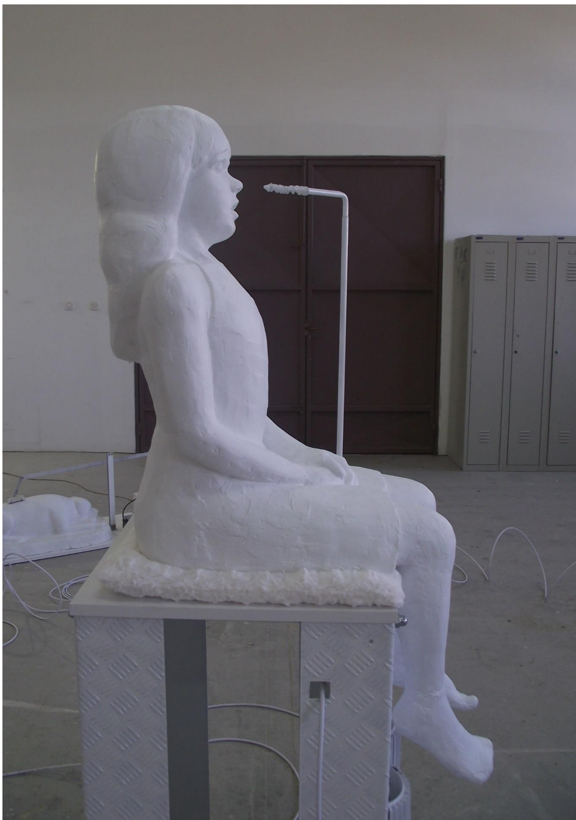
5. Figura djevojčice, profil