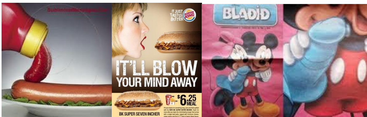
24. Primjeri subliminalnih poruka sa seksualnim aluzijama

Subliminalne poruke se široko koriste i nalaze se svuda oko nas – u glazbi (frazе okrenute naopačke), u TV reklamama, popularnim crtićima i dr. Disney je okrivljen za korištenje subliminalnih poruka u svojim crtanim filmovima, a srećemo ih i u umjetnosti (Leonardo Da Vinci: Posljednja večera i Mona Lisa ).