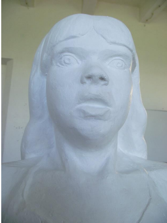
25. Zaprepašten izraz lica