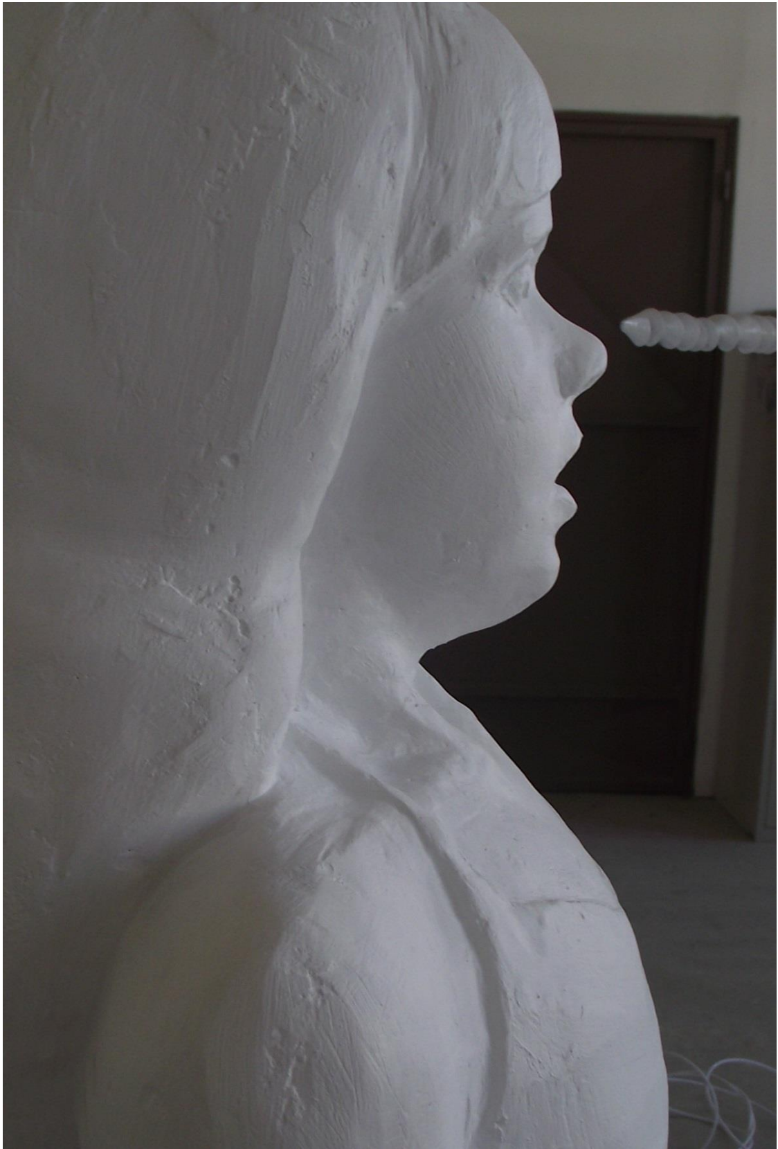
4. Portret djevojčice, profil