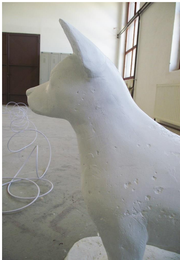
7. "Nagrižena" površina