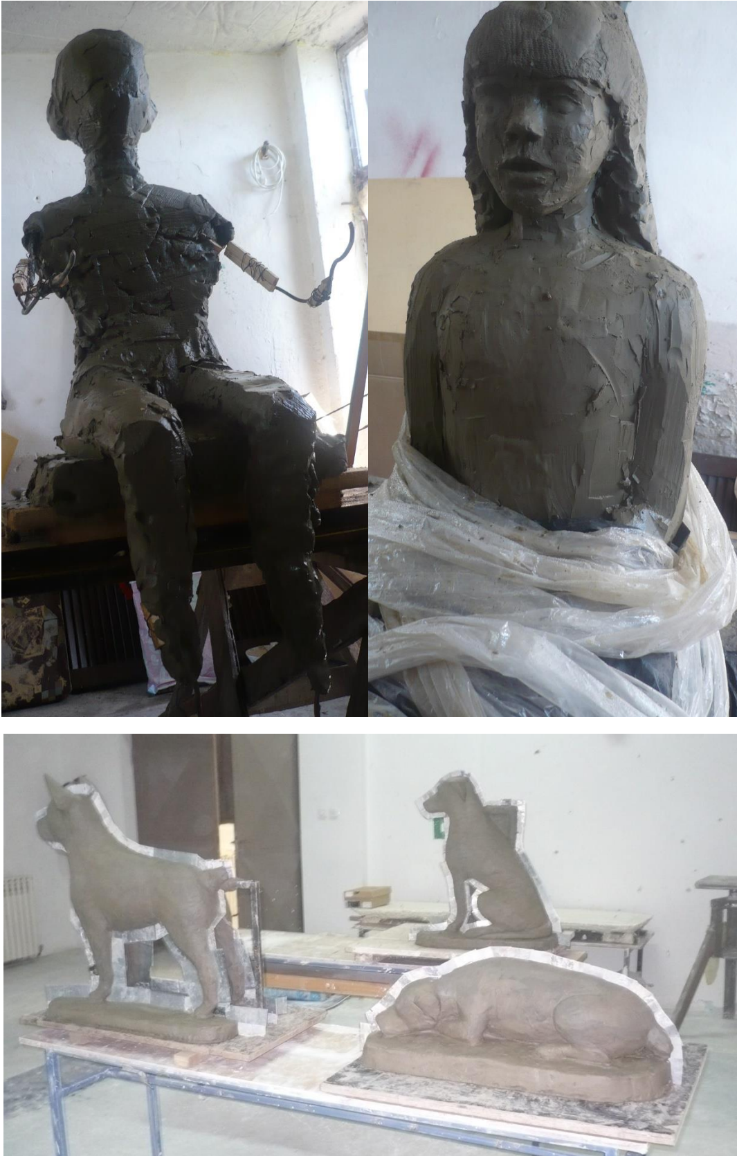
10. Oblikovanje u glini