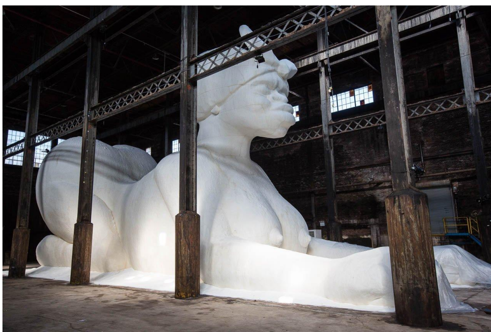
21. Kara Walker, “A Subtlety“ ( https://culturehog.com/art-and-gentrification/ )

Pitanjem etike i morala bavi se i umjetnica Kara Walker. Ona radi skulpturu nage žene (crnkinje) od 35 tona šećera u pozi sfinge koja u ovom slučaju aludira na intimnu pozu vođenja ljubavi a predstavlja pitanja rase, seksualnosti (iskorištavanja žena robova), ugnjetavanja, rada i prolaznosti. Mogli bismo reći da je ovdje estetika stavljena u službu etike.