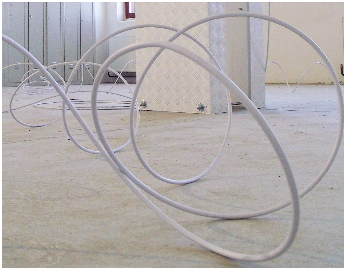
27. Kabel, detalj

Kabel “spaja“ duh i materiju, jer svijest može nastati samo kada duh i materija u potpunosti surađuju. Na taj način željela sam osvijestiti publiku o bitnosti pravodobnog odgoja djece i mladih, na pravilno usmjeravanje u pogledu korištenja masmedija te promišljanja o njima. Svjesno sam koristila “bijelu“, centralno pozicioniranu estetičku kompoziciju u službu etike, kroz temu medija koji, kao što sam rekla, (beskompromisno) odgajaju suvremeno društvo i njihov pomladak.