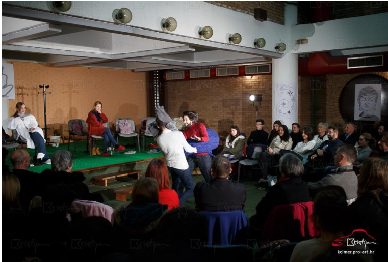
Slika 2: prostor sale za konferencije organiziran i uređen za potrebe predstave po uzoru na antička kazališta i grupe podrške. Na zidovima vidljive slike, središnji dio i povišeni dio namijenjeni za glumačku igru.

U arhitekturu takvog pozorišta moraće se, naravno, uneti neznatne izmene shodno zahtevima naših dana, ali upravo antičko pozorište, s njegovom jednostavnošću i amfiteatralnim prostorom sa publikom, sa njegovim orkestrom – i jeste jedino pozorište koje je sposobno da prihvati željenu raznovrsnost repertoara. 5