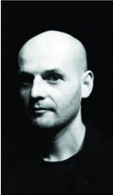
Slika 1: autor teksta Ivan Viripaev

kazalište i protjerivanjem mladog redatelja iz grada. Viripaev tada odlazi u Moskvu i započinje rad u kazalištu Theater.doc . Od 2006. godine počinje njegova česta suradnja sa moskovskim kazalištem Praktika gdje postavlja mnoge svoje tekstove koji mu, kao i predstave, donose brojne domaće i inozemne nagrade.