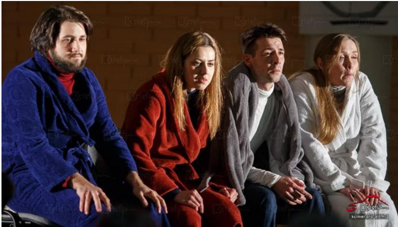
Slika 4: scena starenja - jedina svjetlosna promjena u predstavi FOTO: K. Cimer

Svjetlo i rasvjeta u ovoj predstavi trebaju što manje stvarati dojam artifizijelnosti i klasične predstave, već se treba koristiti kao pomoćno vizualno sredstvo kojim se publiku dodatno oprisutstvuje u realitet pričanja priča i međusobnog povjeravanja.