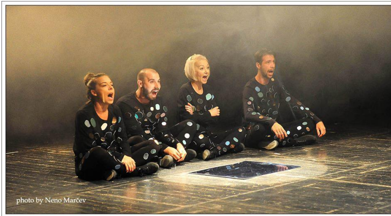
Slika 4: neutralni kostimi sa ogledalcima

prilagođavajući se glumčevoj gesti, kretanju, držanju; čas to tijelo steže. Tako kostim naizmjenično, a katkad i istovremeno, ima u sebi nešto od živog bića i od neživa predmeta. 15