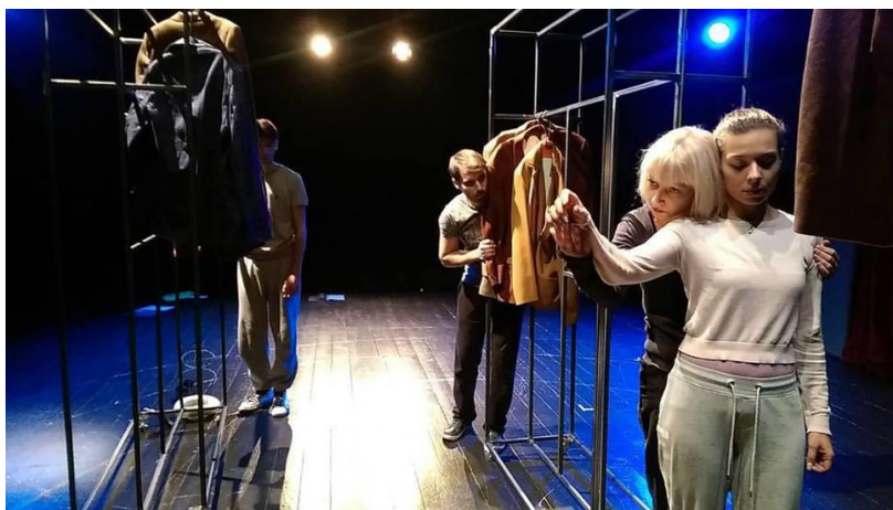
Slika 8: scena improvizacija i atmosfera - nacrt odnosa majka, dijete, otac, Nevidljivi

Biti glumac znači biti dijete , rekao je slavni Paul Newman. Osobno bih dodao da biti glumac u dječjim i lutkarskim predstavama znači biti dijete na potenciju. Biti dijete odnosi se na slobodu, zaigranost, maštu i neopterećenost. Kako bi sve to postigao, redatelj je s nama, na početku, počeo igrati vrlo jednostavne igre. Igre kakve smo radili i na akademiji, ali na kojima se vrlo često znaju vidjeti pravi, istinski karakteri osobe, kada, uvučen u igru, skine sve maske i pokaže svoje pravo lice. S ovim timom imali smo puno sreće. Otvorenost prema igri i upoznavanju, otvorenost prema nekonvencionalnim metodama rada bile su karakterizacije svih nas te je atmosfera zajedništva već u prvih tjedan dana postignuta na zavidnom nivou.