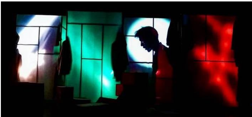
Slika 9: scena sa sjenama i svjetlom

i nestajanje sa platna, brzu promjenu mjesta nastanka, samokontrolu te svojevrsno kadriranje. Mogao sam izolirati samo svoja usta, smanjiti i povećati si glavu te ulaziti i izlaziti u već pripremljeni kadar. Prije sjene, pojavljujem se kao svjetlost. Kada kolege Vidov i Karakašić preuzmu sve tri reflektirajuće folije kojima stvaramo svjetlost odblijeskom svjetlosti reflektora preko folije na bijelu tkaninu, ulazim kao sjena, okružen magičnim bojama, kao da dolazim iz jednog potpuno drugačijeg, paralelnog svemira punog čarolije. I kada ugasim svoju lampu, moja zamučena, višestruka, blaga silueta je vidljiva od svjetlosti koja se reflektira od folija, te izgledam vječno prisutan, ali u potpunosti se pojavim tek kada trebam.