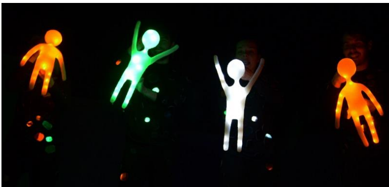
Slika 6: silikonske lutke sa LED svjetlima

Često su se kod nas prije niz godina mogli čuti uzvici: Što su to krasne lutke, izgledaju kao pravi ljudi. Ništa gore se za lutku ne može reći. Ništa nije pogrešnije nego tražiti da lutka govori, da se kreće i ponaša kao živ čovjek. Što je lutka sličnija živom čovjeku, to je kao lutka mrtvija, dosadnija i nakaznija. 16