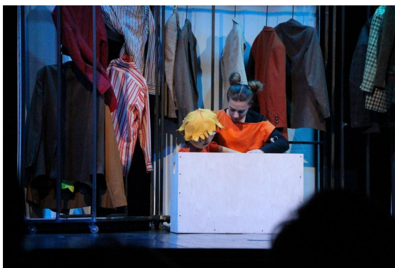
Slika 2: scenografija sobe

Budući da se scenografija uvijek primjenjuje na konkretan način, ona će, osim što je svojim specifičnim oblikom kadra pobliže karakterizirati prostor što ga znači, karakterizirati i radnju koja bi se u tom prostoru mogla odigrati. Budući da scenografija znači praktičnu funkciju prostora koji označava, ona ujedno ispunja dodatnu znakovnu funkciju da uputi na neku situaciju ili radnju. 13