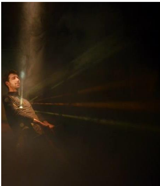
Slika 10: refleksija svjetlosti od ogledalca na kostimu

Ono što sam uočio tokom rada na predstavi u kojoj je svjetlo ne samo atmosfera, ne samo estetska kategorija, već i sama uloga, ideja i koncept djela, jest da svjetlo zapravo ne postoji bez sjene koja usporedno nastaje. Kao što u predstavama autoritet kralja ne igra kralj, već ga igraju podanici, tako i svjetlo samo po sebi bez sjene nema značaj. Tek kada primijetimo sjene, primijetimo i svjetlost. Zato sam u radu na predstavi obratio pažnju i na taj faktor koji sam otkrio. Nije bitno samo odakle je izvor svjetlosti te kako se on materijalizira na platnu, u zraku i kroz