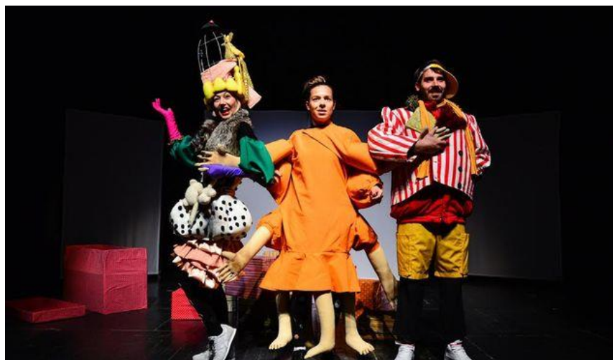
Slika 5: kostimi roditelja i kostim Nevidljive sa dodanim rukama i nogama

simbolizira pretrpanost, površnost, materijalizam te slijepo praćenje vanjskih poticaja, ne kreirajući vlastitu sliku svijeta i samoga sebe. Vođeni takvim idealima postajemo čudovišta, što sam ovaj kostim, kao vanjski simbol, i donosi