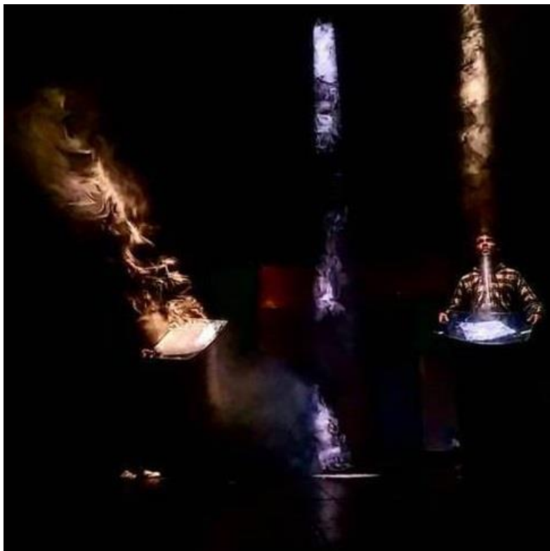
Slika 7: primjer aktivnog korištenja svjetla unutar scene

Oblikovanje svjetla, u predstavama, objektima na sceni (lutkama, glumcima) daje u najjednostavnijem formatu trodimenzionalnost, a ako je ona složena, može biti podjednako bitna i kao radnja i likovi i lutke i glumci jer je, svojim prisustvom na sceni, sama za sebe zasebni lik koji podržava radnju i sami tok predstave. Ako se uz to ona koristi i u dramaturške svrhe samoga teksta i predstave, svjetlost može postati i