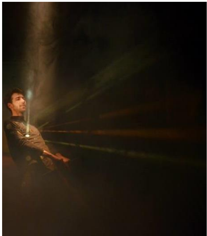
Slika 10: refleksija svjetlosti od ogledalca na kostimu

Ono što sam uočio tokom rada na predstavi u kojoj je svjetlo ne samo atmosfera, ne samo estetska kategorija, već i sama uloga, ideja i koncept djela, jest da svjetlo zapravo ne postoji bez sjene koja usporedno nastaje. Kao što u predstavama autoritet kralja ne igra kralj, već ga igraju podanici, tako i svjetlo samo po sebi bez sjene nema značaj. Tek kada primijetimo sjene, primijetimo i svjetlost. Zato sam u radu na predstavi obratio pažnju i na taj faktor koji sam otkrio. Nije bitno samo odakle je izvor svjetlosti te kako se on materijalizira na platnu, u zraku i kroz