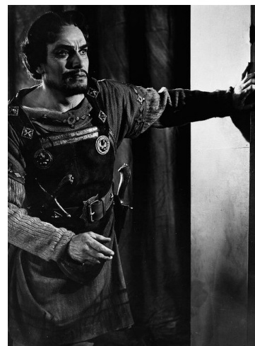
2 - Laurence Olivier kao Macbeth, 1955.