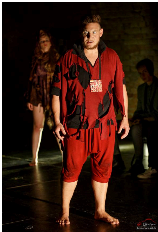
Slika 13 - Macbeth