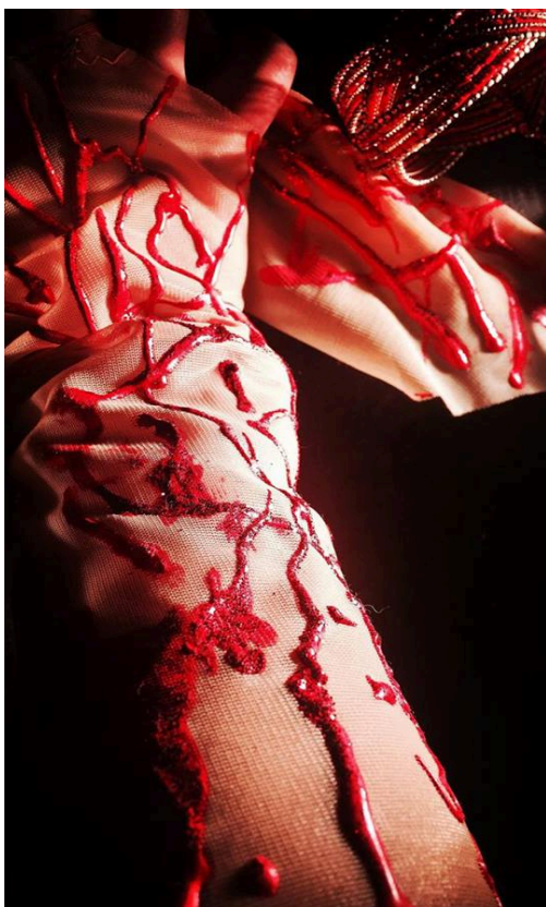
Slika 20 – detalji kostima Lady Macbeth