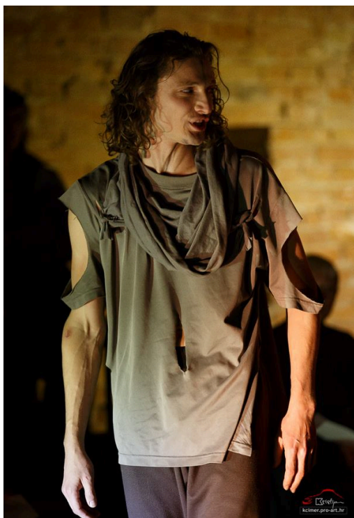
Slika 15 – Banquo