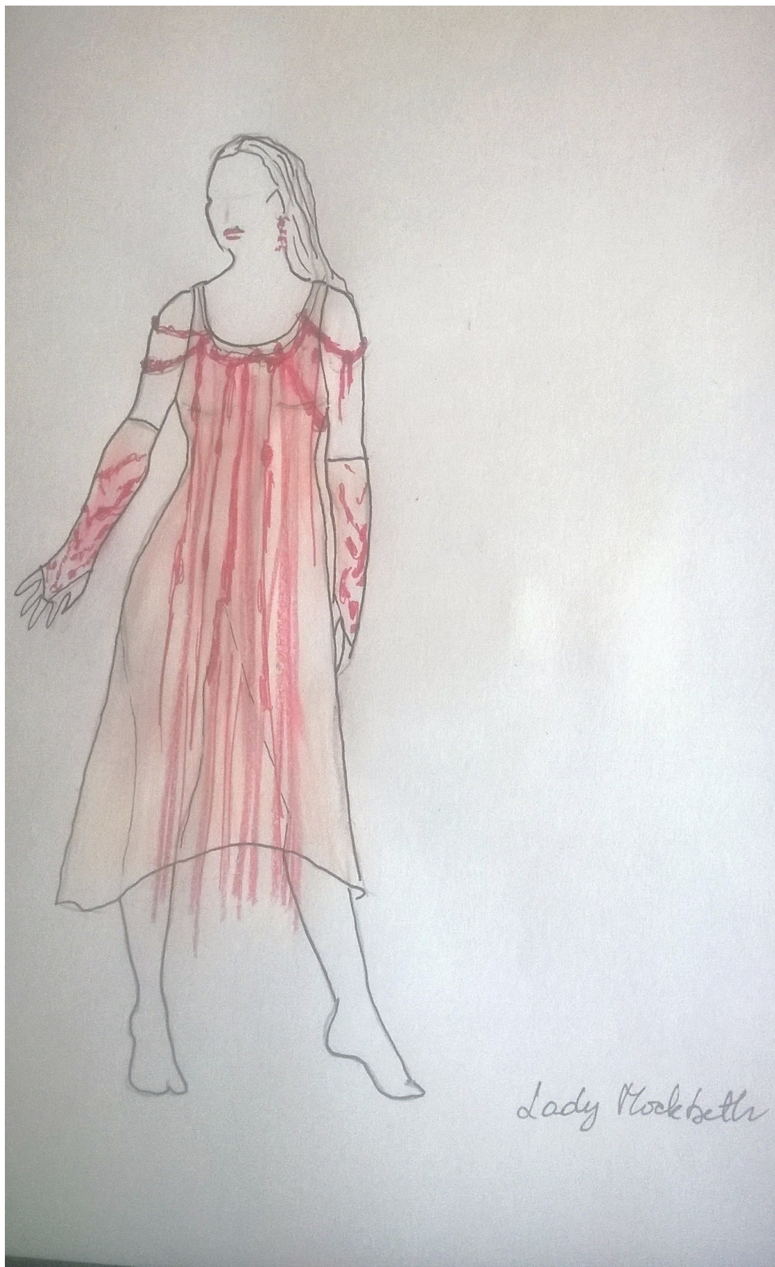
Lady Macbeth, kostimografska skica (J.P.K.)