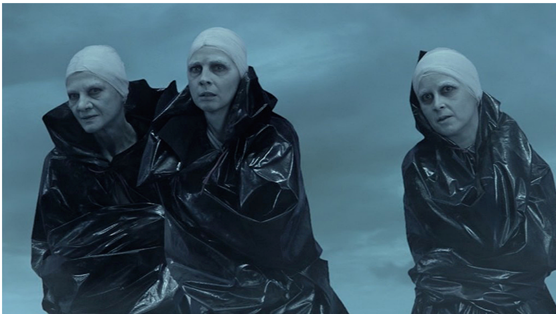
Slika 5 - Vještice (redatelj: Andrzej Wajda, 2004.)

Još je dalje otišao u doslovnom ogoljavanju glumaca njemački redatelj Jürgen Gosch u Düsseldorf Schauspielhausu iz 2005. godine gdje krvava ljudska tijela najzornije prikazuju svu brutalnost ove „krvave drame“: