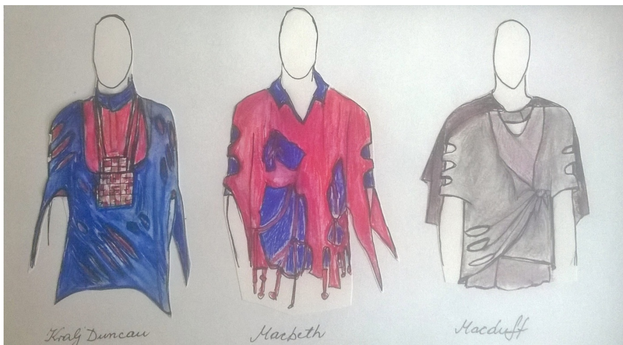
Kralj Duncan, Macbeth i Macduff, kostimografska skica (J.P.K.)