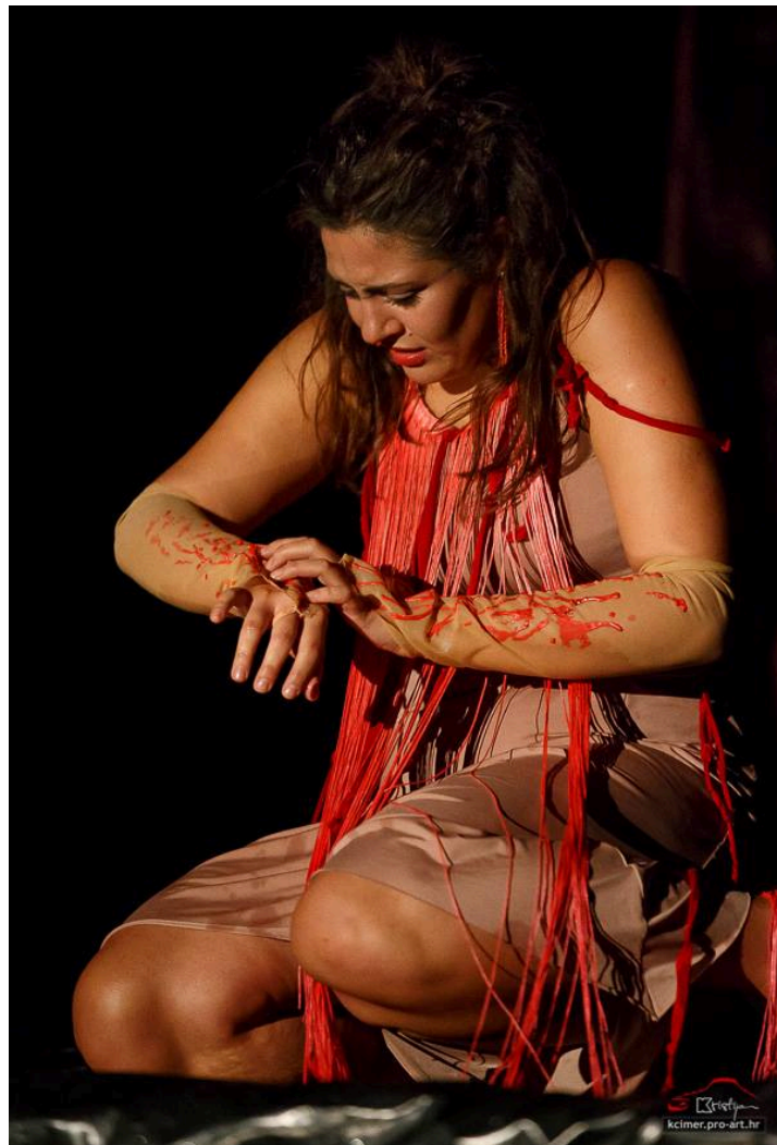
Slika 24 – zavšna scena Lady Macbeth