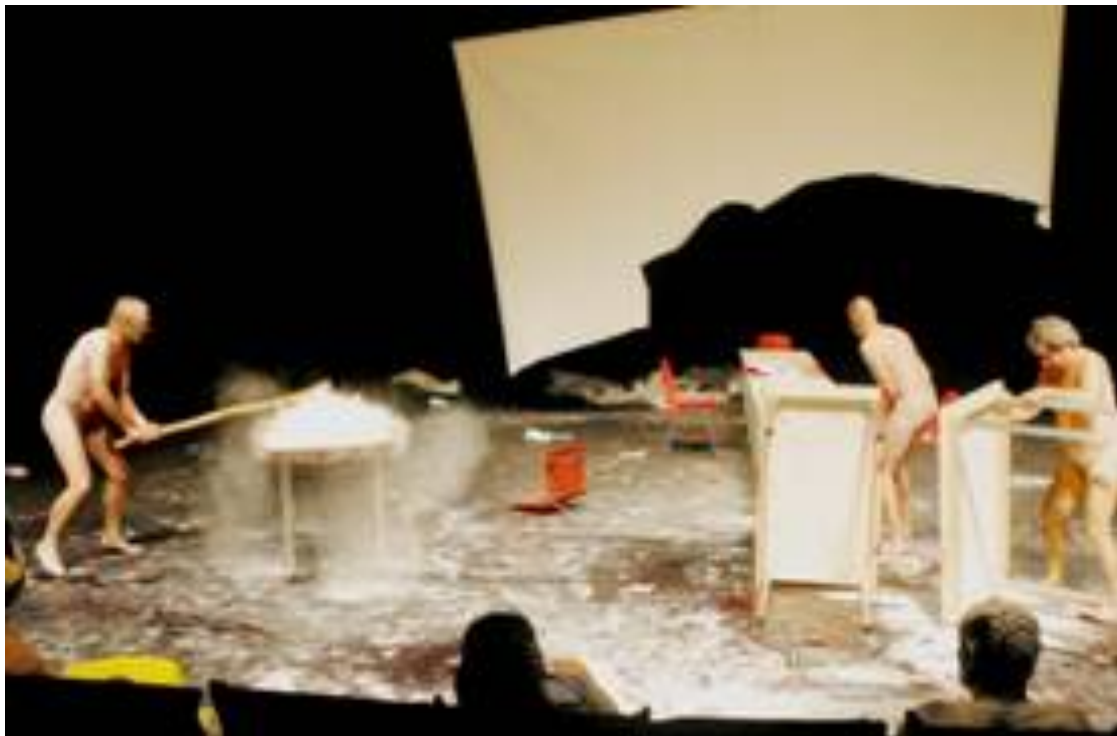
Slika 7 – Macbeth (Düsseldorf Schauspielhaus, 2005.)