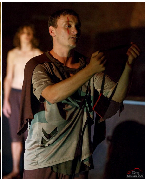
Slika 16 - Macduff

Razgovor s redateljem Novljakovićem i prezentacija njegovog koncepta pomogla mi je u izradi prvih radnih skica, kolaža za kostime. Nakon rasprave s redateljem i konačnog dogovora o odabiru stila, oblikovanju siluete, teksture za pojedine likove koji su se trebali transformirati tijekom izvedbe, te uz ograničenje samog proračuna pristupila sam izradi skica u boji te odabiru materijala za pojedini lik.