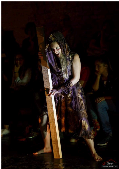
Slike 10 i 11 –Pravo lice vještica

Za ostale likove inspirirao me Jan Kott i njegov esej Macbeth ili zaraženi smrću iz njegove knjige Shakespeare naš suvremenik :