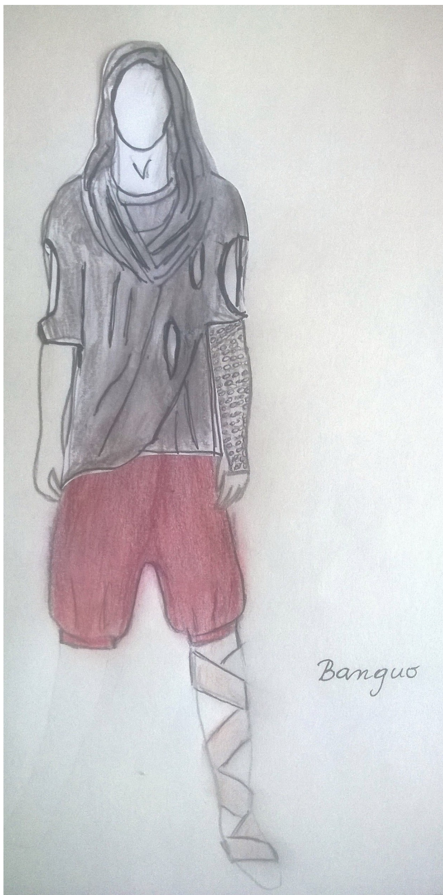
Banquo, kostimografska skica (J.P.K.)