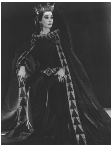
Slika 1 – Vivien Leigh kao Lady Macbeth, 1955.

Iz ovog mnoštva odabrala sam nekoliko primjera: Macbeth u produkciji Royal Shakespeare Company iz 1955. godine u kojem nastupaju najveće zvijezde tog vremena Vivien Leigh kao Lady Macbeth i Laurence Olivier kao Macbeth u režiji Glen Bayam Shawa. Iz ovih portreta vidljivo je da je u kostimografskom viđenju ovo rekonstrukcija i stilizacija povijesnih kostima (slika 1 i 2).