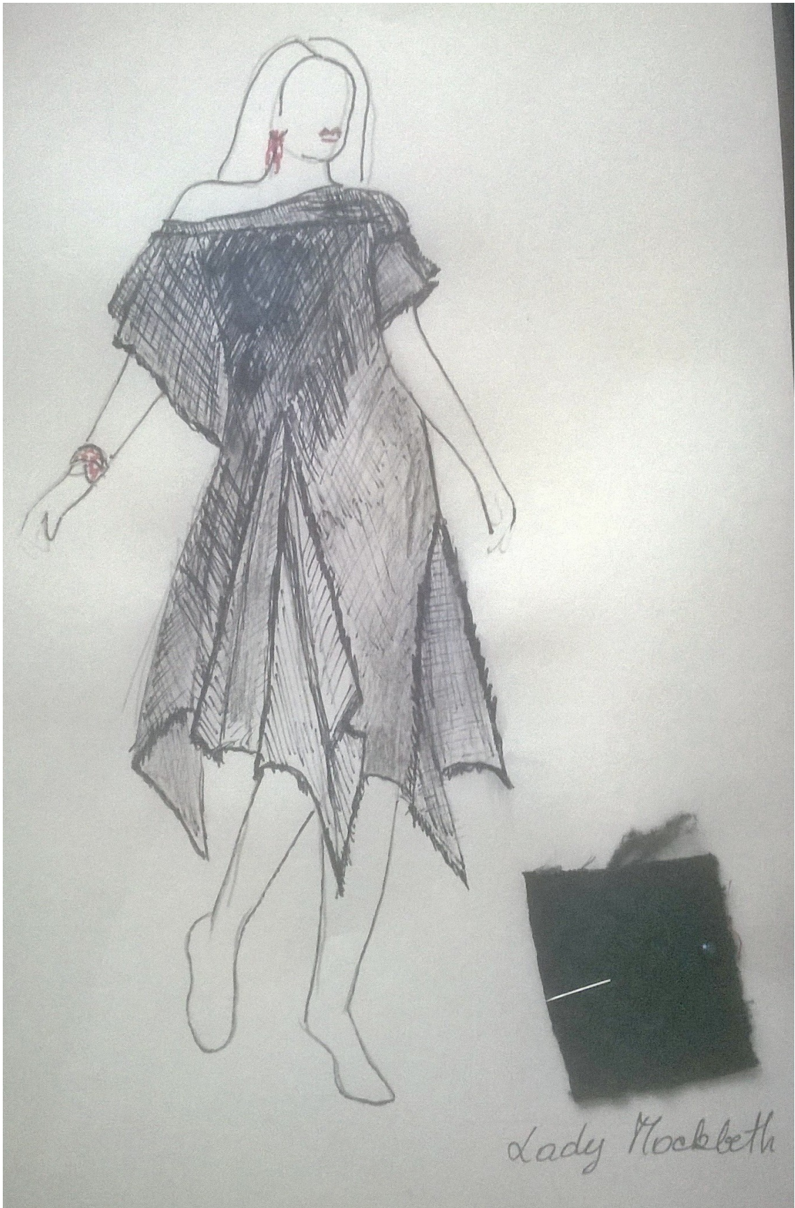
Lady Macbeth, kostimografska skica (J.P.K.)