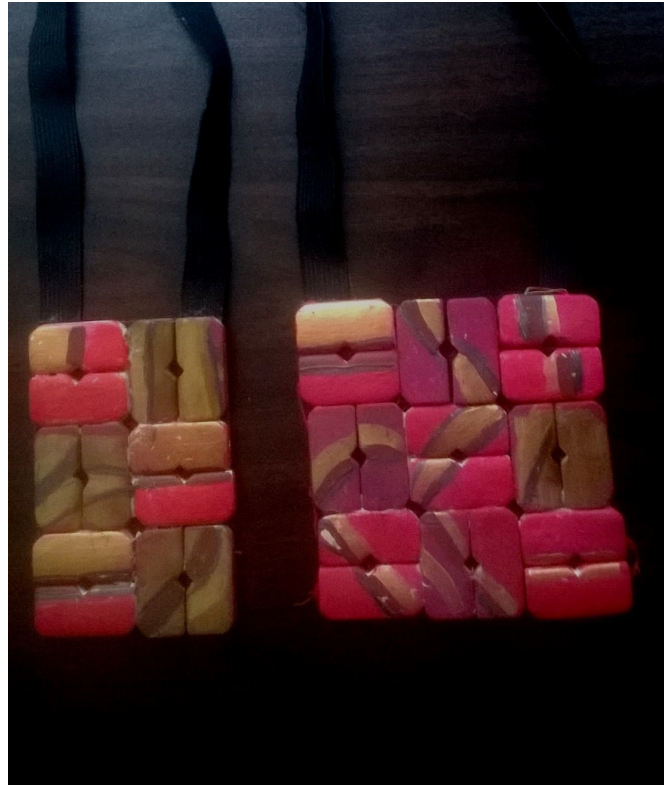
Slika 19 – simbol kraljevske vlasti

Kako bih došla do simbola vlasti proučavala sam geometrijske simbole obiteljskih grbova. Tako sam došla do simbola kraljevske vlasti (Slika 19). Nakit koji prvo nosi kralj Duncan, a kasnije se razdvaja na dva dijela za Macbetha i Lady Macbeth, dodatno naglašava važnost simbola koristeći crvenu, smeđu i zlatnu boju.