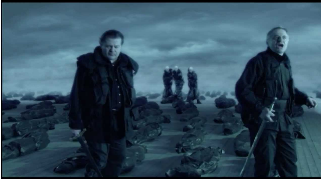
Slika 4 – Prva scena s vješticama (redatelj: Andrzej Wajda, 2004.)