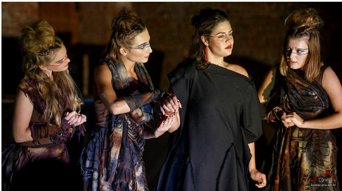
Slika 9 – Vještice / služavke

Analizirajući tekst, prvo što me je zbunilo bila je činjenica da je u samoj drami daleko više lica nego što je studenata koji sudjeluju u ispitnoj produkciji. Nakon što sam saznala da će sve manje uloge igrati vještice i da nije potrebno da one za svaku scenu imaju naznaku drugog kostima obzirom da igraju različite likove, pristupila sam prvo rješenju njihovih kostima koji bi dramaturški imali svoju funkciju u cjelini komada. Iako ih mi vidimo uvijek iste za druge likove one su drugačije i trebalo je pronaći kostim koji će imati mogućnosti da se brzo mijenja oblikom, obzirom da su one cijelo vrijeme vidljive na sceni (Slike 9, 10 i 11).