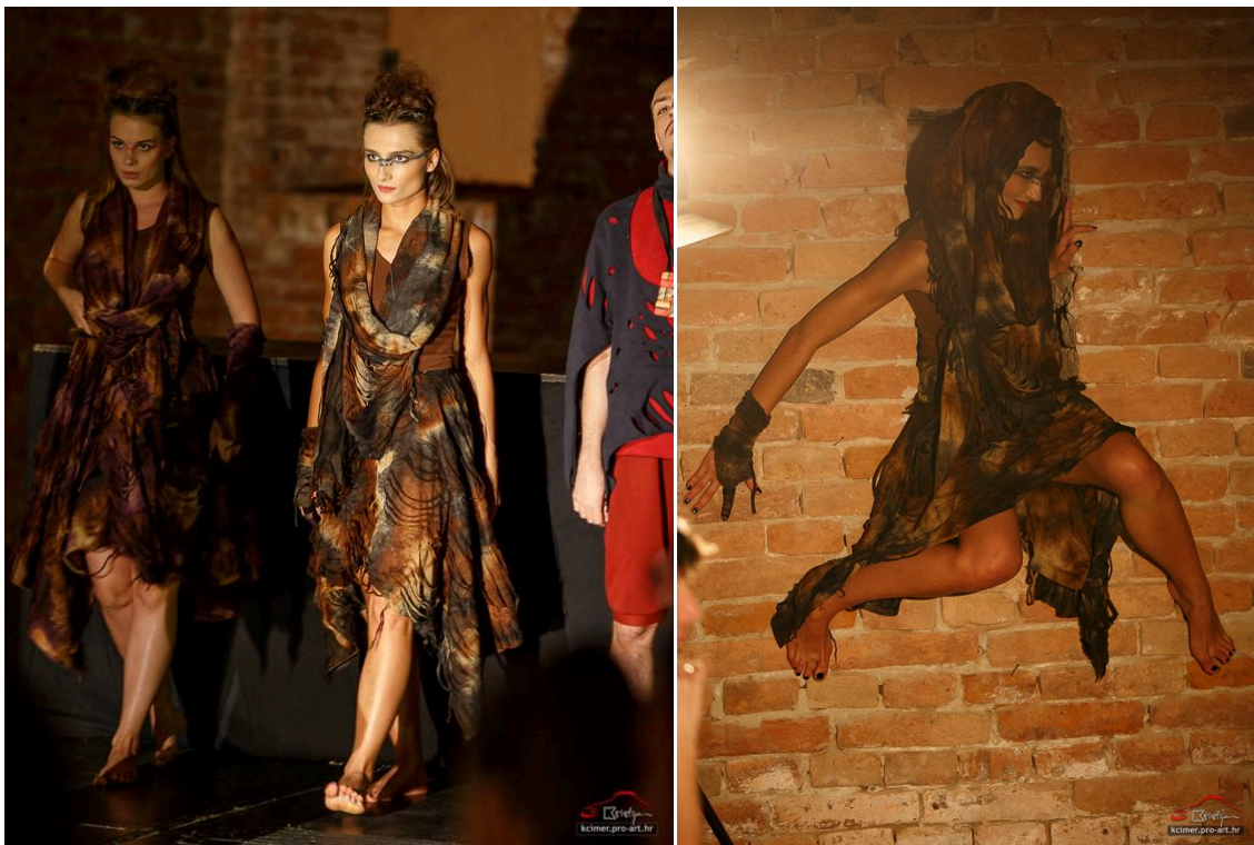
Slike 17 i 18 – Vještice kao nadnaravna bića

Umjesto kože i teških materijala koji bi bili primjereni brutalnoj atmosferi drame odlučila sam se za asimetriju i izrezivanje tkanine koja je bila naglašena bojom druge tkanine koja je osnov kostima. Također sam odabrala tkanine sa 3D efektom kako bi se naglasila fluidna struktura kostima vještica kao nadnaravnih figura (Slike 17 i 18).