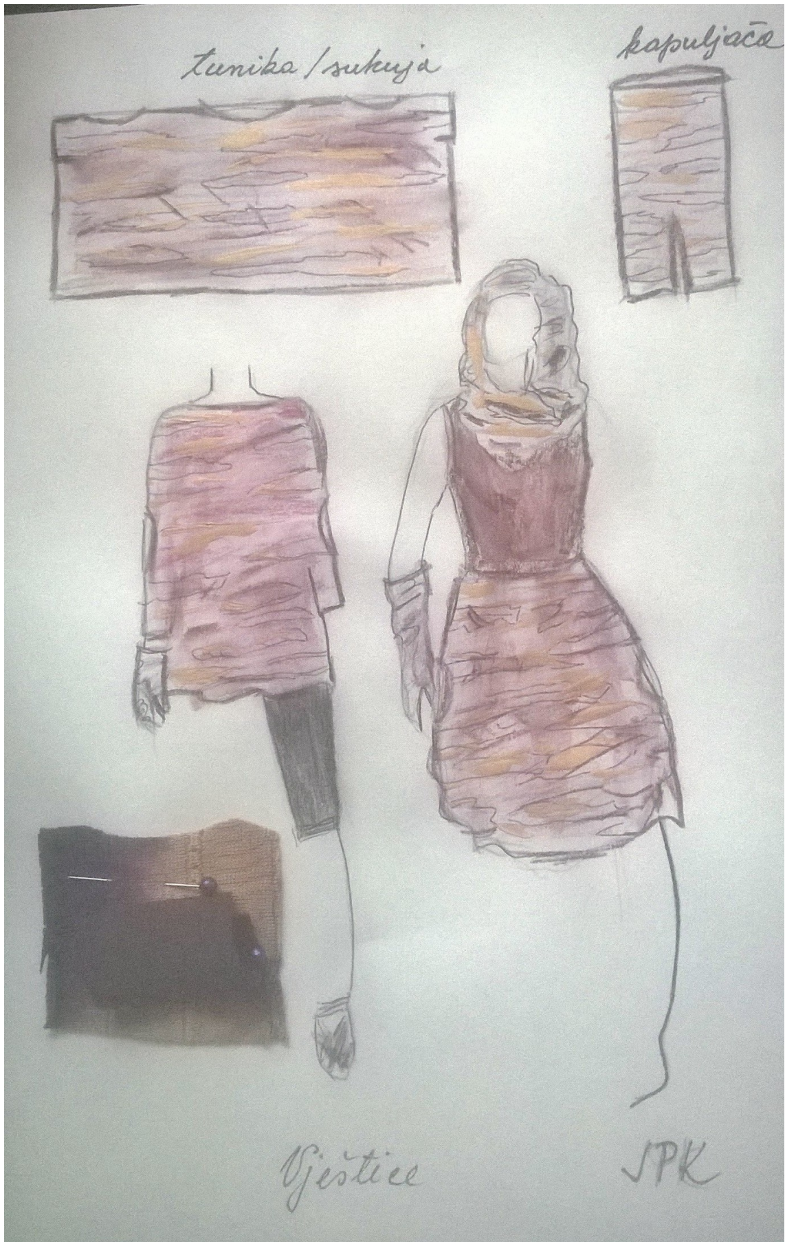
Vještica, kostimografska skica (J.P.K.)