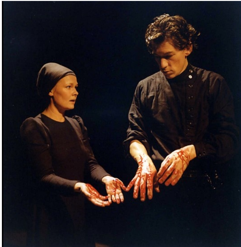
Slika 3 – Judy Dench i Ian McKellan kao Lady Macbeth i Macbeth, 1976.

U Royal Shakespeare Company je, naravno, bilo jako puno inscenacija Macbetha , od kojih bih izdvojila i onu Trevora Nuna iz 1976. godine s Judy Dench i Ianom McKellanom u glavnim ulogama. Ovdje već vidimo odmak od povijesnog kostima, određena jednostavnost naglašava njihovo skromno porijeklo, a crna boja određenije njihovih karaktera (Slika 3).