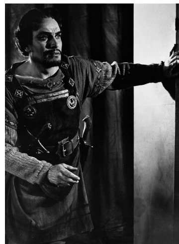
2 - Laurence Olivier kao Macbeth, 1955.