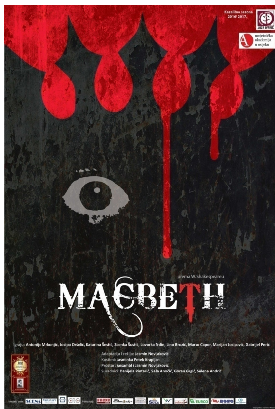
Slika 29 – Plakat predstave

Naučila sam da u dramskom kazalištu postoje čvrste zakonitosti dramaturgije i da odstupanje od njih može dovesti do efektnih, ali potpuno promašenih rješenja. Izuzetno sam zadovoljna što sam imala mogućnost sudjelovati u ovako složenom radnom procesu i nadam se da je moj rad pomogao cjelokupnom uspjehu predstave.