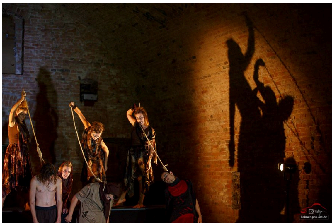
Slika 28 – Rasvjeta u funkciji scenografije

Scenska rasvjeta je značajno pojačavala ambijent groze i imanentnog prisustva zla kroz vještice koje su se multiplicirale u velikim sjenama na zidovima Barutane (Slika 28).