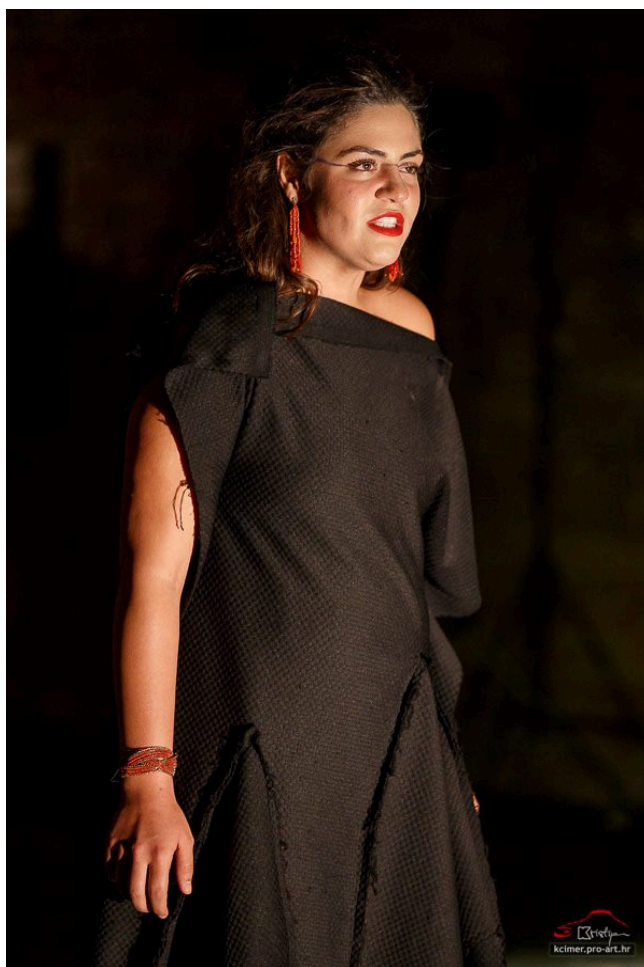
Slika 22 – Crna haljina Lady Macbeth

Kostim Lady Macbeth je crna haljina koja je mjestimično izrezana i u nju su umetnuti trokuti u obrnutom smjeru od pada tkanine, tako da je kostim dobio na plastičnosti i različite duljine trokuta na rubovima haljine daju cijeloj formi dinamičnost. Uz crnu haljinu pripadajući nakit su viseće naušnice koje su izrađene od sitnih perlica u raznim nijansama crvene koje su spuštaju niz ušnu resicu poput krvnih zrnaca, a isti princip sitnih perlica u raznim nijansama nalazi se i na pripadajućoj narukvici (Slika 22). Ova igra s crvenom bojom naročito je naglašena na završnom kostimu Lady Macbeth (Slika 21).