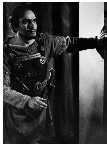
2 - Laurence Olivier kao Macbeth, 1955.