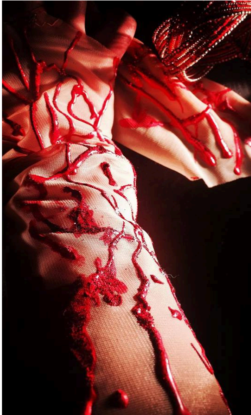
Slika 20 – detalji kostima Lady Macbeth