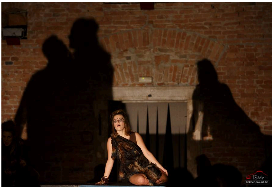
Slika 27 – Kostim kao refleksija prostora

Scenska rasvjeta je značajno pojačavala ambijent groze i imanentnog prisustva zla kroz vještice koje su se multiplicirale u velikim sjenama na zidovima Barutane (Slika 28).