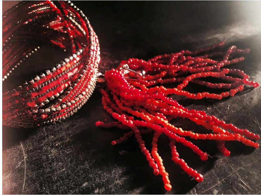
Slika 23 – Nakit