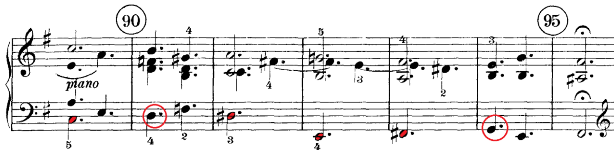
Prilog 26 – završetak provedbe i priprema reprize u drugom stavku