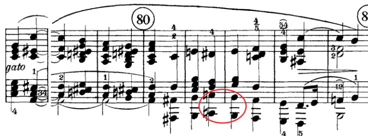
Prilog 16 – fraza od šesnaest akorda drugog odsjeka u CODI prvog stavka