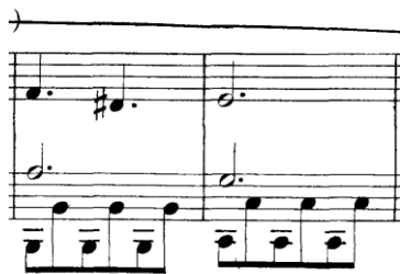
Prilog 23 – modulacija u C-dur u provedbi drugog stavka