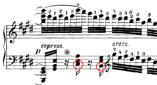
Prilog 12 – takt 63; sekstakord A-dura i ton cis u basu s rješenjem u H