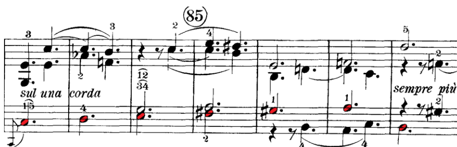
Prilog 25 – treći dio provedbe drugog stavka