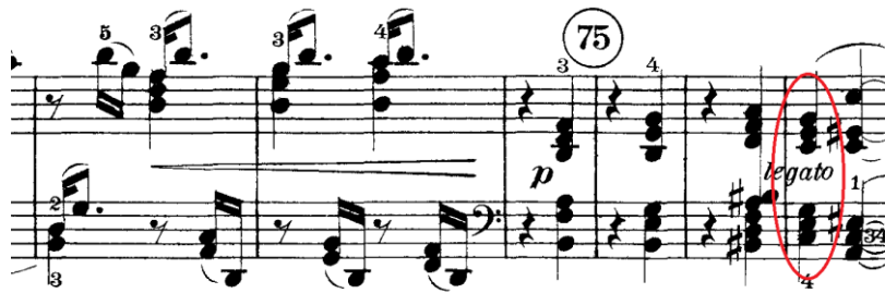
Prilog 15 – peta fraza prvog odsjeka u CODI i početak drugog odsjeka