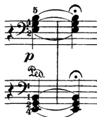
Prilog 19 – završni akord prvog stavka