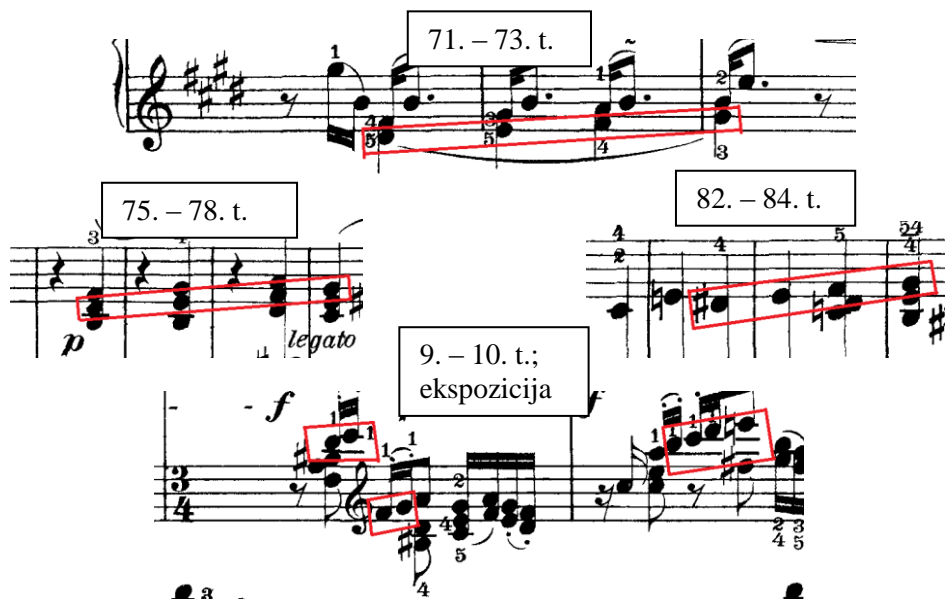
Prilog 13 – usporedba dijelova CODE te dijela druge teme ekspozicije