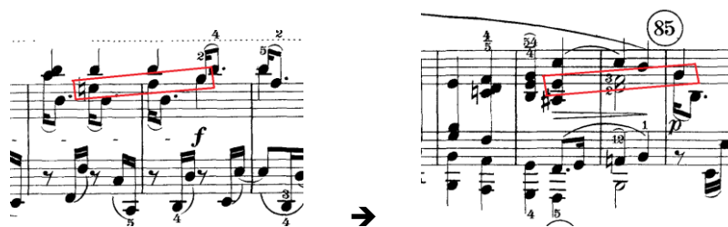
Prilog 17 – kraj provedbe (taktovi 47 i 48) u usporedbi sa krajem drugog odsjeka u CODI