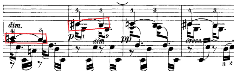
Prilog 18 – borba između dura i mola u CODI prvog stavka