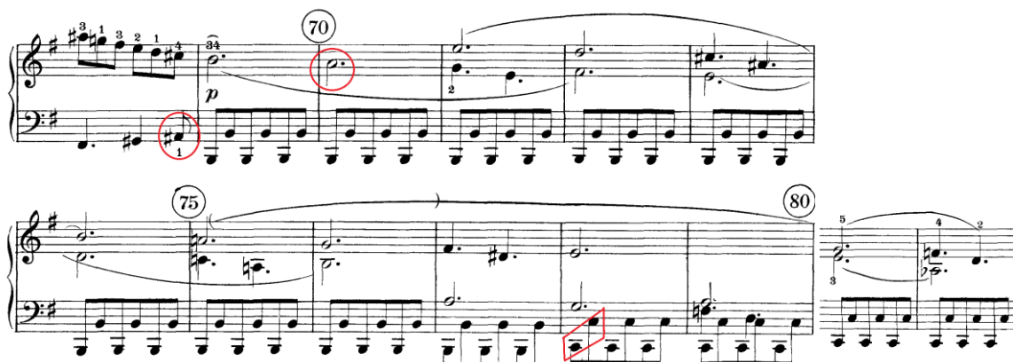
Prilog 24 – drugi dio provedbe drugog stavka