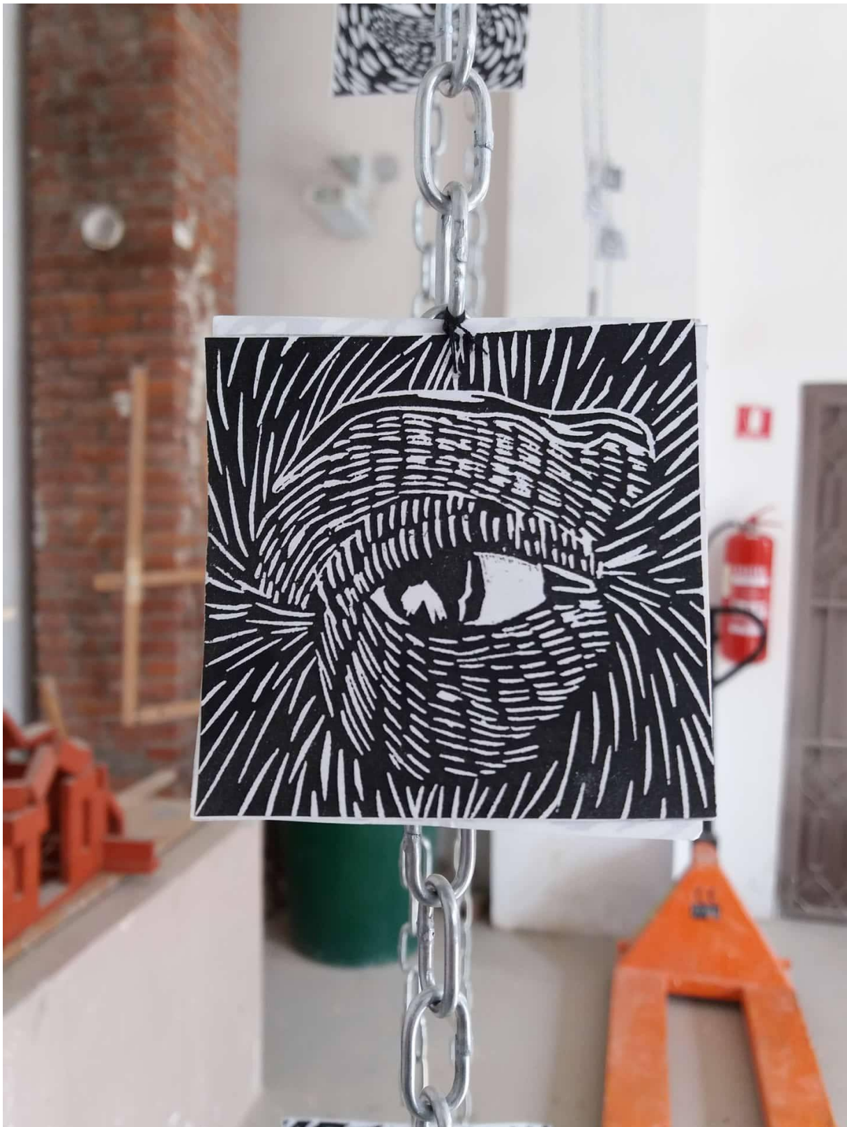
Slika 6, Senka Banjac, Lomljenje identiteta , detalj