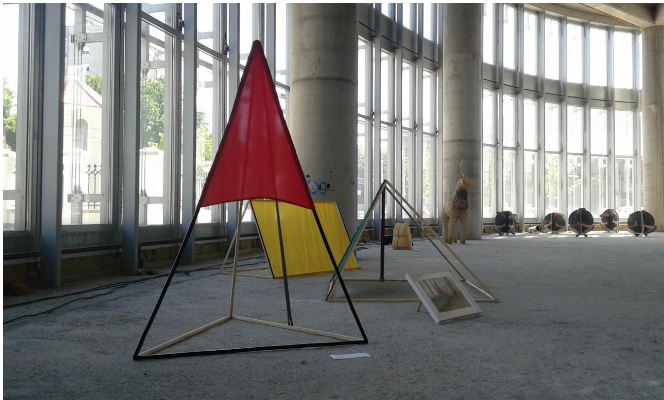
Prilog 1: Moj kamp , Susreti u nastajanju, Galerija SC, Osijek, 2017.