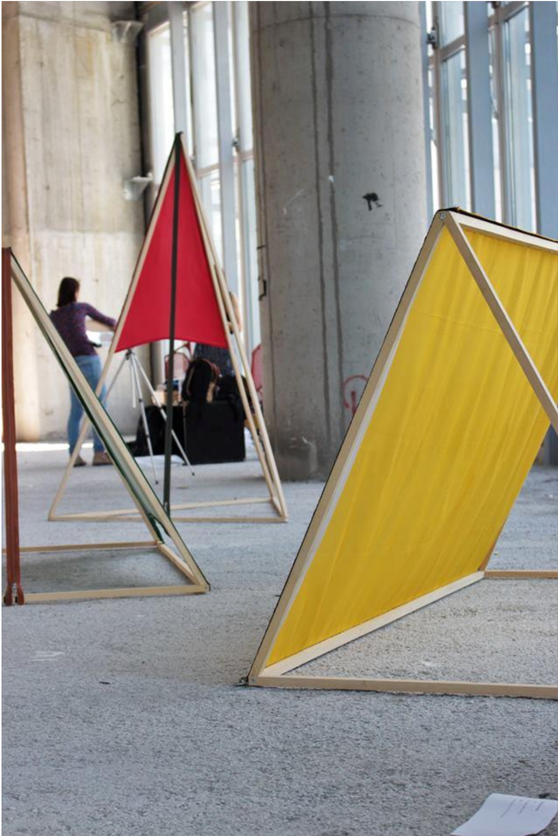
Prilog 4: Moj kamp , detalj