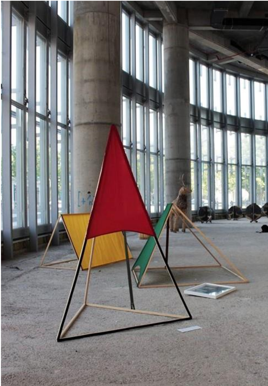
Prilog 3: Moj kamp , Susreti u nastajanju, Galerija SC, Osijek, 2017.