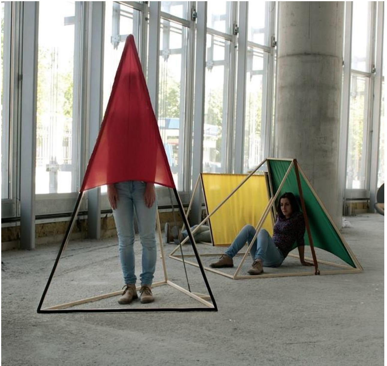
Prilog 5: Moj kamp , fotomontaža