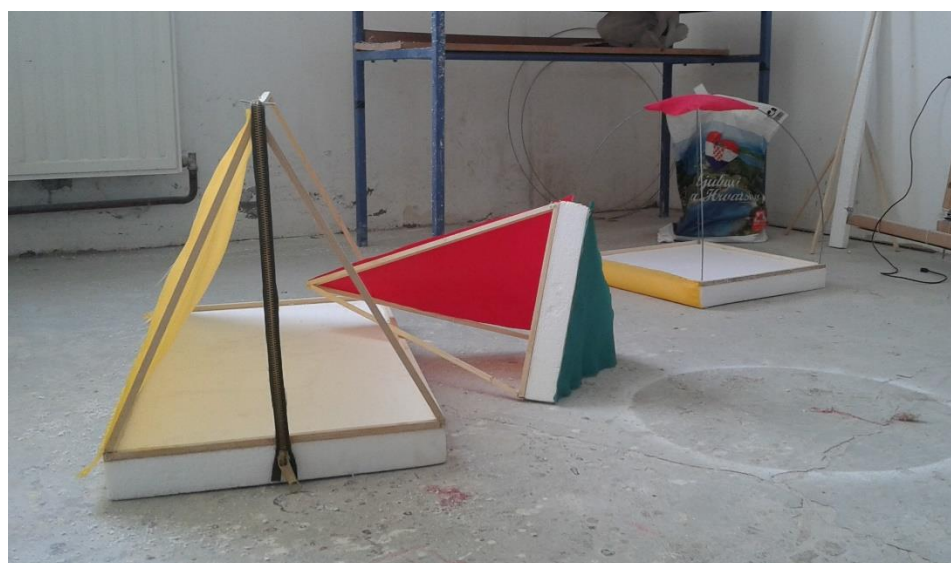
Prilog 2: Maketa Moj kamp