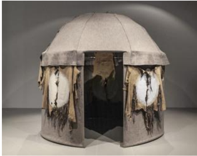
Prilog 8: Nil Yalter, Nomad's Tent , 1973.