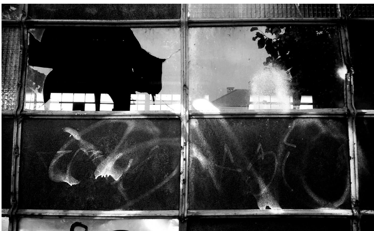
Slika 6. –Uređena fotografija sa pojačanim kontrastima, predložak za print na prozirnicu preko koje je napravljena cijanotipija.