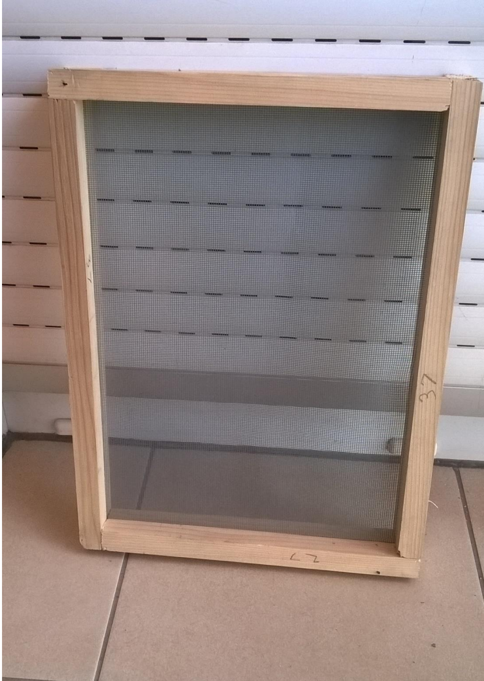
Slika 1. -Ručno izrađeno sito