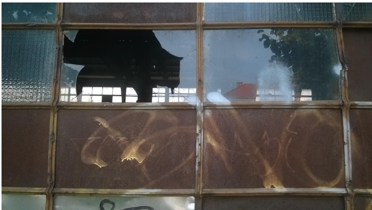
Slika 5. –Originalna fotografija