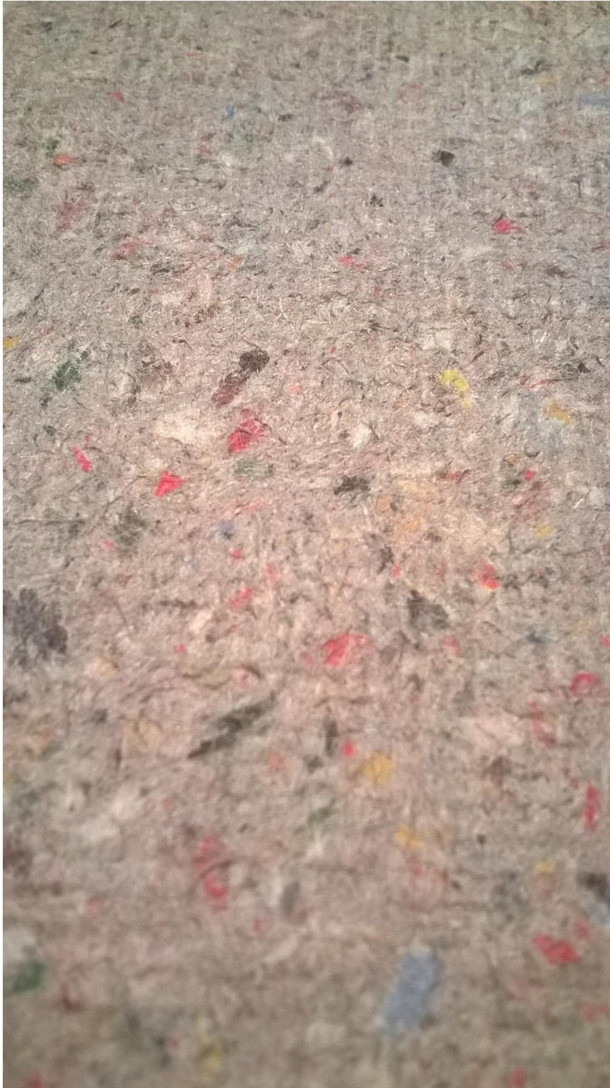
Slika 4. – Sitnije mljeven papir