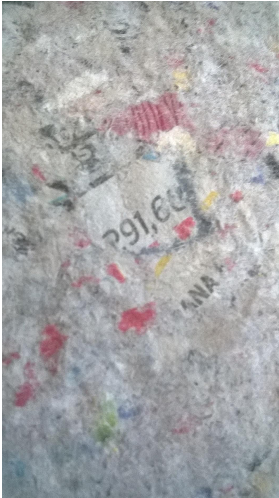
Slika 3. – uvećani prikaz krupnije mljevenog papira. Novinski tisak još je uvijek vidljiv