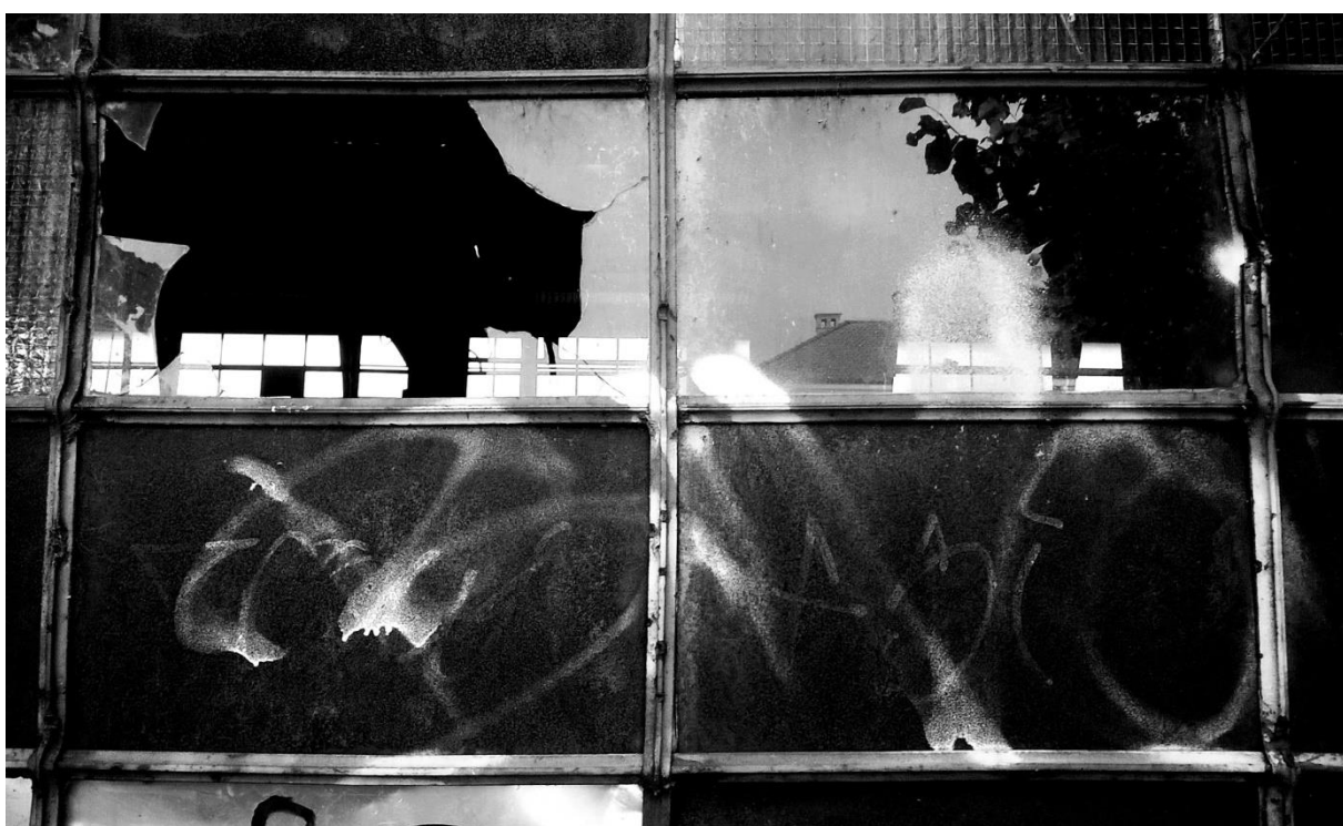
Slika 6. –Uređena fotografija sa pojačanim kontrastima, predložak za print na prozirnicu preko koje je napravljena cijanotipija.