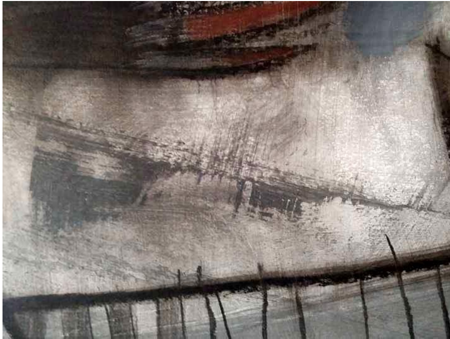
„ detalj slike br.1 „