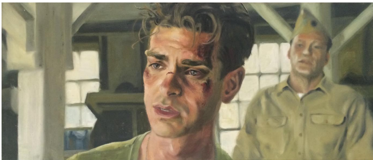
„Hacksaw Ridge; slika 1“