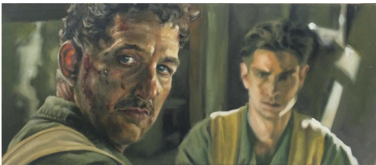
„Hacksaw Ridge; slika 3“