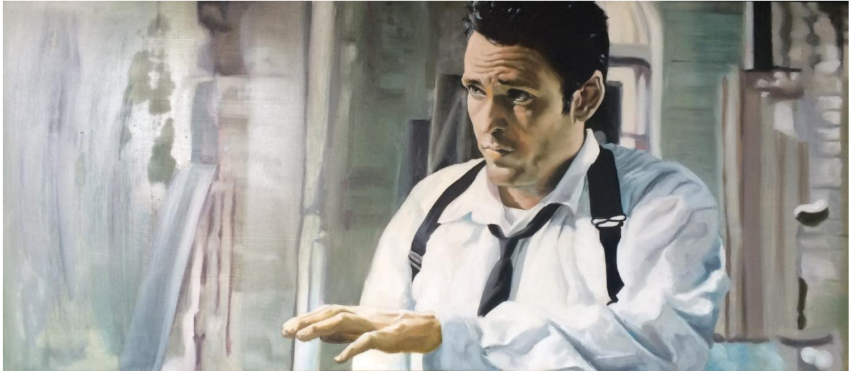
„Reservoir Dogs; slika 1“