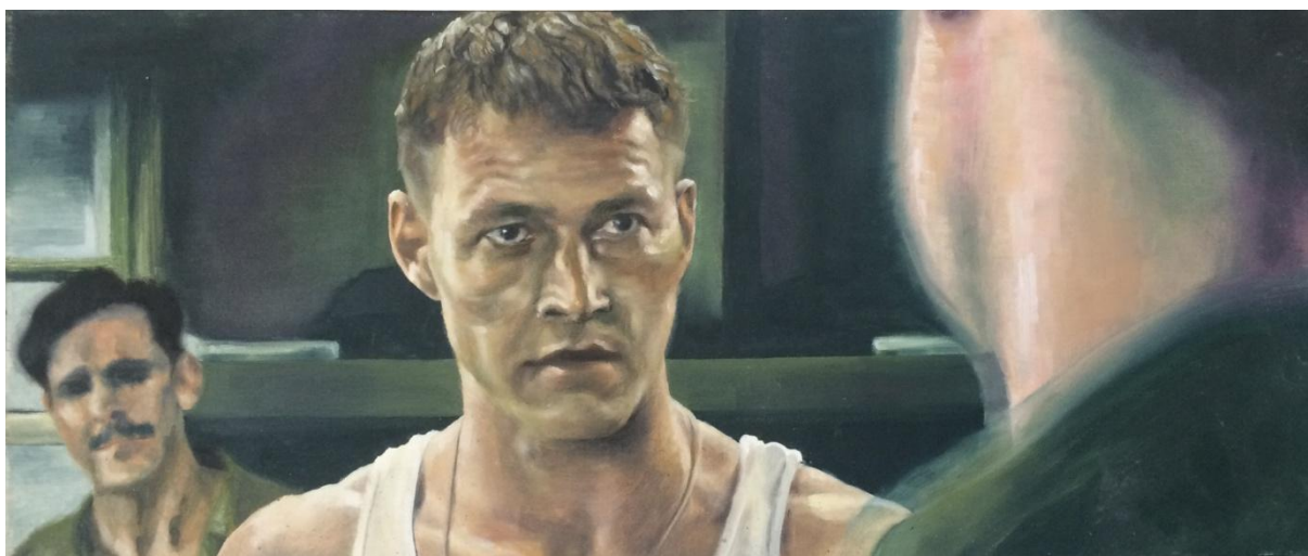
„Hacksaw Ridge; slika 2“