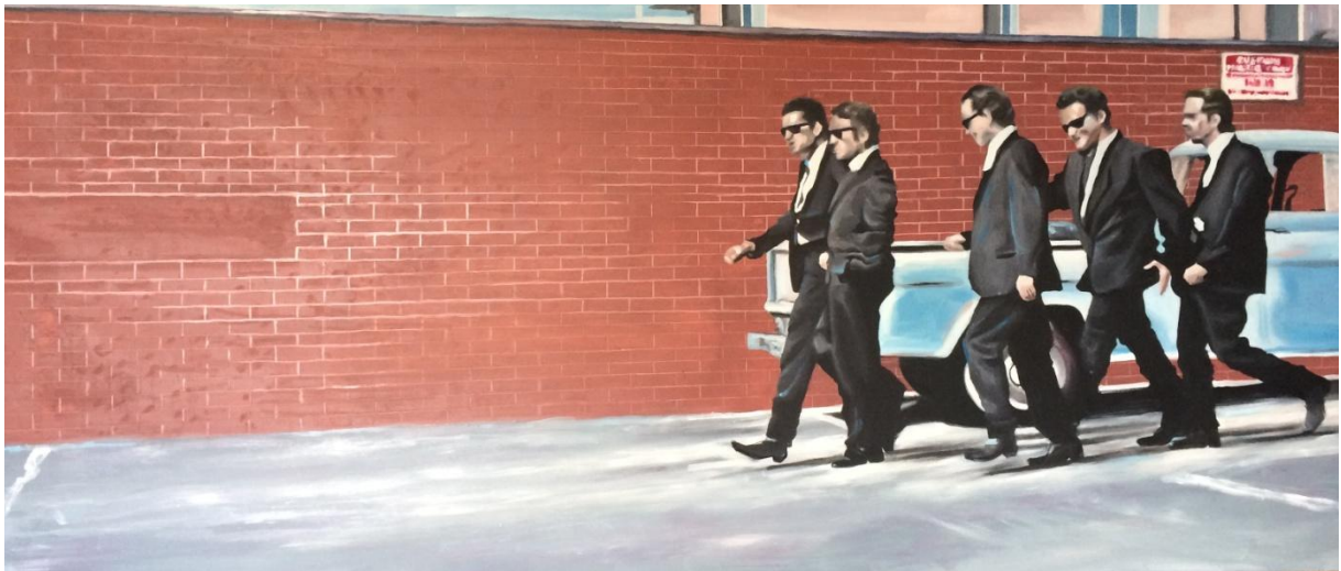
„Reservoir Dogs; slika 2“