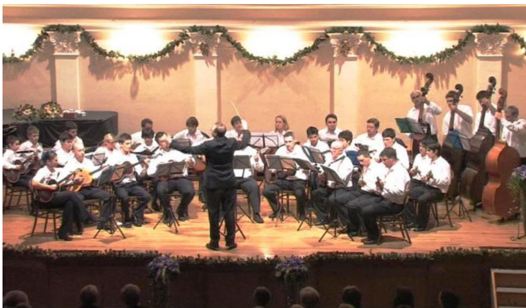
Slika 3. Veliki tamburaški orkestar

U tamburaškom orkestru, kao i ostalim orkestrima, osnovnu tonsku sliku čini zborna postava dionica odnosno kvartet: brač 6 prvi, brač drugi, čelović 7 (ili e-brač) i čelo 8 . Svaku