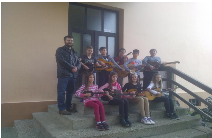
Slika 2. Školski (mali) tamburaški orkestar