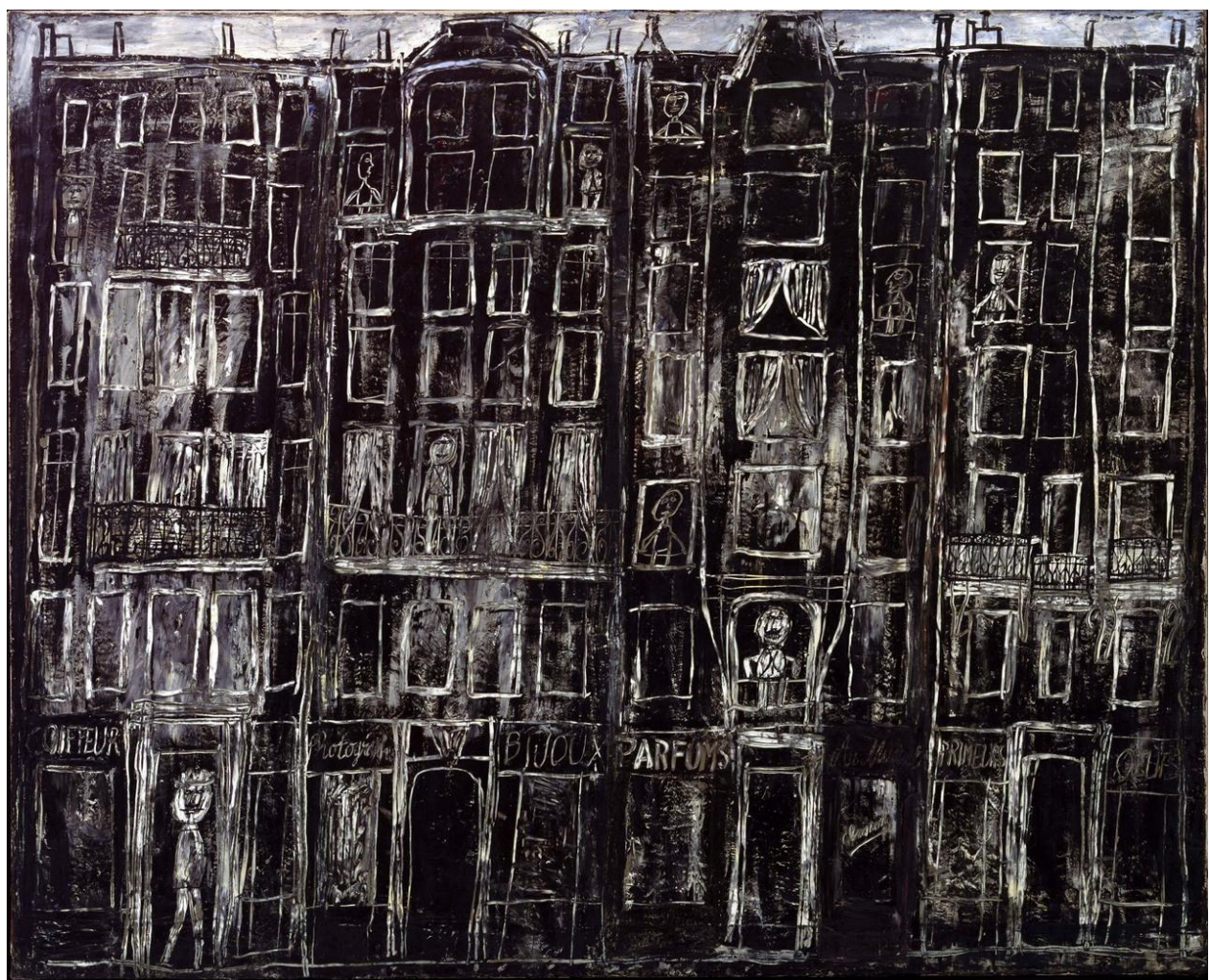
Prilog3: Jean Dubuffet „Fasada zgrade“