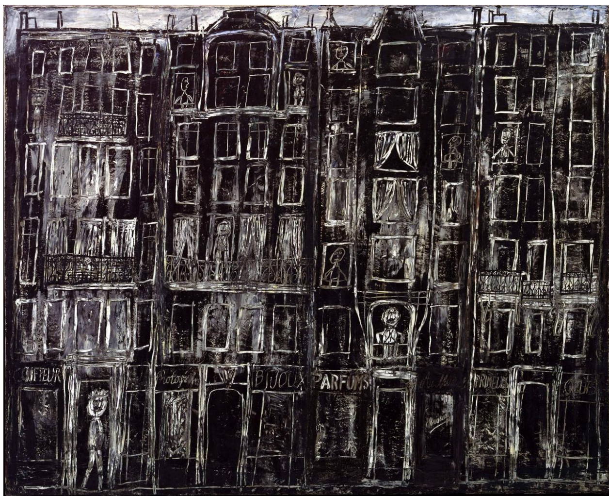
Prilog3: Jean Dubuffet „Fasada zgrade“