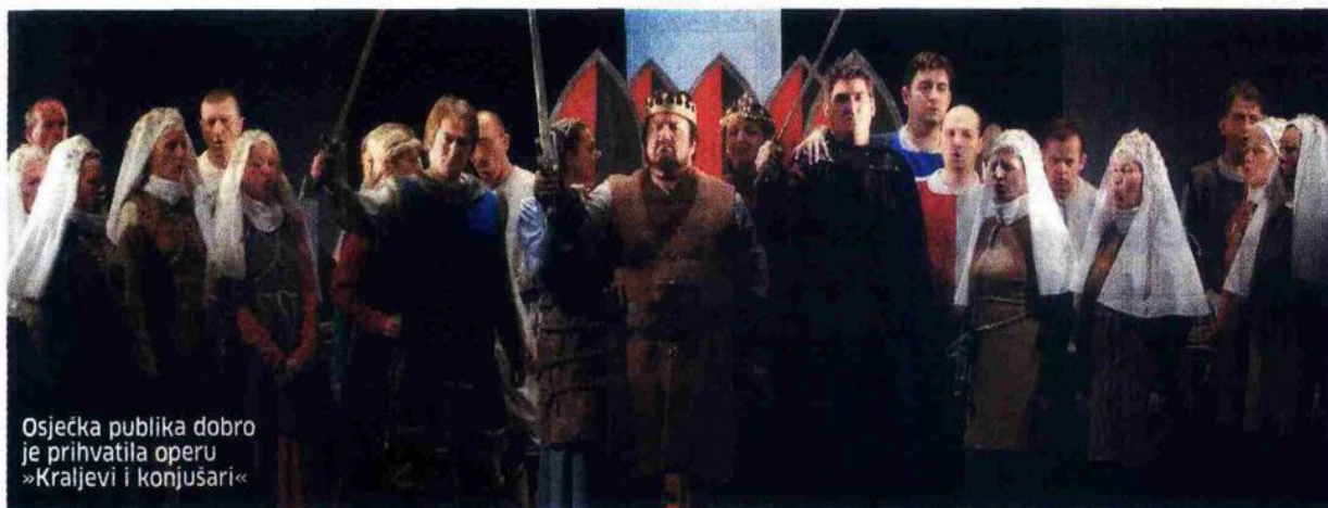
Osječka publika dobro je prihvatila operu »Kraljevi i konjušari«