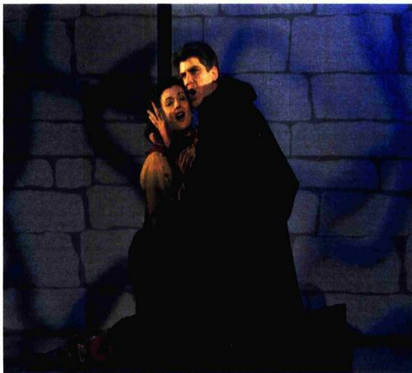
Prizor iz »Kraljeva i konjušara« na sceni HNK u Osijeku

Posebno su pak uspjeli zborovi, osobito ratnički poklici iz drugoga čina. Ima u toj glazbi i folklornih elemenata, ima i sastojka