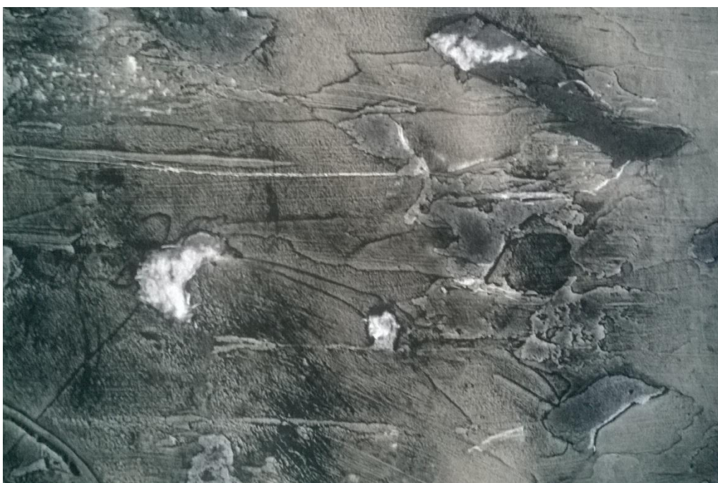
SLIKA 6: oblici nastali oduzimanjem i dodavanjem.

Ambijentalnom 3d instalacijom koja se sastoji od dvije ploče plexiglasa, na kojima se ponavljaju isti oblici kao i na radovima, htjela sam pod utjecajem svjetla stvoriti posebne efekte. Efekte kojima bih dočarala energiju, pokret i bivanje koje nas okružuje, a oku su