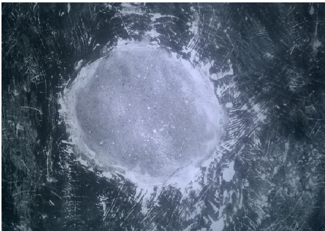
SLIKA 1: Detalj kruga, 2016.

U potrazi za izrazom vlastitog duhovnog stvaranja apstraktni izraz pokazao se kao idealno sredstvo izražavanja duha, težnji i emocija. Čitajući literature povezane s mojim promišljanjima skrenula bih pažnju na riječi Kopreka koji kaže: „(...) Ideja božanskoga se u potpunosti ne otkriva samo racionalnom shvaćanju. Ona traži estetsku dimenziju. Estetska dimenzija osposobljava čovjeka da se služi slikovitom formom kako bi „transcendentno“ učinio „ imanentnim“ očitim. U smislu posredništva između razuma i emocija, te time postaje nešto kao govor skrivenog, duhovnog.“ 3 Prema tome željela sam pristupiti umjetnosti kao obliku spoznaje života, osluškivanjem unutarnjih osjećaja i buđenju duhovnog kako bi nevidljivo učinila vidljivim, tu bih se nadovezala na riječi Ratzingera koji kaže“(…) ono što je ljudskom oku vidljivo produkt je nevidljivoga koji jeste stvarnost“. 4 Česti element koji se proteže mojim radovima je krug, kao najsavršeniji oblik koji za mene ima snažnu simboliku. On predstavlja ključ razumijevanja, univerzuma i vječnosti. Točka iz koje sve proizlazi, te je simbol duhovnosti i materijalnog, 5 (slika 1. i 2).