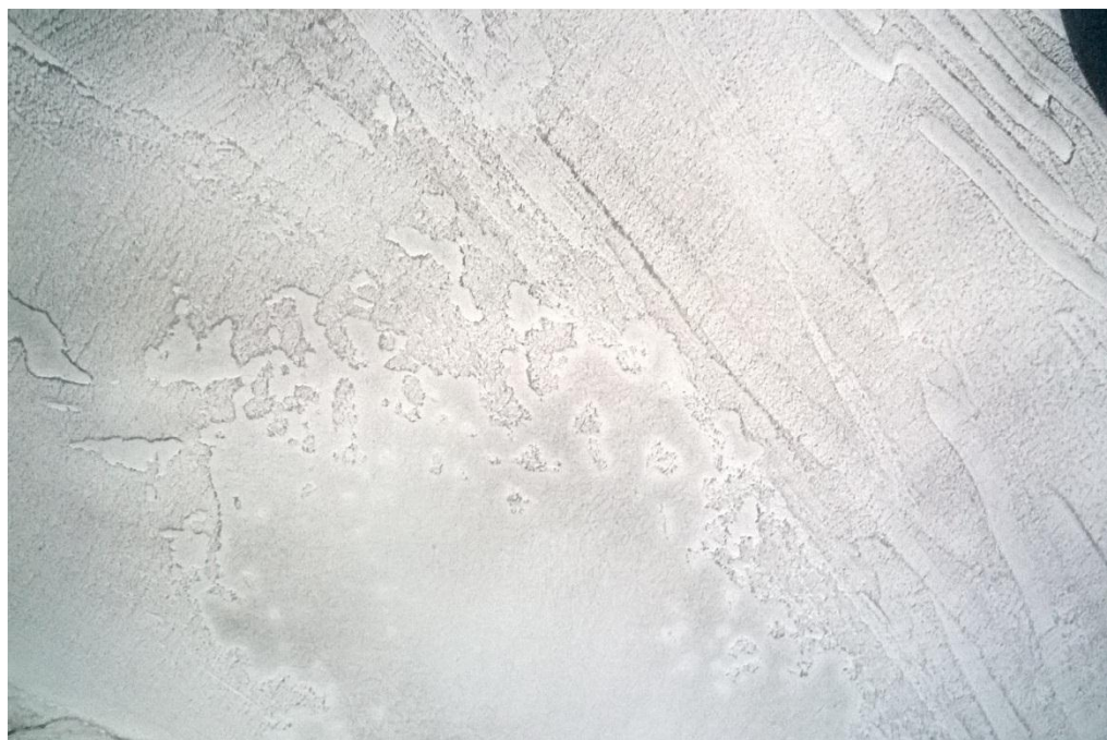
SLIKA 4: Detalj na kojemu su vidljivi tragovi kretnje i bivanja, nastale spontananim nanosima.