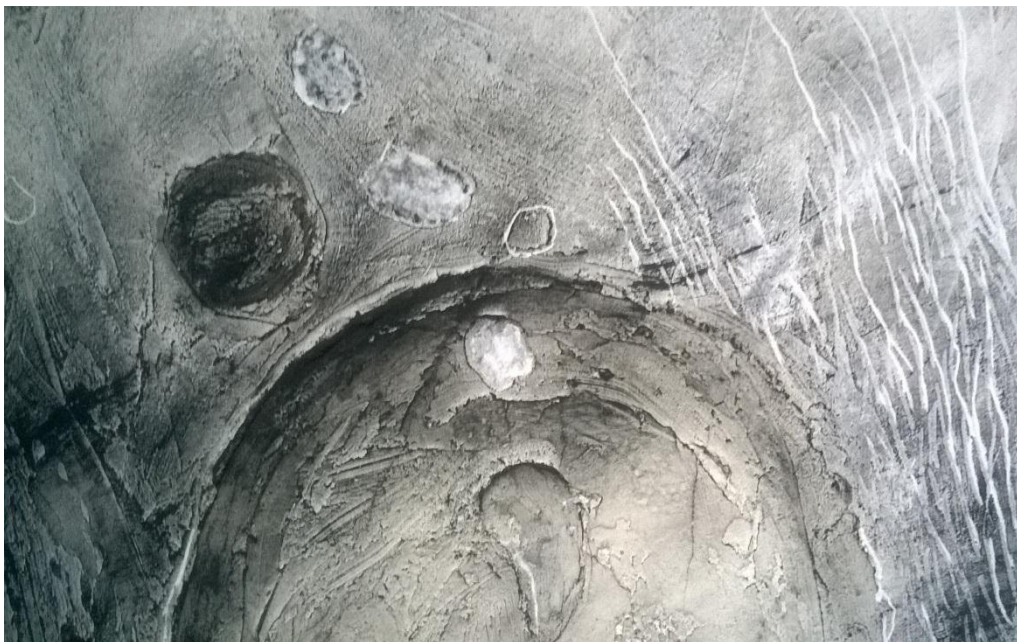
SLIKA 5: na kojoj se nalaze spomenuti korišteni materijali, prah, tkanina.