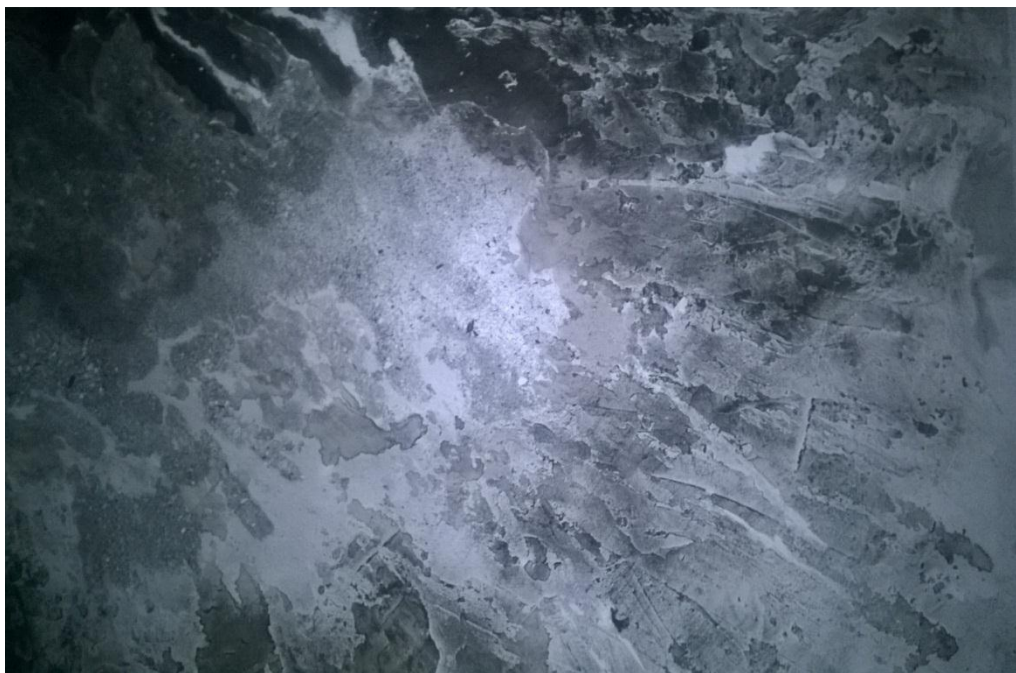
SLIKA 3: Detalj reljefa, glet, 2016.

naglašavam, energičnost, nasumičnost, spontanost kako bi ostavila trag uz naglasak na materiju. Dodavanjem raznih materijala kao što su tkanina, prah (nastao oduzimanjem glet mase nakon sušenja), i starog zgužvanog papira postigla sam raznolikost teksture koja izaziva dojam grubosti i kaosa (slika 5). Nastavljajući istraživati teksturu površine i karakter, zalihe materijala množile su se na površinama mojih radova (slika 6).