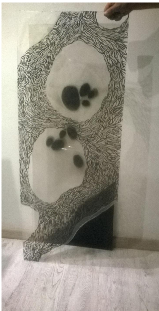
SLIKA 7: Instalacija, 2016.

nevidljivi. Koristeći jednostavne forme i dalje stavljam naglasak na jednostavnost koja unatoč osiromašenom i oskudnom prvom dojmu, ne znači da u konačnici ne može izazvati snažan umjetnički dojam. Ova ambijentalna instalacija može se smjestiti u odgovarajući osvijetljeni interijer, kao i na otvorenom prostoru, a veći intenzitet optičkih efekata je u interijeru pod utjecajem odgovarajuće umjetne svjetlosti (slika 7). Promišljajući o tome gdje bih smjestila instalaciju i na koji način, imajući u vidu karakter i kretanje pojave, pokušala sam najprije uskladiti s tehničkim mogućnostima umjetničkog izraza te sam odlučila kako je najbolje rješenje da instalaciju zakačim na strop koja će visiti na silku kako bih dobila dojam bestežinskog stanja poradi umjetničkog dojma.