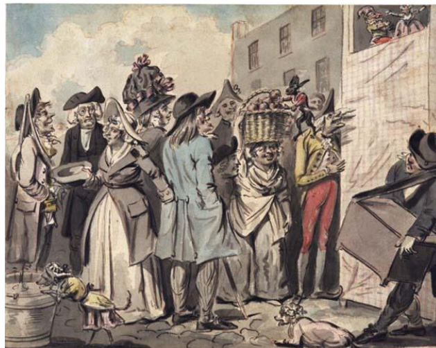
Slika 1.: Punchova predstava lutaka, Isaac Cruikshank 1795.

Početkom 18. stoljeća Punch je bio lik u marionetskim predstavama Martina Powella te ga je on i popularizirao. Punch tada još nije imao svoju vlastitu predstavu, ali je bio prisutan u svim njegovim predstavama i oblačio se u razne ličnosti. Punch je dobio kazalište nazvano po sebi 1738. godine, a otvorila ga je Charlotte Chark u James Street na Haymarketu. To kazalište nije dugo opstalo, ali je potaklo i druge lutkare poput Samuela Foot-a da prihvate i razvijaju Puncha i njegov lik. 5 Posljednji opis Puncha u obliku marionete potiče iz 1772. godine u komadu pod nazivom „Punchova lutkarska predstava“. U tom komadu Judy još uvijek nalazimo pod nazivom Joane te tipične likove komedije dell'arte. Velika Engleska kazališta počela su propadati te su se lutkari preselili na ulice sa svojim pozornicama-kutijama koje Englezi nazivaju Booth. Punch je postao glavni lik predstave, a svi ostali likovi su se pojavljivali u epizodama. Na Slici 1. 6 možemo vidjeti kako je izgledala tradicionalna predstava dokumentirana 1795. godine.