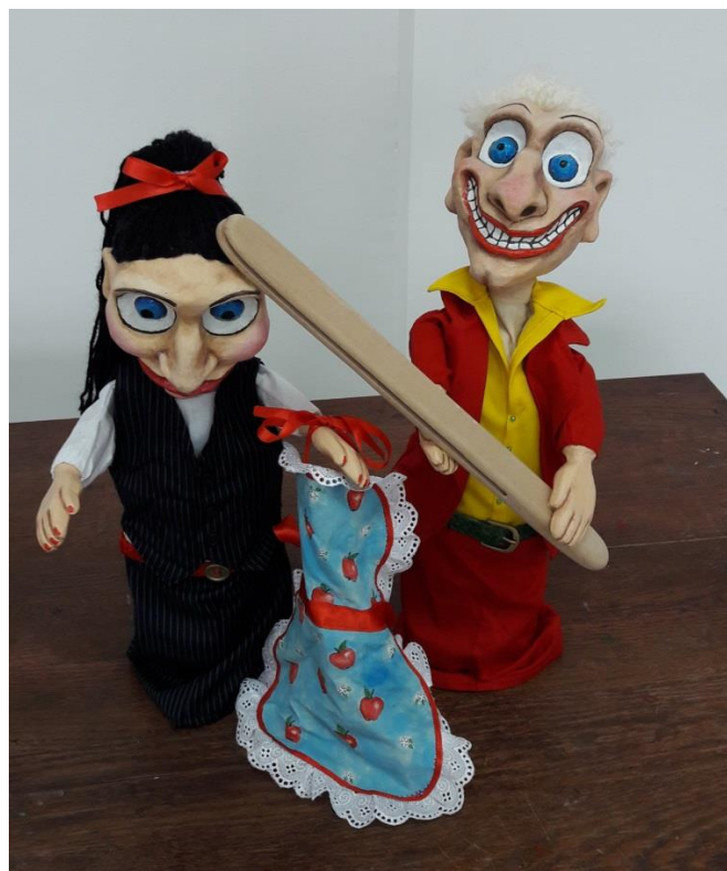
Slika 8.: Gotove lutke Punch i Judy

kao znakove stereotipnih „egomanijaka“ koje nalazimo u današnjem društvu. Njegov izraz lica, podsjeća na tradicionalnog Puncha jer ima velike buljave oči, veliki nos i osmijeh od uha do uha. Cjelokupno lice je pomalo deformirano u proporcijama kao i kod ostalih lutaka jer označava iskrivljenosti njihovih karaktera. Kod Puncha te bi iskrivljenosti trebale biti najizraženije budući da je on najmanje realan lik. Unatoč već poznatim karakteristikama crte lica Puncha nisu toliko groteskne kao kod prethodnika, jer se i on prilagodio suvremenom društvu koje je jako orijentirano na ljepotu. Prema tome možemo zaključiti da je Punch ipak s vremenom postao blaži karakterom i nije više toliko surov koliko je snalažljivac koji se voli potući. Na Slici 8. vidimo gotove lutke Puncha i Judy te je vidljivo kako je crvena boja poveznica između njih dvoje. Ona simbolizira i njihovu ljubav jedno prema drugome, ali i bijes i agresivnost koju oboje nose u sebi što je dominantnije kod Puncha. Kako bi ih se vizualno dodatno povezalo korišteno je remenje istog oblika u različitim bojama.