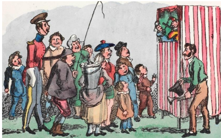
Slika 2.: Punch na Glasgow Green Fair 1825.

U 19. stoljeću Punch je već pričao pomoću metalnog instrumenta popularno nazvanog „swazzle“ (piskalica) te je imao prepoznatljivu palicu zvanu „Slapstick“ i danas poznatu dramaturgiju kao epizodnu strukturu komedije (Jurkowski, 2005) 7 . U tom stoljeću i njegova je žena promijenila ime iz Joan u Judy te je u predstavama bio pas Toby kojega je igrao često pravi pas. U 19. stoljeću je Punch već bio prava zvijezda te je 1841. u Londonu satirični časopis dobio po njemu ime. Slikovnice za djecu rađene su prema njegovim predstavama, a njegov je lik bio često naslikan na raznolikim kućanskim predmetima. Krajem 19. stoljeća Punch je postao toliko popularan da su njegovi nastupi zabilježeni u Sjedinjenim Američkim državama. 8 Na Slici 2. vidimo prikaz Puncha na Glasgow Green Fair (Vašar u Glasgovo) u 1825. naslikan od Williama Heatha 9 .