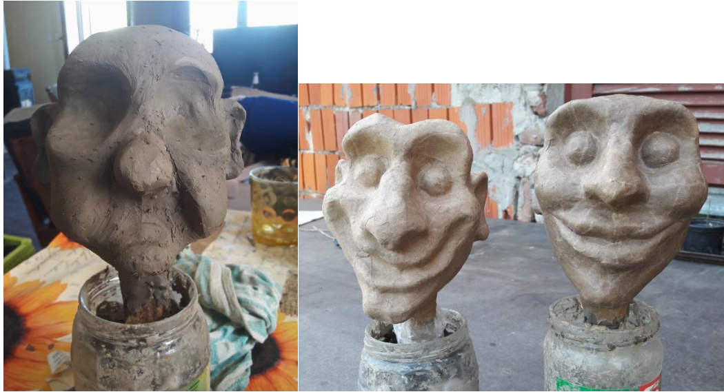
Slika 15.: oblikovanje glave u glini i kaširane pak papirom

Vrat lutaka rađen je sa tuljcem koji je umetnut u glavu. Različiti autori različito nazivaju tuljac pa tako ga Tomanek (Tomanek, 2018) 25 naziva „patronom“ i opisuje kao cjevčicu od drva ili tkanine. Varl (Varl, 2000:16) 26 opisuje kako tuljac može biti plastična cjevčica ili rađen od kartona tako da pravokutnik kartona savijemo u valjak i ojačamo koncem namotanim oko tuljca. To je tehnika koja se često koristi prilikom izrade tuljaca za ruke i glavu ginjola, ali kod ovih lutaka pozabavili smo se istraživanjem suvremenih materijala. U razgovoru s animatorima ustanovljeno je kako takvi klasični tuljci često žuljaju i ograničavaju animaciju te se s vremenom izobličuju pod utjecajem znoja i trenja. Zbog toga smo odlučili potražiti materijal koji je dovoljno čvrst da osigura zadržavanje na ruci te omogućava protok zraka i manje je neugodan za animaciju. Tuljci su se radili od ortopedske spužve koja se koristi prilikom izrade obuće te je dodatno učvršćena Hanzaplast trakom i omotanim koncem. Materijale i način na koji su korišteni vidljivi su na Slici 16.