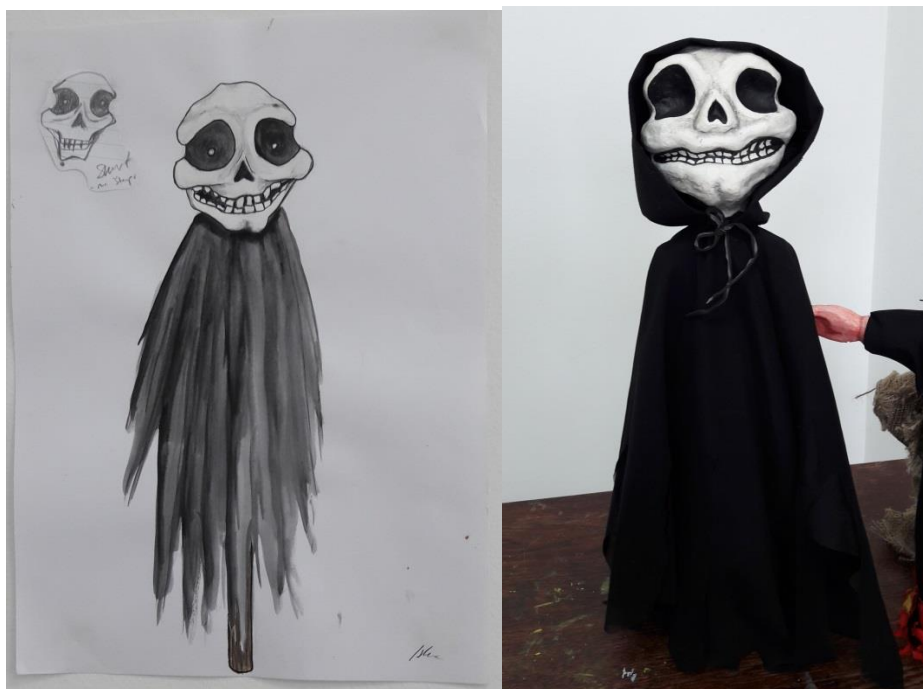
Slika 14: skica i gotova lutka Smrti

Zadnji lik koji se u predstavi pojavljuje je lik Smrti. On se na sceni pojavljuje svega nekoliko sekundi. Jednom gestom pokazuje da je i on odustao od Puncha i Judy. U dramskom predlošku jedina karakteristika Smrti koju možemo iščitati je da je postao indiferentan. Na Slici 14. vidimo skicu i gotovu lutku Smrti.