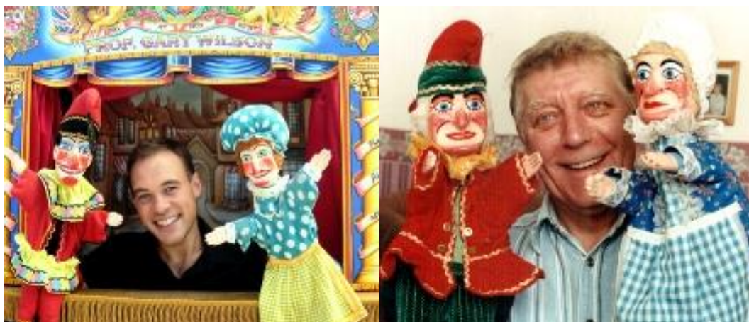
Slika 4.: Lutkari iz Punch and Judy Fellowshipa sa svojim lutkama 19

Glavni likovi ove predstave su Punch i Judy kako je to i tradicionalno, samo je u ovom tekstu Judy pokretač radnje i glavni akter, a ne samo jedan od likova koji se nađu Punchu na putu. Na Slici 4. možemo vidjeti kako tradicionalno izgledaju Punch i Judy.