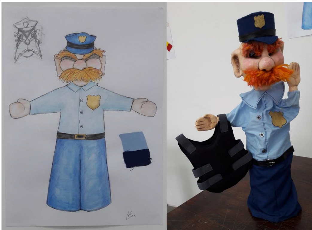
Slika 9.: Skica i gotova lutka Policajca

Sporedni likovi u predstavama Punch i Judy kroz povijest su se mijenjali. Likovi koji su od samih početaka zadržani do dan danas su Policajac, Vrag, Doktor, Ljubavnica i Beba. Često su dodavani novi likovi s obzirom na drugačije dramaturgije ili kontekst priče. 22 Za potrebe ove predstave zadržani su karakteristični likovi policajca, vraga i smrti koja se znala vidjeti u predstavama Puncha. Potpuno novi likovi su Bakica i Lopov. Sporedni likovi su rađeni vrlo stereotipno s obzirom na percepciju suvremenog društva. Na Slici 9. vidimo skicu i gotovu lutku Policajca.