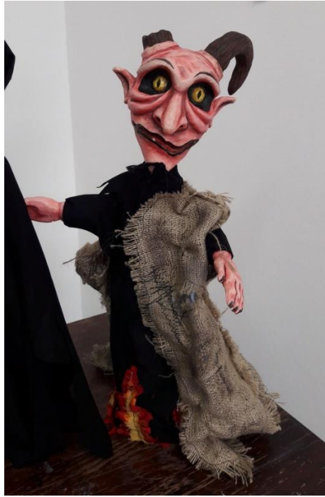
Slika 13.: Gotova lutka Vraga

Zadnji lik koji se u predstavi pojavljuje je lik Smrti. On se na sceni pojavljuje svega nekoliko sekundi. Jednom gestom pokazuje da je i on odustao od Puncha i Judy. U dramskom predlošku jedina karakteristika Smrti koju možemo iščitati je da je postao indiferentan. Na Slici 14. vidimo skicu i gotovu lutku Smrti.