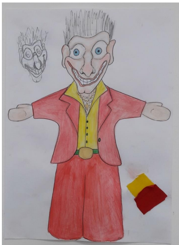
Slika 7.: Skica Puncha

Punch kao glavni lik uglavnom se pojavljuje u obliku koji je vidljiv na Slici 4. U literaturi o njegovom izgledu se navodi da ima grbu, veliki kukasti nos te crveno odjelce. Kao što se vidi na slikama, primarna boja u njegovom kostimu je crvena, zatim slijedi žuta te ima detalje u zelenoj boji. Te tri boje su bile osnova za Puncha i u našoj priči. Njegov karakter ukratko je opisala Marijana Županić Benić (Županić Benić, 2009:20) 21 : „Punch je prgav, svojeglav i bučan lutak koji se na sceni bori samo za svoje pravo da živi kako hoće. Zbog takvog stava morao je u svakoj predstavi biti najdominantniji. Kad bi god njegovu samovolju netko pokušao narušiti, on bi sve redom ubijao, bez obzira radi li se o djetetu, ženi ili predstavniku vlasti, a poštedio bi jedino svoju ljubavnicu.“ Crvena boja njegovog odjelca savršeno pristaje tome karakteru. Kada pogledamo opis Punchedvog karaktera u njemu prepoznajemo pojedine ličnosti suvremenog društva, osobe koje ne staju pred ničime kako bi zadovoljili svoj ego i napunili džepove. Na Slici 7. vidimo skicu Puncha za ovu predstavu.