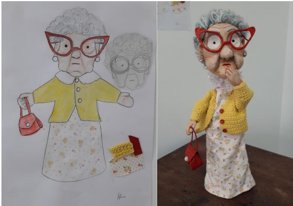
Slika 11.: Skica i gotova lutka bakice

Lik Bakice zamišljen je da izgleda kao mila i simpatična stara bakica kojoj bi svatko pomogao prijeći cestu, ali kroz igru vidimo da je i ona zapravo vrlo brutalna te na koncu kao i Punch istuče sve koji joj smetaju. Ona pomalo djeluje kao da je Punchova baka te se zbog toga na njezinom kostimu pojavljuju crveni detalji koji su vidljivi na Slici 11. Najizraženiji detalj crvene boje je njezina torbica koju koristi kako bi sve istukla.