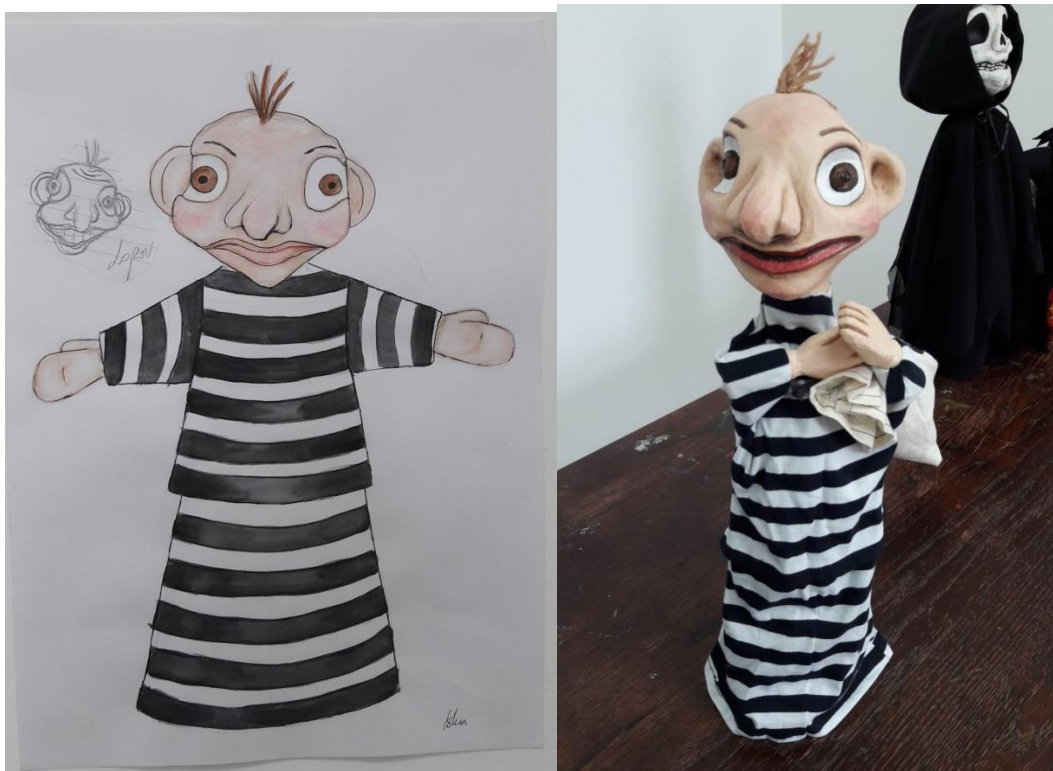
Slika 10.: Skica i gotova lutka lopova

Lik Lopova potpuno je novi u ovoj vrsti predstave. Lopov je dramaturški ubačen kako bi ukrao novce koje onda i Punch ukrade. Na Slici 10. vidimo skicu i gotovu lutku Lopova. Kao i kod drugih sporednih karaktera njegov je kostim napravljen u stereotipu lopova u prugastom odijelu koje se u suvremenom svijetu već postalo znak za lopova te se koristi za njihov prikaz. Lopov iz naše priče zapravo je najveća žrtva uz vraga. Njega se pretuče i prevari te je karakterno reprezentacija glupavog čovjeka kojega svi izmuče. Kako bi se istakla njegova maloumnost, napravljene su mu velike klempave uši te vrlo široko postavljene oči. To su fizička obilježja koja se često poistovjećuju sa ljudima slabijeg uma te dobričinama. Osmijeh mu je napravljen neodređeno te ne možemo razaznati hoće li se nasmijati ili rasplakati. Njegov fizički izgled kod gledatelja bi trebao izazvati sažaljenje i potrebu da ga se zaštiti kako bi drugi likovi djelovali još brutalnije.