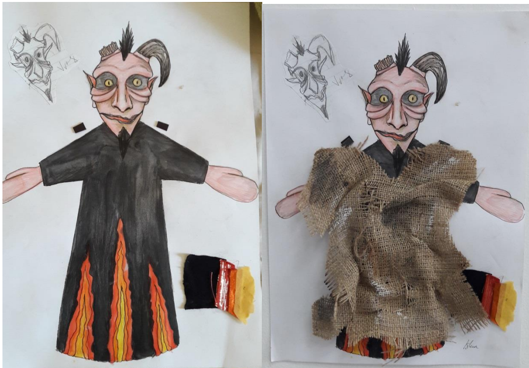
Slika 12.: Skice Vraga u dva različita kostima

vraga. On u jednom trenu ipak uspije pokazati svoje pravo mračno lice te je zbog toga njegov izgled morao biti promjenjiv. Promjenu vidimo na Slici 12. On prvobitno na sebi ima ogrtač napravljen od jutene vreće koji je pokidan i zamazan kako bi djelovao što jadnije i izmučenije. Na drugoj skici vidimo njegov originalni kostim na kojem su plamenovi pakla i djeluje vrlo otmjeno u crnoj boji.