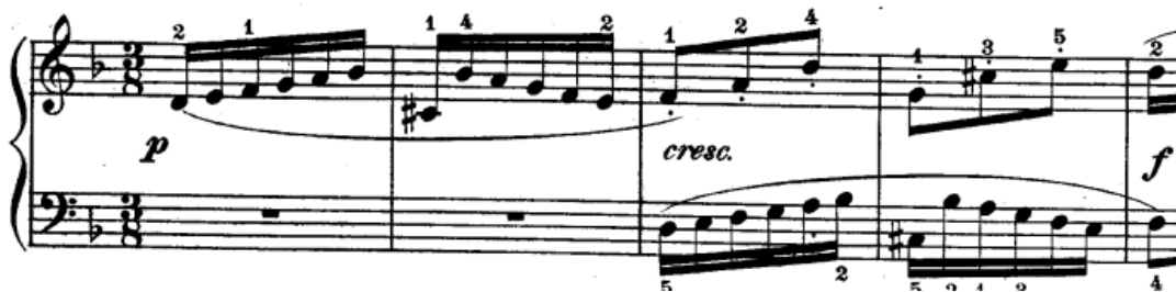
Slika br.10. Tema i odgovor(1-4 takt)