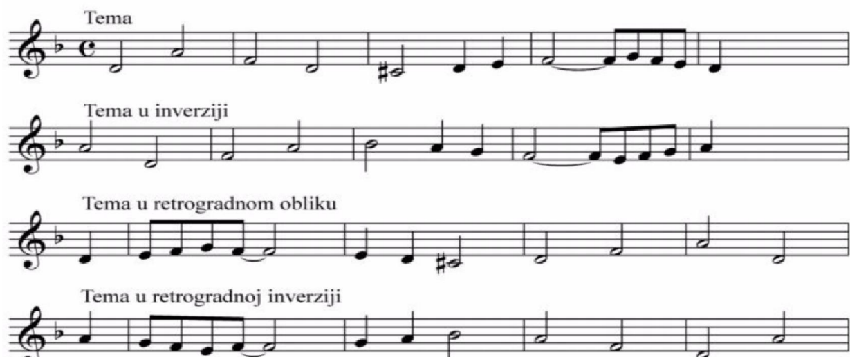
Slika br.3.Vrsteimitacije (Dedić, S. (2016), Glazbeni oblici razdoblja baroka i klasike . Zagreb. Str. 7.)

Skladatelj još može koristiti imitaciju u diminuciji (notne vrijednosti su dvostruko kraće od onih u temi), augmentaciji (notne vrijednosti u imitaciji su dvostruko duže od onih u temi), strettu (imitacija teme započinje za vrijeme izlaganja teme) te kanonsku imitaciju (u potpunosti se imitira ulomak koji traje nekoliko taktova).