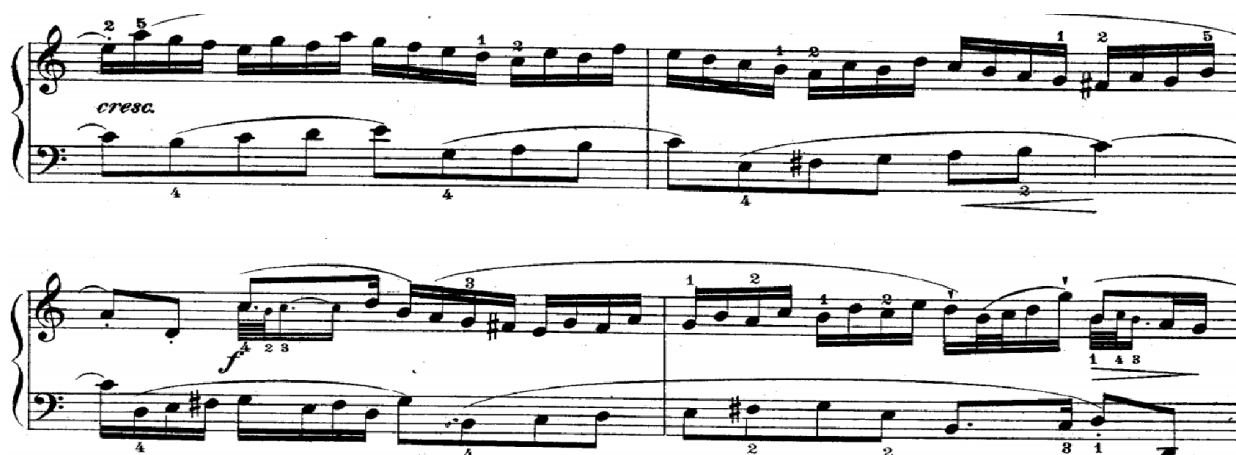
Slika br.5. Međustavak (3-6takt), (Izvor: http://www.freesheetmusic.net/bach/15%20Inventions.pdf )

Međustavak završava kadencom u G-duru što tumačimo kao najavu 2. dijela invencije.