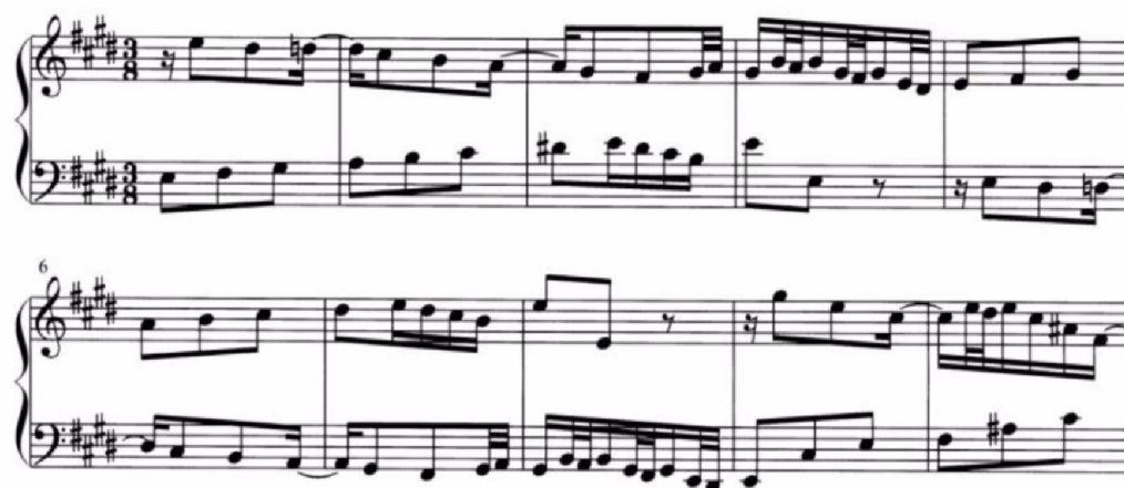
Slika br.1. Obrtajni kontrapunkt na intervalu oktave ( Klarić, B. (2008.), Analiza polifonih glazbenih oblika . Zagreb, str.15.)

Tehnika obrtajnog kontrapunkta podrazumijeva zamjenu glasova na način da gornji glas postaje donji i obratno. Pri tome se u suzvučjima ne smije pojaviti neskladnost. Postoji dvostruki, trostruki, četverostruki obrtajni kontrapunkt, ovisno o broju glasova. Dvostruki kontrapunkt se najčešće izvodi na intervalu oktave (slika br.1), a može se izvoditi na intervalu decime i duodecime, ovisno o tome za koliko se gornji glas premjesti dolje ili obratno.