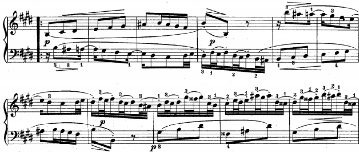
Slika br.18. Druga provedba (21-31 takt)

Druga provedba invencije započinje u 21. taktu pojavom teme u dominantnom H-duru u donjem glasu (slika br.18). Istim principom kao na samom početku invencije, nakon teme slijedi kratka kadenca te se obrtajnim kontrapunktom odgovor izlaže u gornjem glasu u 25. taktu. U 28. taktu je kratka kadenca.