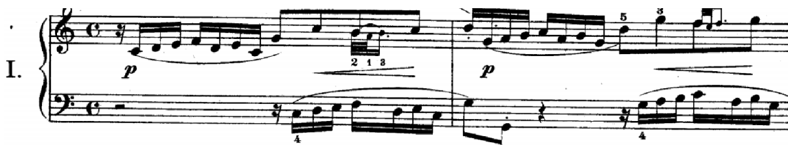
Slika br.4. Izlaganje teme

Dvoglasna invencija u C-duru započinje izlaganjem teme u gornjem glasu i traje samo pola takta (završava osminkom g 1 na trećoj dobi). Nakon šesnaestinske pauze u donjem glasu počinje imitacija teme ili odgovor na intervalu oktave. Za to vrijeme u gornjem glasu iznosi se kontrapunkt. Izlaganje teme i odgovora još jednom se ponavlja u drugom taktu zbog kratkoće teme, ali ovaj put na dominantni (slika br.4).