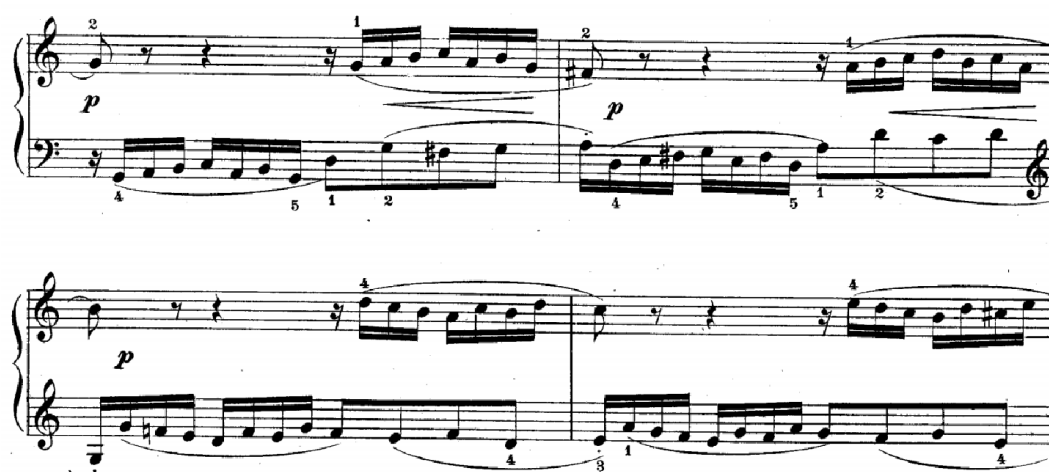
Slika br.6. Druga provedba (7-10 takt),

Drugi dio invencije naziva se još i drugom provedbom. Započinje u 7. taktu (slika br.6) izlaganjem teme u donjem glasu (dominantni G-dur). Nakon toga slijedi odgovor u gornjem glasu na intervalu oktave. U 8. taktu se to sve još jednom ponavlja, ali na dominantni G-dura. Kontrapunkt koji se iznosi dok traje imitacije teme isti je kao i na samom početku invencije. U 9. taktu tema je inverziji i modulira u C-dur te slijedi odgovor. Nakon toga se tema i odgovor u inverziji ponavljaju u 10. taktu, ali za interval velike sekunde naviše modulirajući u d-mol na samom kraju 10. takta.