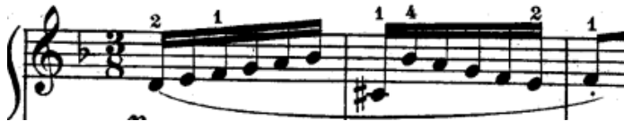
Slika br.9. Tema

Dvoglasna invencija u d-molu započinje temom u šesnaestinkama (slika br.9) u gornjem glasu. Tema traje dva takta nakon čega dolazi do iznošenja odgovor na intervalu oktave u donjem glasu. Dok se u donjem glasu iznosi odgovor u gornjem glasu se iznosi kontrapunkt u osminkama (slika br.10).