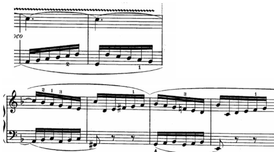
Slikabr.13. Drugi međustavak (20-25 takt)

Nakon izlaganja teme u 2. provedbi slijedi drugimeđustavak u 20. taktu (slika br.13). U 20. taktuskladatelj u donjem glasu koristi tematski materijal dok je u gornjem glasu triler koji je već započeo u 19. taktu kod izlaganja teme. U 22. i 23. taktu pojavljuje se model sekvence koji u 23. taktu modulira u g-mol. Nakon toga slijedi transpozicija sekvence za interval sekunde niže u F-duru koji možemo vidjeti u 24. taktu.