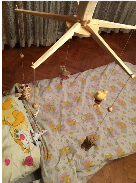
Prilog 7 – Vrtuljak s igračkama