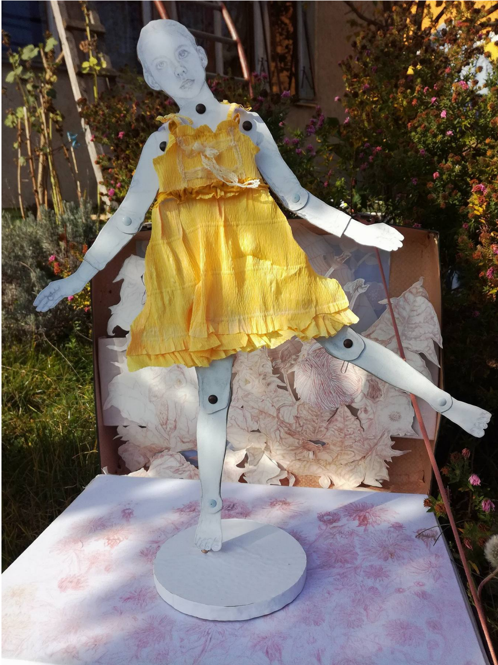
Slika 5: Plesna haljina žutog maslačka, v.101 x š.78 cm., crtež crvenom i smeđom kredom