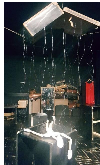
Slika 8: Lutka nakon pada

Sedma scena, ujedno i posljednja u našoj predstavi bila je rastanak od lutke. Svi animatori zajedno vodili smo lutku od ruke do ruke, prebacujući njezin križ od jednog do drugog sa velikim oprezom. Lutka je hodala po ogledalu između svijeća i svatko od nas morao ju je oprezno voditi da slučajno