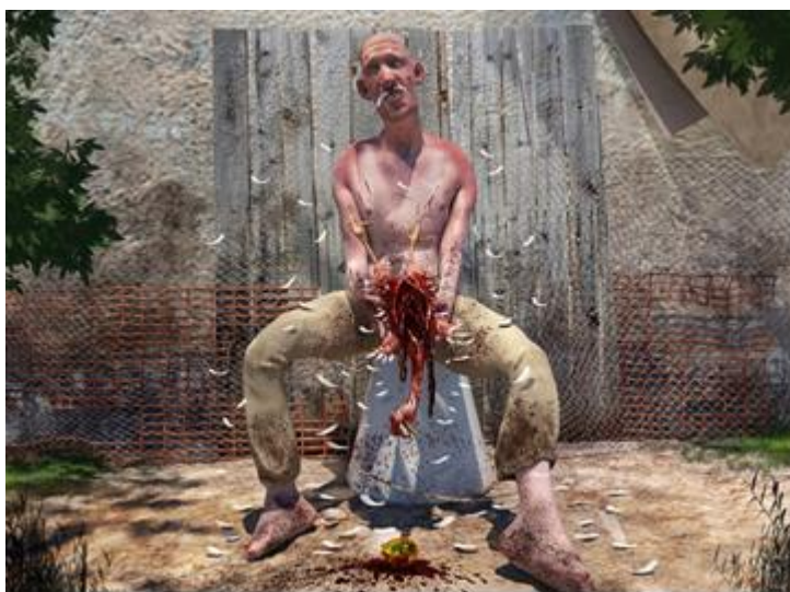
6. Basna „Zlatna jaja u kokoši“

U ilustraciji sam se bavio prizorom baš onog trenutka kada je čovjek rasporio kokoš i shvatio da unutar njezine utrobe nema ničega te da ga je njegova pohlepa dovela do potpunog i nerazumnog gubitka. Baza ilustracije rađena je u 3D-u kako bi se dobila točnost sjena i volumena, a zatim je doradena u Photoshopu. Izvedena je tako da se na prvi pogled čini kao da je čovjek rasporen pošto se na prvi pogled ne vidi odmah da drži kokoš. To sam napravio kako bih dočarao njegova slabost i prazninu koju je u sebi stvorio, pa se i osjeća kao da je svoju vlastitu utrobu razderao. Njegovo je lice zbunjeno i glupo, i nema velike reakcije u izrazu.. Razbacano je perje ovdje u funkciji dočaravanja praznine, zbog gubitka koji je sam sebi stvorio, a u centru je naglašen krvavi prizor smrti i snage razaranja, pošto je kokoš rasporio golim rukama u naletu pohlepe, želeći vidjeti i pronaći zlato unutar utrobe. Time sam želio ukazati na apsurd i ironiju prizora.. Pozadina je također rađena u 3D tehnici, a siromašan zid i hrđava ograda govori nam o socijalnom statusu čovjeka, ali i simbolički prikazuje prazninu njegovog karaktera.