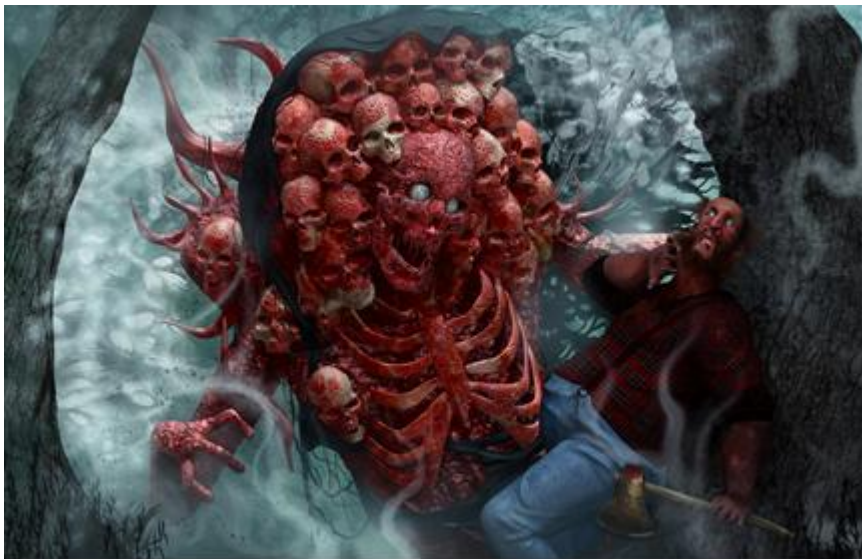
11. Basna „Starac i smrt“

Ilustracija pokazuje trenutak kada se smrt pojavljuje pred starcem i pita ga što želi. Starac je preplašen i naslonjen na drvo. Smrt nije prikazana stereotipno, kao kostur u crnom plaštu, nego kao tijelo u trajnom raspadanju s pokvarenim mesom još na kostima. Želio sam smrt na