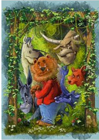
12. Basna „Dosjetljiva lisica“

Ilustracija pokazuje personificirane životinje, a želio sam postići idiličan ugođaj sklada. Okvir ilustracije također slijedi zadanu ideju oponašanja izraza uobičajenih dječjih slikovnica. Iako veličinom manji, stari lav bojom nosi glavni naglasak ilustracije. Životinje se pogledom usmjeravaju uglavnom gledatelju, zovući ga u okvir ispričane basne i prizora, koji izgleda simpatično i bezazleno. Izrazima lica životinje su personificirane u različite tipove ljudskih karaktera