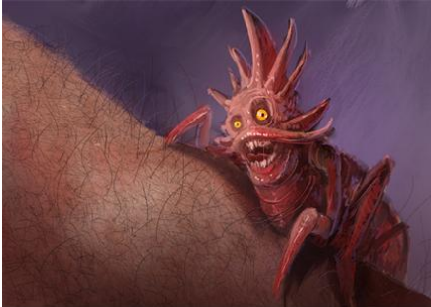
1. Basna „Buha“

Buha je u ovom slučaju je prikazana kao čudovište te joj je veličina prenaplašena kako bi se dočarala nepotrebna muka i strah čovjeka u basni. Bezopasna mala buha ilustrirana je kao veliko čudovište koje predstavlja pravu prijetnju .