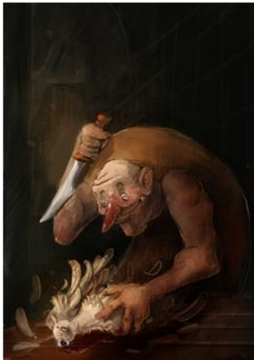
3. Basna „Čovjek i jarebica“

Ilustracija pokazuje trenutak prije nego što će čovjek zaklati jarebicu. Izraz njegova lica je zadovoljan i bez sućuti, a dok drži nož, jarebica se pokušava oteti, što se vidi po razbacanom perju. Za ovu sam ilustraciju odabrao tamnije boje kako bih dočarao atmosferu buduće radnje