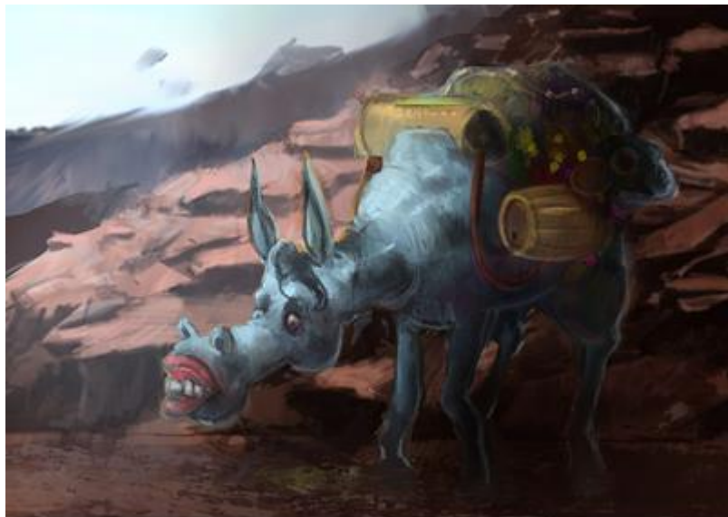
4. Basna „Divlji magarac“