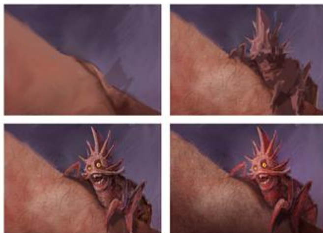
2. Basna „Buha“ -detalj

Prikazana je kako ju taj čovjek vidi u svom pretjerivanju , misleći da mu stvarno treba tuđa pomoć kako bi ju maknuo sa sebe. Ilustracija je odrađena u tehnici digitalnog slikarstva bez intervencije 3D-a, a proces slikanja je klasičan, od velikih cjelina gradio sam prema manjim, do detalja kao što su dlake na koži ruke.