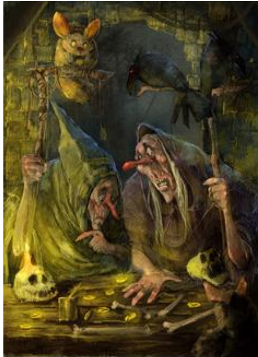
9. Basna „Tračak“

Na ilustraciji su prikazana dva vrača koji se međusobno dogovaraju i nesugurni su što će reći da vide u proricanju jer su, naravno, varalice i ne znaju budućnost. Ipak, unatoč tome, prijevari pristupaju kao ozbiljnom, skoro filozofskom poslu, jer su u cijelom životu stvorenom od laganja, zapravo sami sebi počeli vjerovati. Komičan se efekt želi postići razigranim likovima na štapovima iznad njih, kao i u lubanjama koje izgledaju bezazleno kao iz prezentacije nekog animiranog filma. Što se tiče tehnike, sve je odrađeno digitalno. Dva stara vrača u prvome planu stoje za stolom i pokušavaju proreći budućnost. Slika je naslikana u mračnim tonovima bez previše kolorita. Izvor svjetlosti je samo svijeća, čime bi se trebala dobiti mračna atmosfera, neka iluzija prošlog vremena. Okolina je iterijer neke tamnice ili mračnog podruma, a životinje na štapovima vračeva simboliziraju lakovjernike koji očekuju mistiku i magiju, te se iščuđavaju i lako su zavarani njihovim riječima.