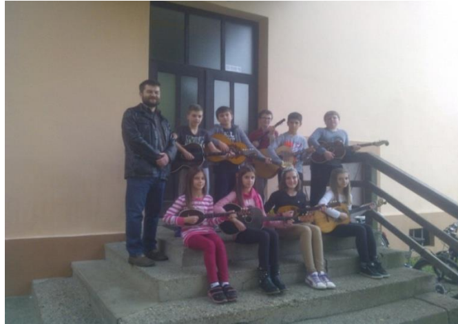
Slika 3. Školski (mali) tamburaški orkestar 9