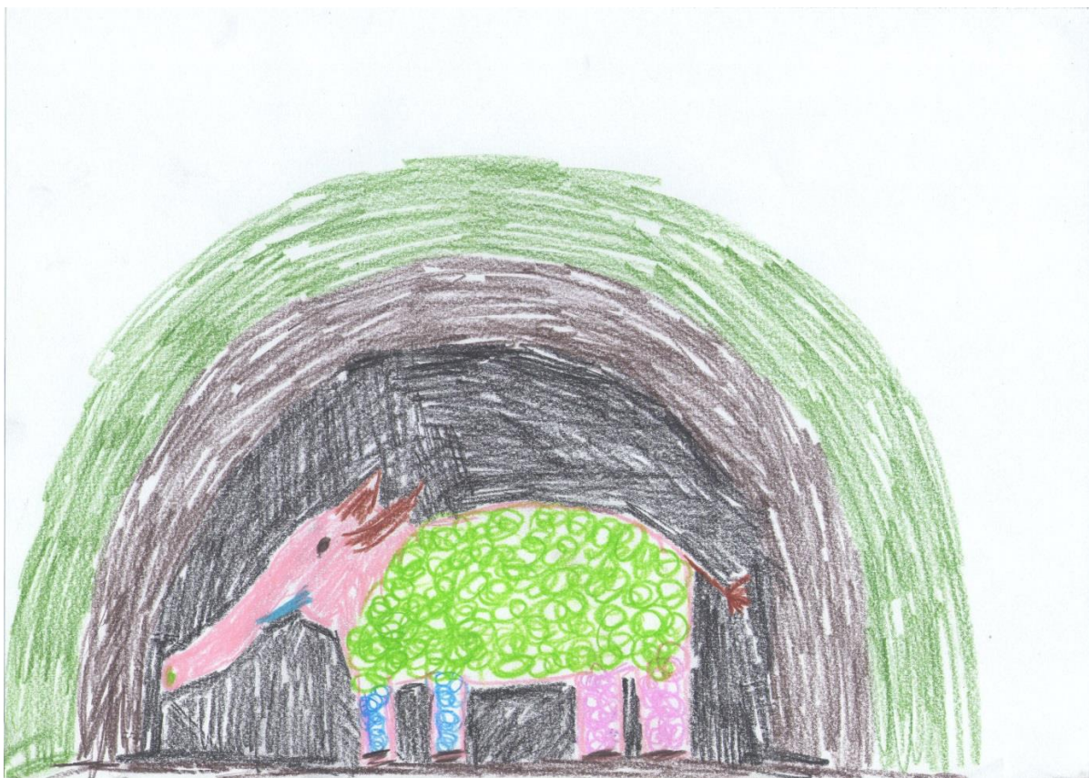
"Kovrčavi slonorog", Marko, 12 godina

Kovrčavog slonoroga, životinje nastale spajanjem slona, ovce i bika, imate prilike vidjeti samo u špiljama. Marko se odlučio kao bazu ovog stvorenja uzeti tijelo slona, kričave kovrče ovce i rogove bika. Boje koje je Marko izvukao su svjetlozelena, ružičasta, smeđa i svjetloplava, a stanište je špilja. Vidimo prepoznatljivo veliko tijelo slona i njegove noge koje podsjećaju na stupove, kao i dugačku surlu i kljove. Marko je odlučio dati ovoj životinji runo kakvo je vidio na ovcama. Iscrtao ih je ujednačenim kruženjem ruke. Na vrhu glave nacrtao je par smeđih rogova bika.