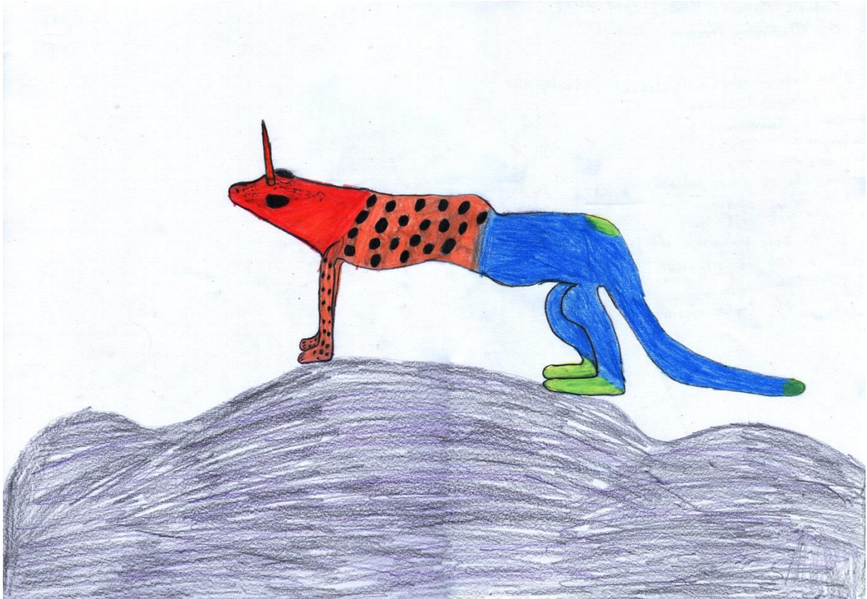
"Jednorogi bodač", Gabrijela, 14 godina

Gabrijela je crtala stvorenje koje je spoj tri životinje: žabe, leoparda i klokana. Na vrh žablje glave smješta dugački crveni rog, obrambeni sustav ove životinje, srednji dio tijela je točkasto tijelo leoparda, a stražnji je onaj od klokana, obojan tamnom plavom i zelenom bojom. Stvorenje je nazvala Jednorogi bodač.