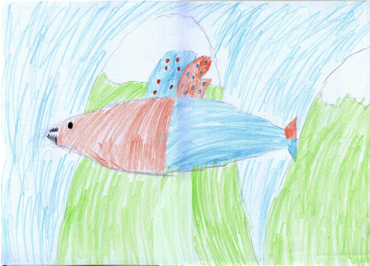
"Zubati planinar", Zvonimir, 10 god.

Zvonimir je bacanjem kockice za izvlačenje životinja dobio broj dva, a izvukao je leptira i morskog psa. Bacanjem kockice za izvlačenje boja dobio je broj dva, nakon čega je izvukao boje: narančastu i svjetloplavu, a za stanište je dobio planine.