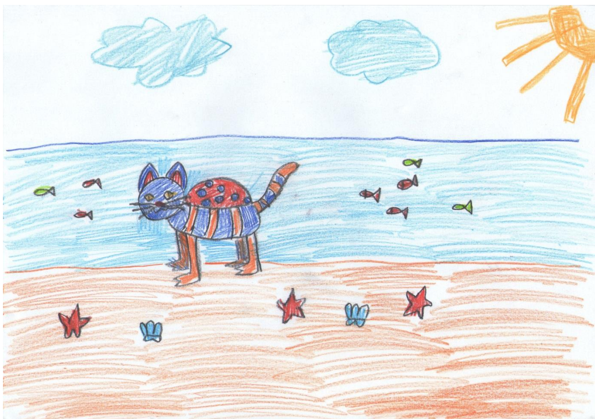
"Oklopljena mačkopatka", Viktorija, 11 godina

Viktorija je izvukla papiriće s imenima mačke, patke i kornjače. Brzo je povezala oklop kornjače s bubamarinim, nacrtavši prepoznatljive bubamarine točke. Stvorenje ima glavu i rep mačke, a noge patke. Smještaj kojeg je Viktorija izvukla je obala mora. Napravila je tri plana: u prednjem je pješčana obala na kojoj je smjestila morske zvijezde i školjke, u drugom planu je more s jatom šarenih riba, a u trećem planu šablonsko sunce u kutu kao i plavi oblaci.