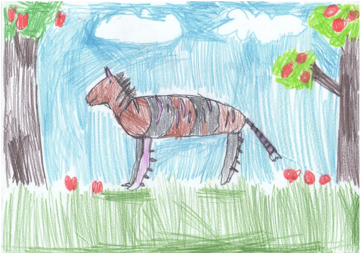
"Pipkavi magarac gusjeničar", Ana, 11 godina

Ana je izvukla četiri životinje: magarca, gusjenicu, tigra i hobotnicu, koje je spojila u jedno stvorenje nazvano pipkavi magarac gusjeničar. Ima glavu magarca, dugačko tijelo gusjenice ukrašeno tigrovim prugama, četiri noge s pipcima hobotnice i tigrov rep. Za razliku od Ivanovog uratka, Anino stvorenje nema osam nogu, no izrazila je pupoljke na njima. Šuma je smještaj kojeg je Ana izvukla, a prikazala ga je standardno šablonski: na kraju papira i dva drveta – ova je šablona koju djeca često koriste kako bi prikazali šumu. Na drvima i ispod njih su jarkocrvene jabuke. Visoka trava koju je Ana prikazala narisana je dugačkim ravnim potezima.