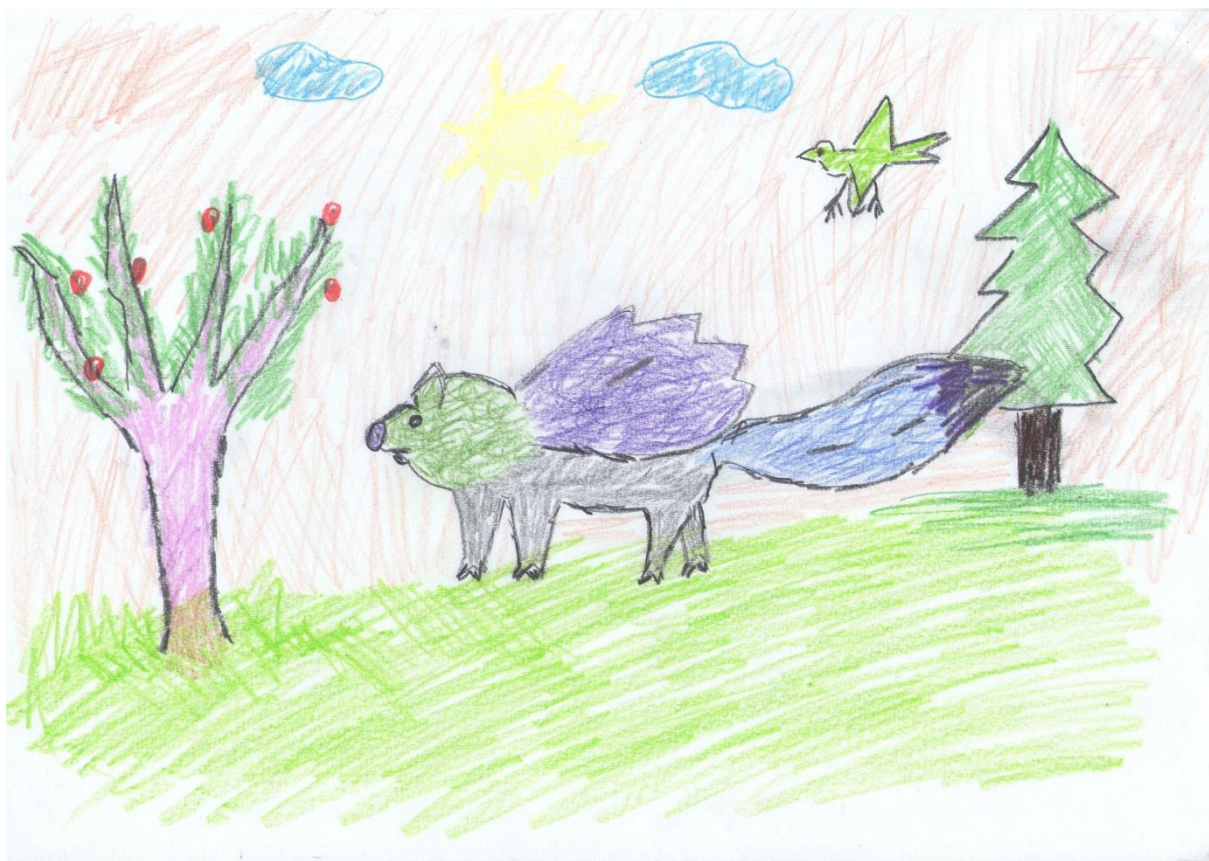
"Čarobni leteći vepar jede začarane jabuke", Marija, 12 godina

Marija, polaznica 6. razreda, izvukla je papiriće s imenima vepra, lisice i šišmiša. Boje koje je izvukla su zelena, ljubičasta, svjetlosiva i tamnoplava, a stanište je začarana šuma. Tijelo vepra služi kao baza, rep je lisičji, a na leđima ima krila šišmiša. Smještaj kojeg je Marija izvukla je začarana šuma. Marija je učenica koja voli crtati, tako da se bez problema prihvatila ovog zadatka. No kako je izvukla četiri različite boje, upitala me mora li svinja biti jednobojna, na što sam je potaknula da razmisli želi li je takvu ostaviti ili raspodijeliti boje po tijelu životinje: primjeri koje sam joj dala su da može svaku nogu drukčije obojiti, obojiti glavu drukčije od ostatka tijela, pa čak i da može dodati nekakve uzorke, kao što su točkice, linije, spirale i slično. Marija je na kraju odlučila glavu životinje obojiti u zeleno, krila u ljubičasto, a rep istaknuti plavom bojom i ljubičastim linijama. Kako je smještaj koji je Marija dobila začarana šuma, odlučila je prikazati je sa samo dva različita drveta, šablonskim borom kakvog možemo vidjeti na crtežima božićnog drvca i ružičastog drveta s četiri grane, zelenim lišćem nalik na iglice bora i okruglim crvenim jabukama. Podloga je zelena trava, a nebo je svijetle narančaste boje, s plavim oblacima i žutim suncem čije su zrake špicaste. Marija je dala ime ovom stvorenju: čarobni leteći vepar.