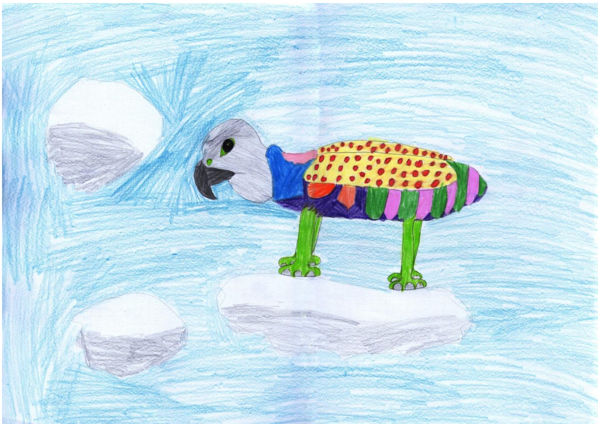
"Četveronožni kljunaš", Gabrijela, 14 godina

Gabrijelino je drugo stvorenje još jedan spoj tri različite životinje. Ono ima glavu sokola, tijelo skakavca, a noge slona. Ta životinja živi na oblacima. Prije nego je počela bojati, pitala me hoće li oblake obojati plavom bojom, na što sam ju upozorila da to ne radi (jedna od šablona u dječjem izražaju je taj da su oblaci plavi, a nebo bijelo), nego da oblake ostavi bijelima, ali da sa sivom bojom naznači sjenu tih oblaka, a nebo oboji plavom bojom. Četveronožni kljunaš , naziv je njezinog stvora, inspiriran slikama grifona.