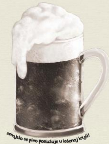
Zmajsko se pivo poslužuje u leđeraj inđali

Patuljak kuhar Darmar Pivobrađi živi s Patuljcima u brđima Zmajgorja, gdje priprema razne specijalitete od zmajskog mesa, koje naprosto obožavaju. Ovaj Patuljak je vesele naravi sve dok je opijen zmajskim pivom kojim će vas rado ponuditi. Darmar Pivobrađi voli kuhati i za prijatelje i za iznenađne goste. Često isprobava neobične kombinacije mesa više vrsta zmajeva. Darmar Pivobrađi u baš sva svoja jela dodaje zmajsko pivo.