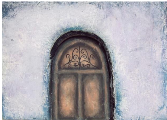
Slika XVIII. Ružina vrata

Ružina vrata također su od velike važnosti za njezin lik. Kada je započelo nevrijeme i pas se poželio sakriti u nju, ona to nikako nije htjela dopustiti. Za nju je to bila granica koja se ne prelazi. Tek kad postane vrlo ozbiljno, kada uslijed grmljavine izbije i požar što dovodi psa u životnu opasnost, ona to ipak dopusti. „Pustila sam te unutra“ povikala je psu, iznenadivši tako i samu sebe. Napokon uspijeva nekome pokazati pravu sebe, otvoriti svoja vrata, odnosno, otvoriti svoje srce. Vrata su, dakako, morala biti dovoljno velika kako bi psić mogao ući u kuću.