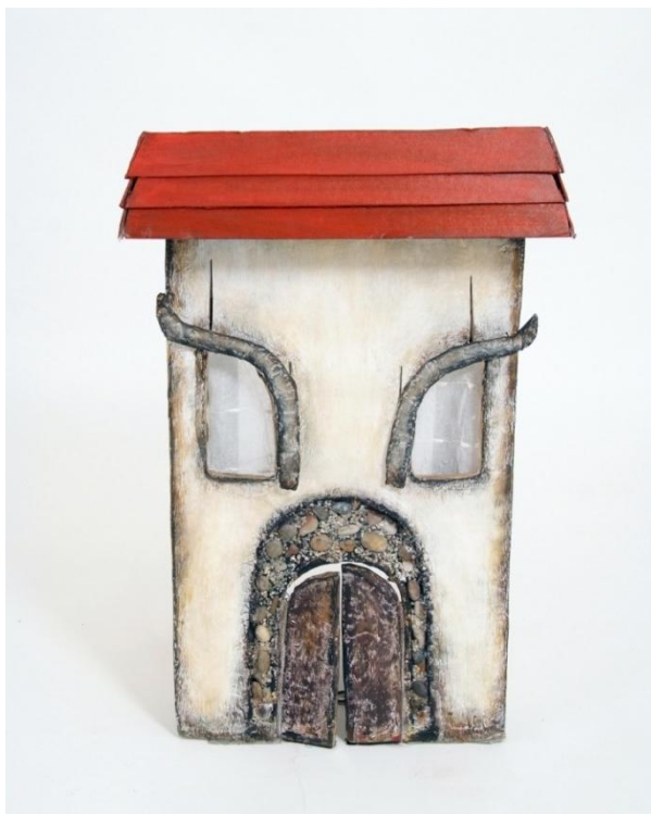
Slika VII. Sofija

Sofija predstavlja kuću moderne arhitekture, vrlo zadovoljnu svojim izgledom „femme fatale“ ulice. Za razliku od jednostavne Mile, Sofija nosi dašak elegancije i karakteriziraju ju nešto drugačije linije. Iznad treptajućih očiju, odnosno zavjese koja se može dići i spuštati nalaze se također pomične obrve koje Sofiji daju određenu dozu oštine. Tehnološki, obrve su izrađene na sljedeći način: iznad očiju napravila sam dva uska, dugačka proreza. Kroz te proreze „klize“ žičane vodilice na kojima se obrve nalaze. To im omogućuje spuštanje i ponovno podizanje. Na kraju svake žice nalazi se tipla kako bi animatoricama bilo lakše držati vodilicu.