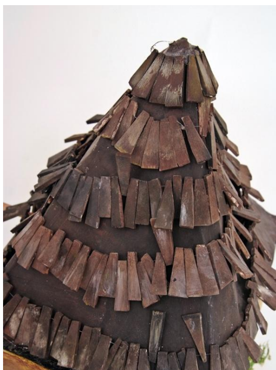
Slika XV. Milijevova ciglica koja može ispasti