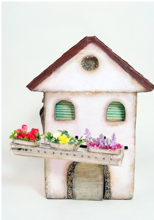
Slika V. Milin pomični balkon