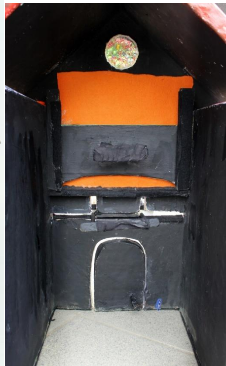
Slika VI. Mila stražnji dio, mehanizmi