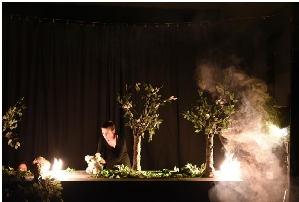
Slika XXXVI. Treća scena, požar u šumi