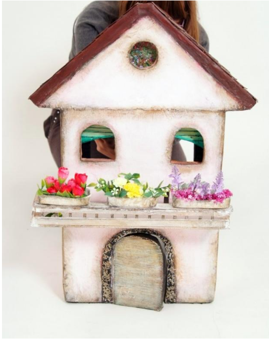
Slika III. Milin mehanizam treptanja