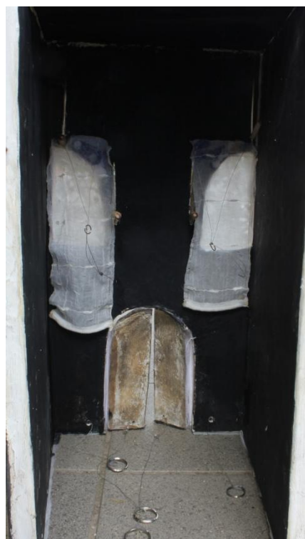
Slika XI. Sofija stražnji dio, mehanizmi