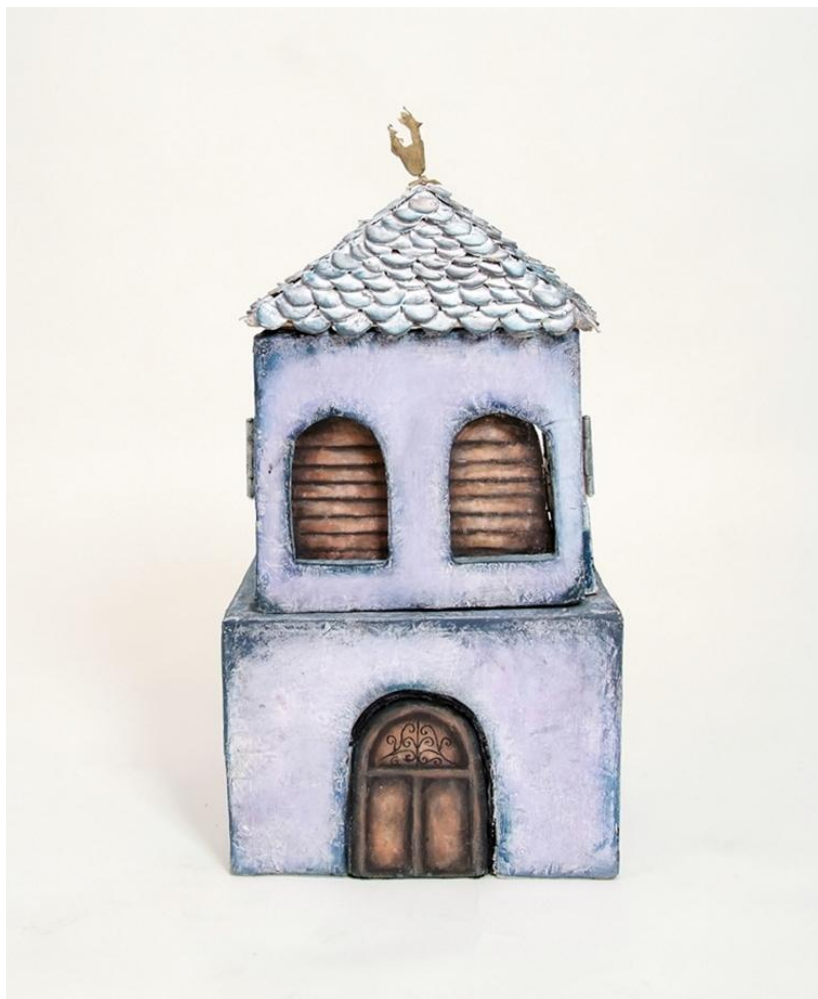
Slika XVII. Ruža

Za Ružin izgled inspirirale su me uklete kuće na osami koje se često mogu vidjeti u horor filmovima. Imaju taj jeziv, misteriozan izgled, ali su opet neobično zanimljive. Osim što je tako izgledala, Ruža se zaista ponašala kao da je ukleta. Kada bi netko od potencijalnih kupaca došao u razgledavanje kuće, ona bi mu priredila vrlo neugodno iskustvo, palila je i gasila svjetla, tresla zidove... Tako je otjerala svakoga tko bi došao i potpuno opustošila svoje srce. Oči mnogo govore o karakteru lika.