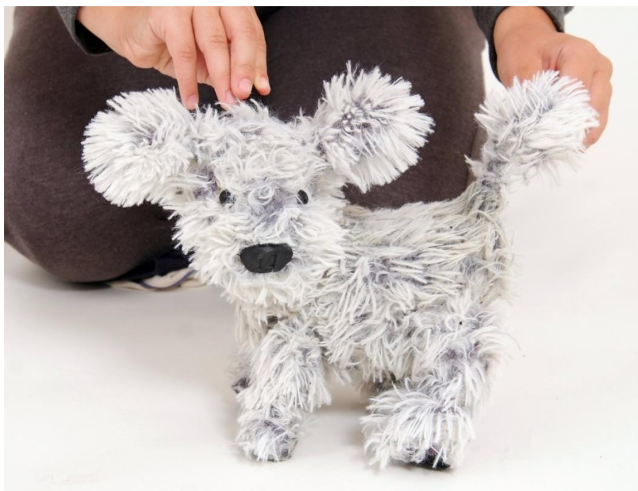
Slika XXVII. Pas

Za razliku od Ruže koja to nipošto ne želi, pas očajno želi biti njezin prijatelj. Dok kuće imaju karakteristike ljudi, pas je u potpunosti životinja. On je tipični razigrani pas lutalica kojeg i najmanja sitnica razveseli i učini da maše repom. Pas je izrađen kao stolna lutka, a njegovo su tijelo, glava i nožice od oblikovane spužve. Uši i rep ispunjeni su vatelinom. U glavi se nalazi jedna vodilica. Mogućnost okretanja glave daje mu gurna uljepljena dijelom u vrat, dijelom u tijelo.