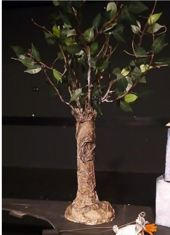
Slika XXXI. Dio scenografije, drvo

Budući da u šumi dođe do požara, djevojke su koristile pravu vatru. Osobno, nikad se ne bih odlučila za taj izbor jer mislim da postoji više lutkarskih rješenja od prave vatre. Igre svjetlom, sjenom, zvukom, pa čak i UV teatar... Mogućnosti su beskonačne. Lutkarsko kazalište pruža brojne mogućnosti koje nisu moguće u pravom svijetu, što treba iskoristiti. Smatram da se ne mora sve doslovno prikazivati i oduzeti publici mogućnost maštanja. Također, paljenje vatre inače je strogo zabranjeno u kazalištu. Jezero su djevojke same osmislile uz pomoć svoje mentorice, za njegove potrebe u sredini stola nalazio se eliptični dio koji se može izvaditi van. Efekt vode postigle su igrom prozirne folije i svjetla.