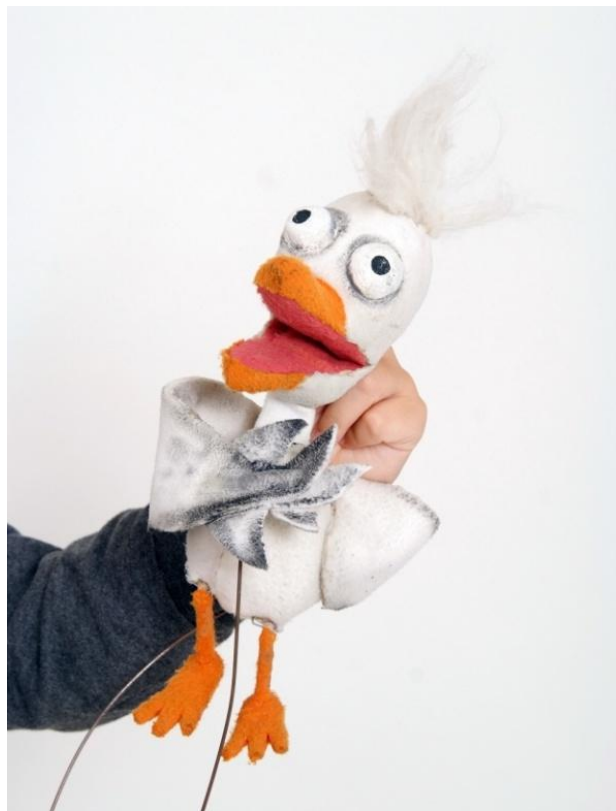
Slika XXX. Galeb u dramatičnoj pozi

Galebove velike, iskolačene oči i čuperak na glavi pridonose njegovom luckastom karakteru, čini ga tako komičnim i vizualno, a ne samo karakterno.