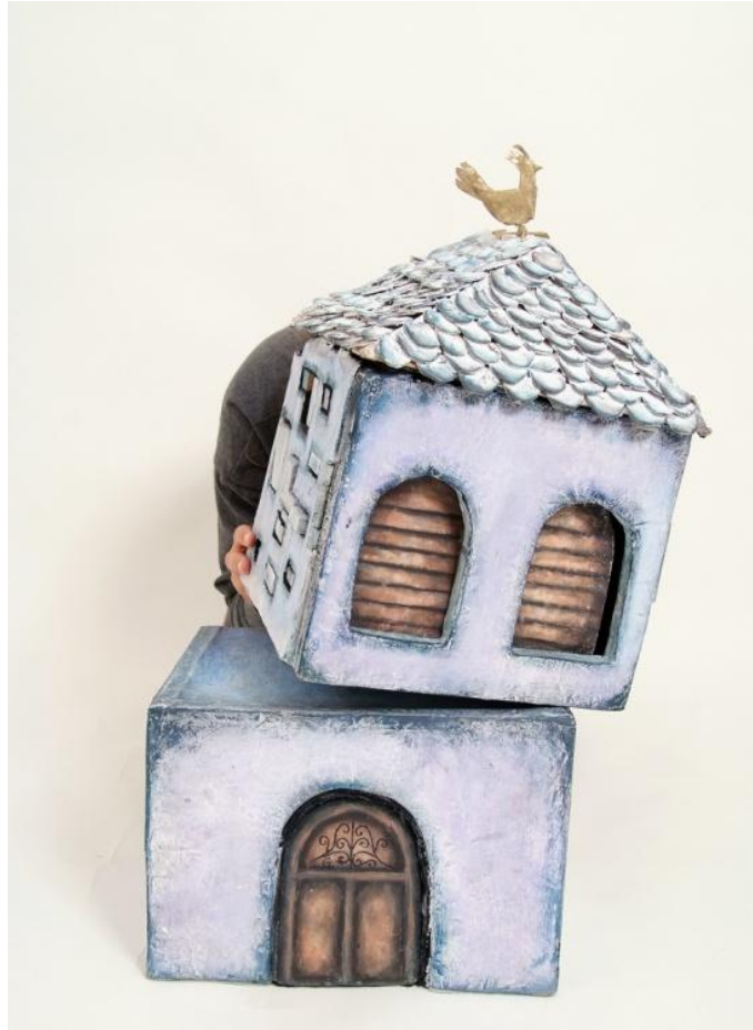
Slika XXVI. Ružin „pogled“

Na početku, Ruža koristi samo tri mehanizma, treptanje očiju, otvaranje i zatvaranje vrata te mogućnost razdvajanja gornjeg dijela od donjeg. Za to vrijeme potreban je samo jedan animator. U trenutku kada Ruža krene na put, više ne stoji na mjestu, hoda te koristi više mehanizama odjednom, nužan je još jedan animator.