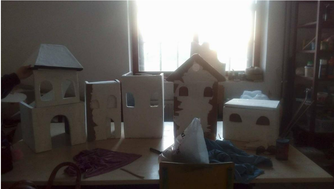
Slika I. Spojeni i prekaširani zidovi kuća

Zatim kreće najzahtjevniji posao – mehanizmi. Na samom početku projekta, ideja je bila da Milivoj, Mila i Sofija imaju neki sebi karakterističan pokret i način animacije. Daljnjim radom i u dogovoru s kolegicama, to se promijenilo. Tako sam svakoj kući osmislila nekoliko različitih pokreta karakterističnih za njihov lik, što će im još više dati na živosti. Također, još jedna promjena nastala u procesu rada bila je dodjeljivanje zajedničkog, istog mehanizma svakoj kući – gledanje i treptanje kroz njezine prozore/oči. Na taj način stvorio se koncept povezanosti između svih kuća. To je najuočljivije u prvoj slici. Kuće na početku spavaju sve dok njihovi stanari ne započnu s radnim danom i pođu od svojih domova zbog dnevnih obaveza. Kada ih stanari napuste, one se bude, otvaraju oči i komuniciraju njima, započinju svoj život.