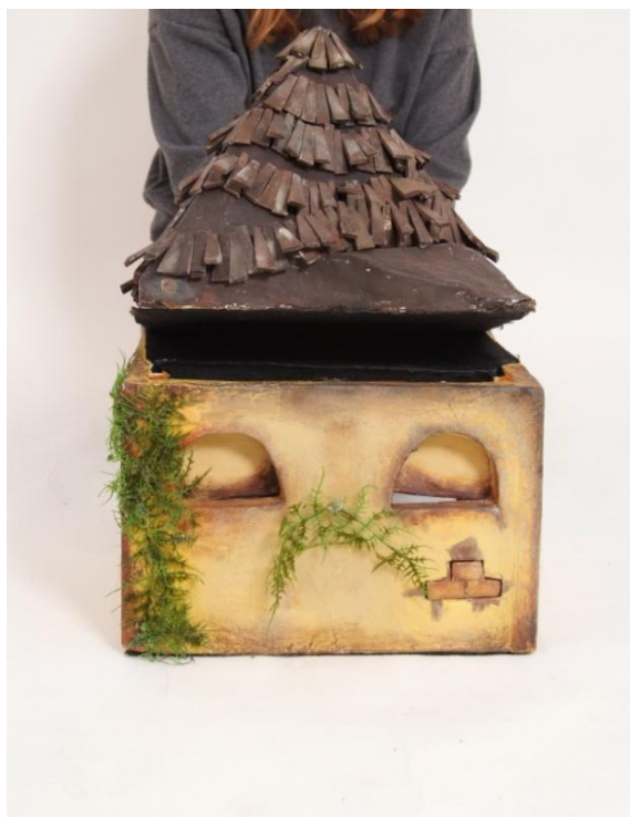
Slika XIII. Milivojev krov – zijevalica