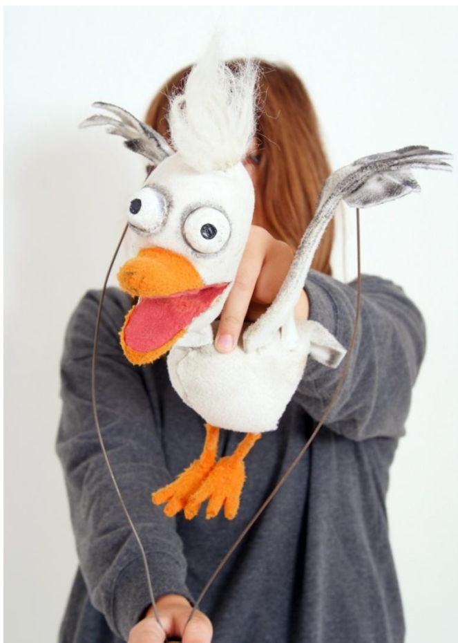
Slika XXIX. Galeb

Galeb je veliko osvježenje za „Mjesto za dvoje“. On je nespretan, glasan, dramatičan, ali prije svega uporan i maštovit u pokušajima osvajanja kokoši. Osvajanje mu nikako ne polazi za rukom, a upravo ga to čini komičnim likom. Galeb je izrađen kao zijevalica, ali budući da je njegova glava manja od čovjekova dlana, umjesto četiri prsta u gornji dio njegova kljuna stavljaju se dva. Galebova glava i tijelo izrađeni su i oblikovani iz spužve. Krila su izrađena od debelog filca, a spojena su na tijelo s gurnom. Upravljanje krilima omogućuje žica, čiji se vrhovi nalazi u svakom krilu, a onda se njihov razmak sužava dok se na kraju ne spoji u vodilicu koja omogućuje istovremeno kretanje oba krila. Žica omogućuje galebu i druge kretnje krilima osim letenja – hvatnje za glavu, za srce, prekrivanje kljuna krilima i ostale dramatične kretnje koje dolikuju njegovom liku.