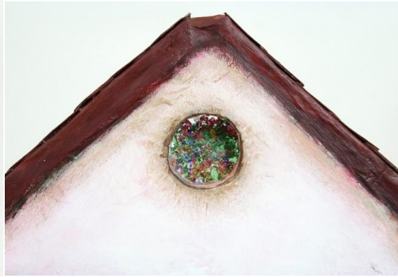
Slika IV. Milin vitraj