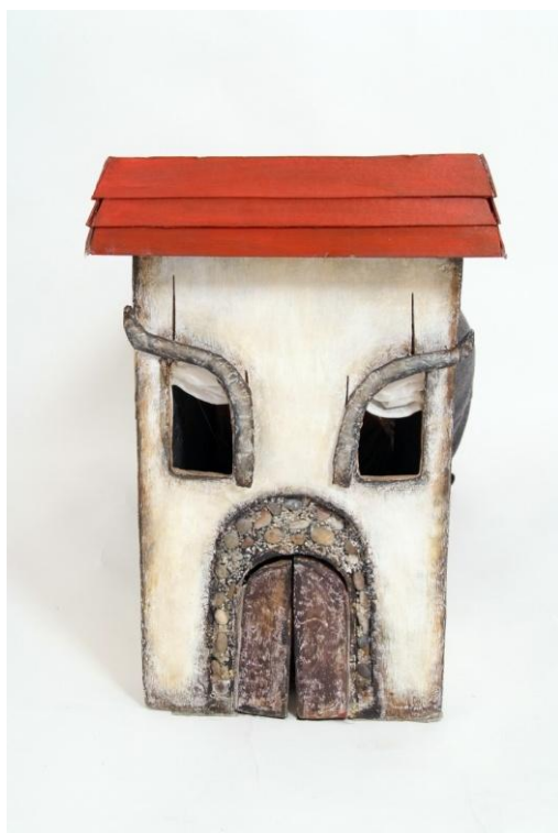
Slika X. Sofijin mehanizam treptanja očiju