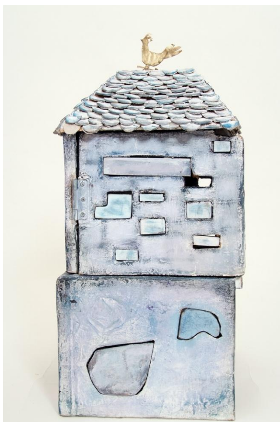
Slika XXII. Ružina bočna strana, ciglice