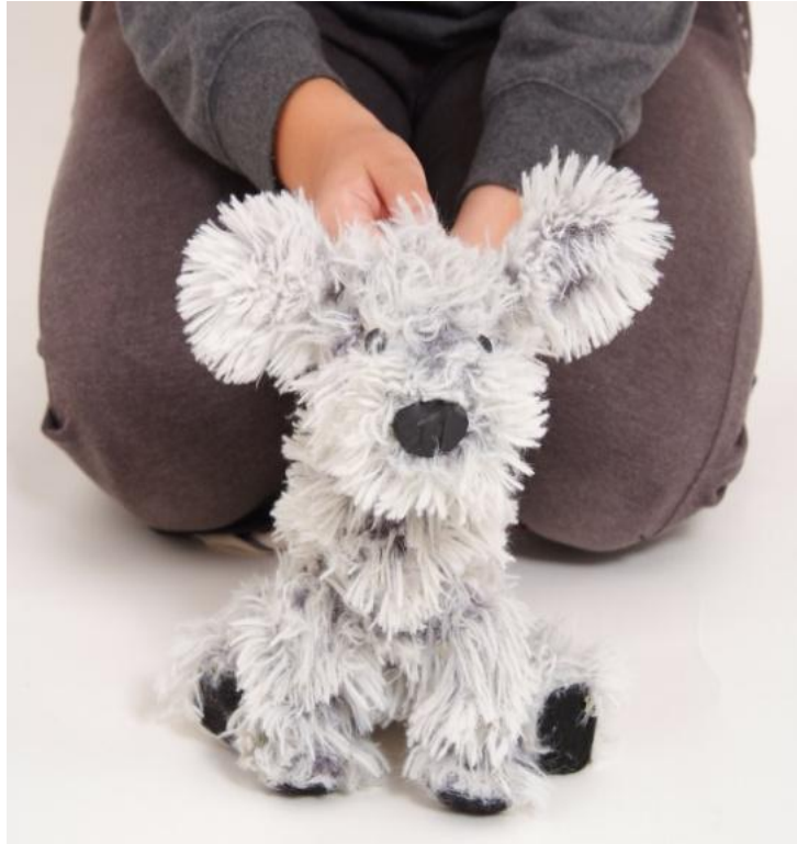
Slika XXVIII. Pas sjedi