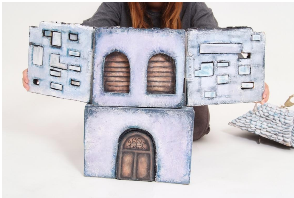
Slika XXIII. Mogućnost širenja Ružinih zidova

Bočni zidovi gornjeg dijela Ruže spojeni su s prednjim dijelom gdje se nalaze njezine oči na dva načina: prednji dio bočnih zidova spojen je na šarke, a njihov stražnji dio, dio koji publika ne vidi, spojen je na gumice za podnožje gornjeg dijela. To Ruži omogućuje otvaranje zidova, njihovo širenje i skupljanje, a gumice joj, osim mogućnosti širenja, daju stabilnost dok mehanizam sa šarkama nije u upotrebi. U protivnom bi se zidovi širili bez volje animatora i u trenucima kad to ne smiju.