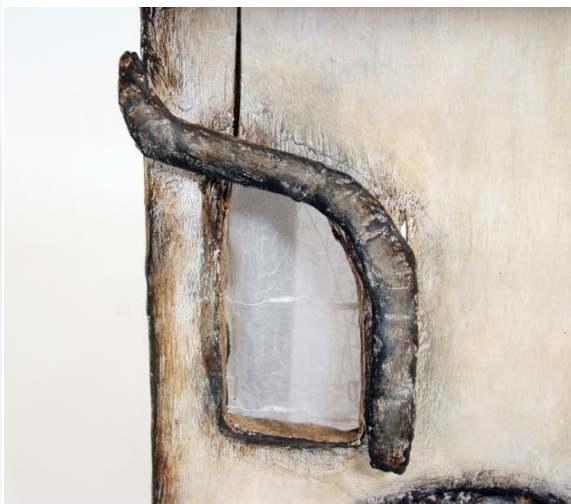
Slika IX. Sofija, detalj