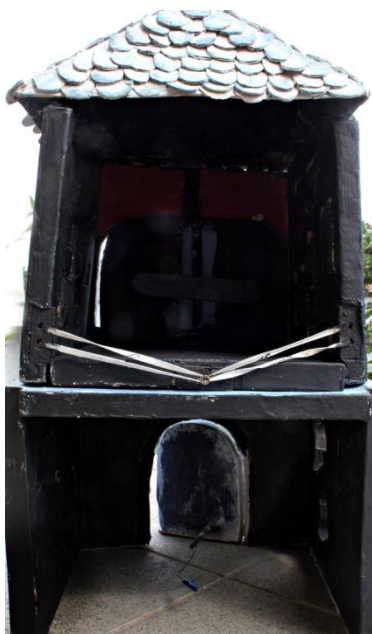
Slika XXIV. Ruža stražnji dio, mehanizmi