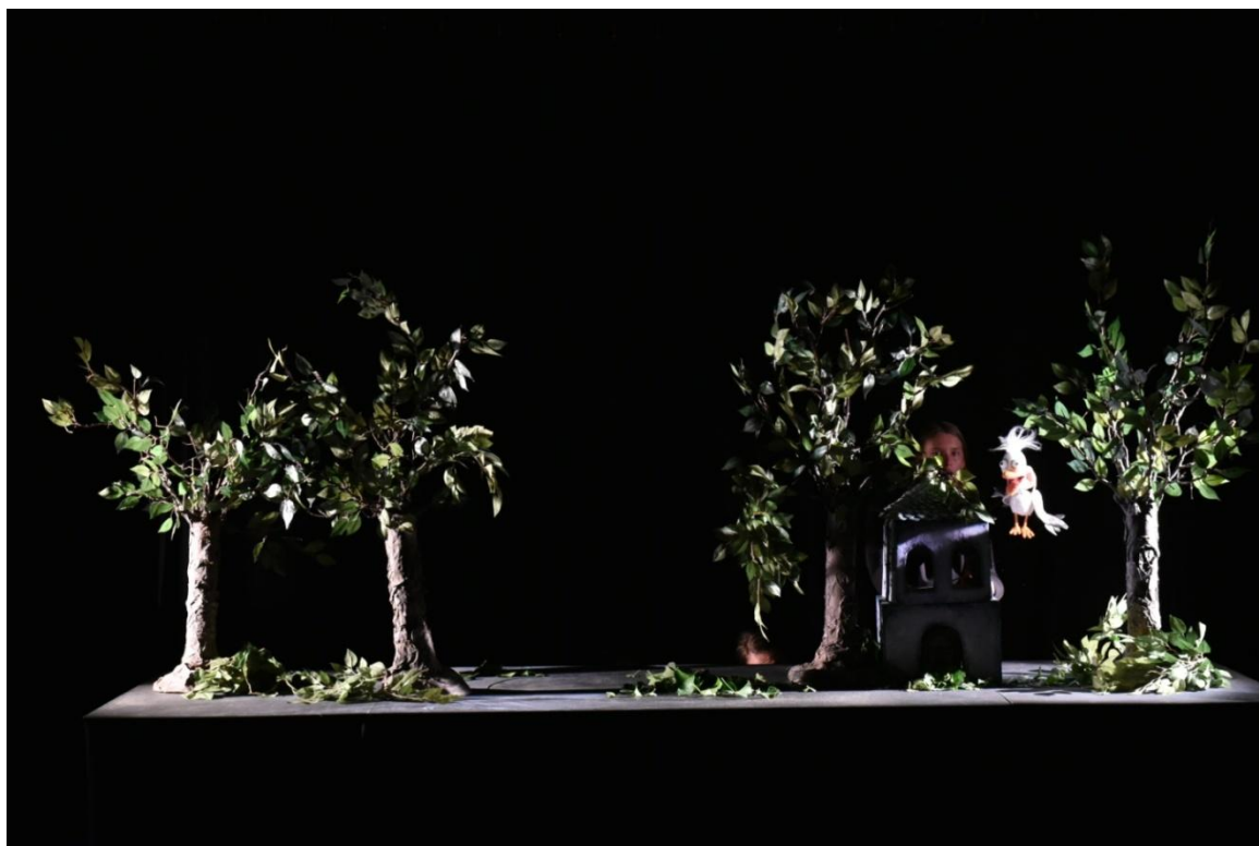
Slika XXXV. Treća scena, šuma