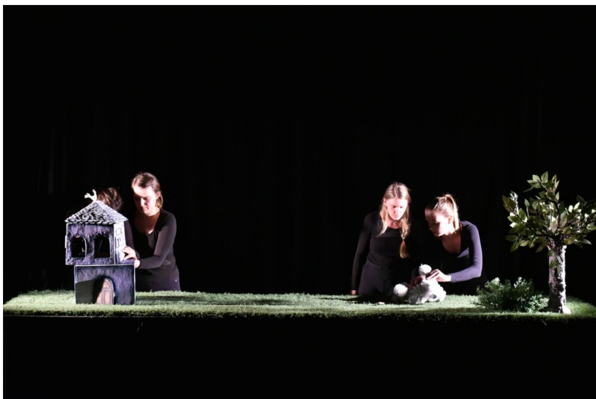
Slika XXXIV. Druga scena, Ružin susret sa psom