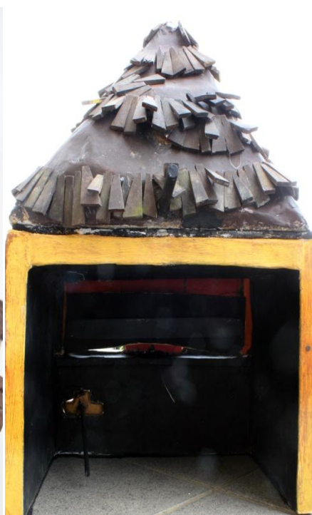
Slika XVI. Milivoj stražnji dio, mehanizmi