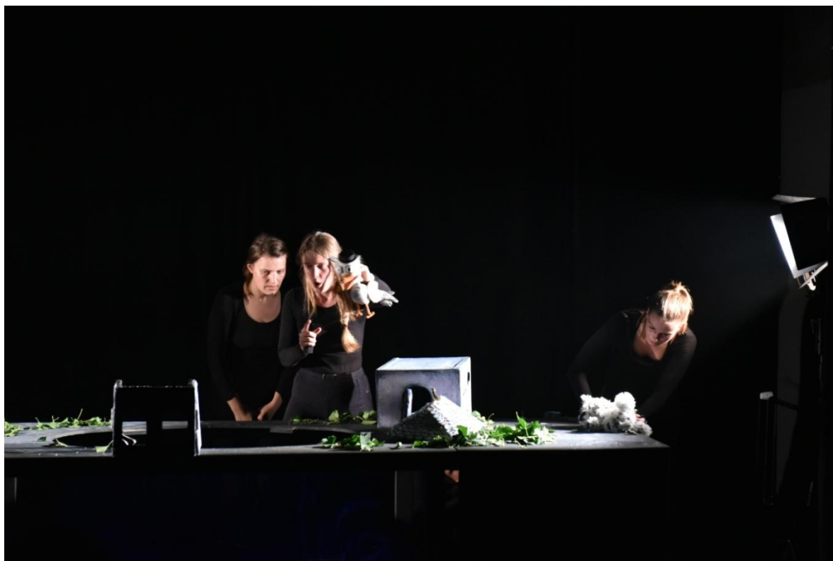
Slika XXXVII. Četvrta scena, Ružino raspadanje