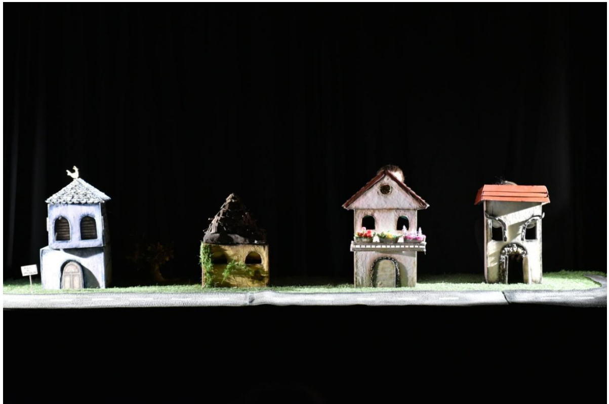
Slika XXXII. Prva scena, buđenje kuća

Nakon otprilike tri mjeseca rada, projekt je priveden kraju. Premijera je održana 21. lipnja 2017. godine u 18 sati, u dvorani broj 13 u zgradi glume i lutkarstva. Na akademiji imamo crne prostorije koje su pogodne za lutkarstvo. Sva pozornost usmjerena je na lutke, a animatori se puno teže vide nego u običnoj prostoriji. Najveći problem koji se dogodio netom prije početka izvedbe bio je kvar reflektora, zbog čega nije bilo moguće postići zamišljenu rasvjetu. Rasvjeta je bila vrlo loša i suviše jaka, a kuće su doslovno blještale. Nažalost, u tom trenutku nije postojalo bolje rješenje.