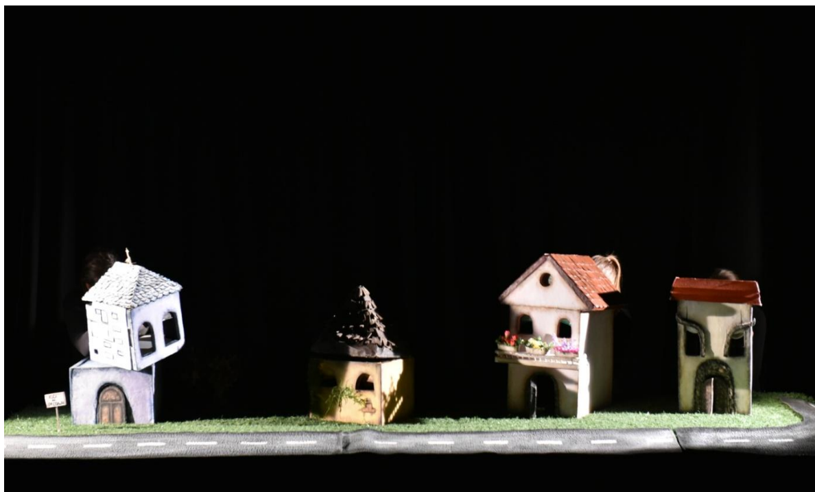
Slika XXXIII. Prva scena, kuće razgovaraju