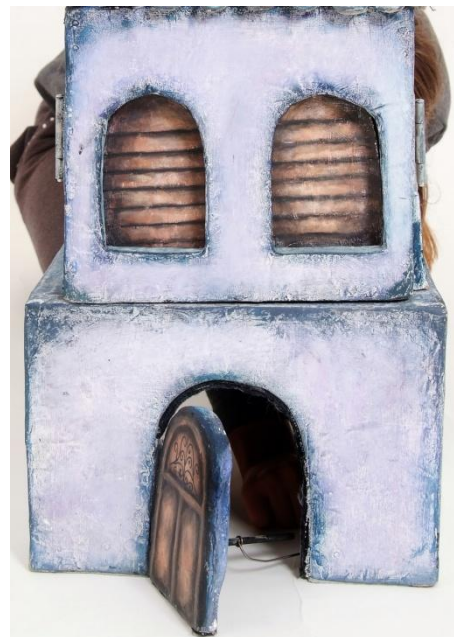
Slika XIX. Mehanizam otvaranja Ružinih vrata

Osim ovih osnovnih Ružinih elemenata, postoje oni koji se mogu sastaviti i rastaviti. Najprije, to je krov, izrađen od ljepenke, koji je za ostatak kuće pričvršćen tiplovima. U zidovima kuće postoje točno odgovarajuće rupice u koje ti tiplovi „sjednu“. To omogućava vađenje i ponovno stavljanje krova kad god je to potrebno. Također, na vrhu krova nalazi se vjetrokaz kokoši u koju je galeb zaljubljen. On se može vrtjeti zahvaljujući vodilici s unutrašnje strane krova, i po potrebi izvaditi.