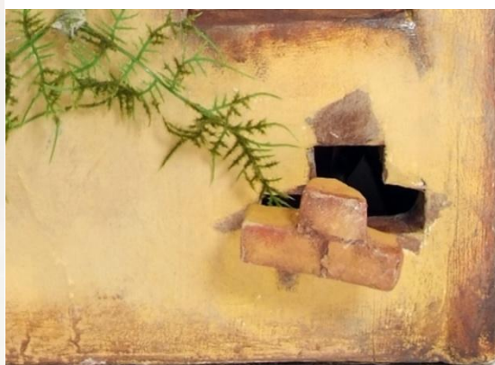
Slika XIV. Milijevova ciglica koja može ispasti