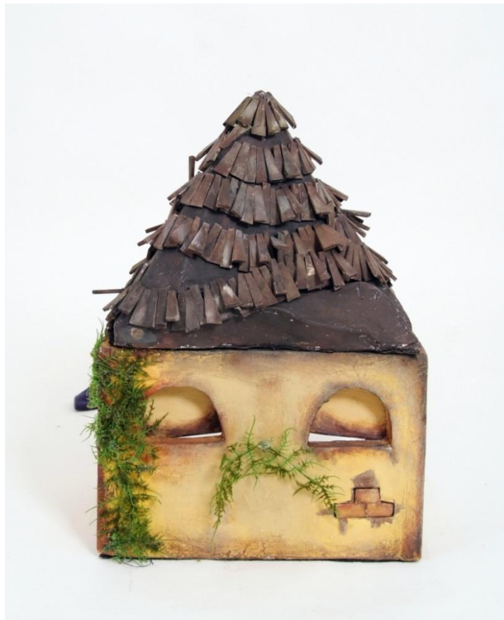
Slika XII. Milivoj

Milivoj je karakter koji unosi dašak humora u cijelu priču. On je najstariji, a uz to i usamljen u društvu dama. Trudi se biti šarmantan, ali je pomalo nespretn. Najupečatljiviji na njemu je njegov krov, za kojeg sam inspiraciju dobila gledajući stare baranjske kuće. Uz krov je došla i karakteristična žuta boja, koju također vrlo često možemo vidjeti na starim kućama, pogotovo u selima. Svaki crijep na Milivoju izrezan je iz balse te su svi zajedno nanizani na silk, što daje mogućnost upravljanja istim.