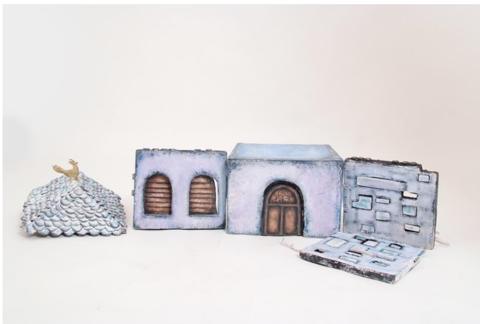
Slika XXV. Rastavljanje Ruže

Ružu sam izradila iz dva dijela jer to otvara mnoge animacijske mogućnosti. Mogućnost okretanja i odvajanja gornjeg dijela od donjeg daje iluziju vrata, okretanja glave. Također, omogućava usmjeravanje pogleda, odnosno, u Ružinom slučaju, okretanje od ostalih kako ih ne bi morala gledati i slušati. Njezina građa iz dva dijela pogodna je i za njezino raspadanje.