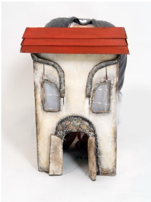
Slika VIII. Sofijine pomične obrve i vrata

konca koja se povlače naprijed – nazad. Sofija je oživjela u nijansama smeđe, a određeni pečat dobiva crvenim krovom.