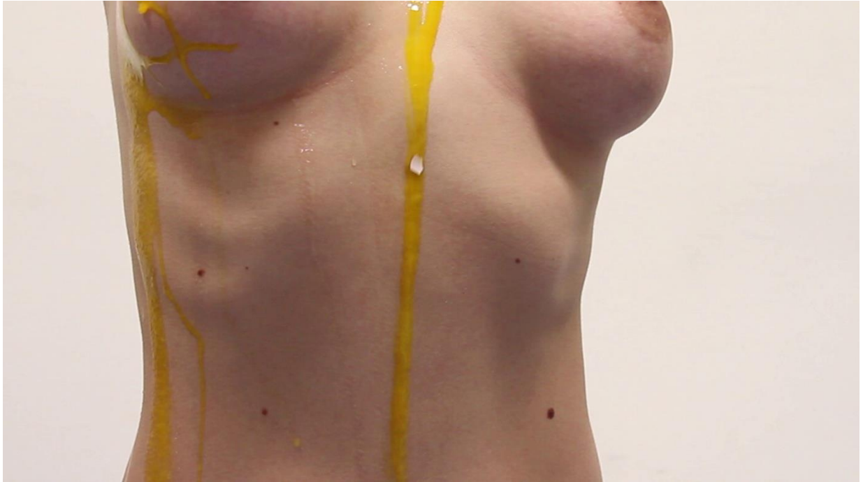
Story of the „I“ (2016.)

U video radu Story of the „I“ se bavim tim pitanja ženske seksualnosti. Korištenjem elemenata performansa i fetišizma koji seksualni fokus stavlja na ne živi predmet i predstavlja opsesivnu pozornost i obožavanje, stvara se fantazija koja je isprepletana sa snovima i fikcijom. Stvaraju se druge stvarnosti koje su međusobno isprepletene. Kroz literarne reference kao što je Story of the Eye Georges-a Bataille-a, koristim simbolički objekt jajeta kao fetišistički predmet koji putem performativnog čina postaje simbol želja i fantazija koje su često skrivene i potisnute. Na taj način, objekti koji se tradicionalno ne smatraju seksualnim, postaju predmeti moći i želje u kontekstu fantazije.