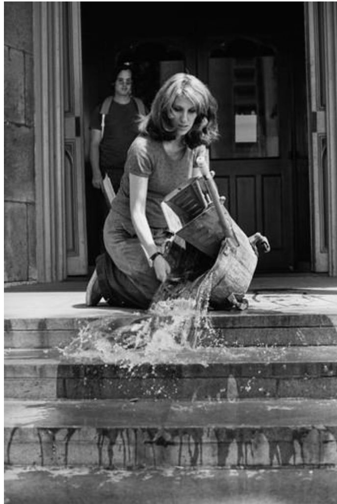
Slika 8: Mierle Lederman Ukeles, Washing/Tracks/Maintenance: Outside, July 22, 1873. , crno-bijela fotografija (detalj).

Ukelesičina ideja da kulturalno definirane ženske dnevne zadatke treba izlagati kao umjetnost, jednako je revolucionarna kao Duchampova ideja o tome kako obični predmeti iz svakodnevice mogu postati umjetnička djela. (Liss, 2009)