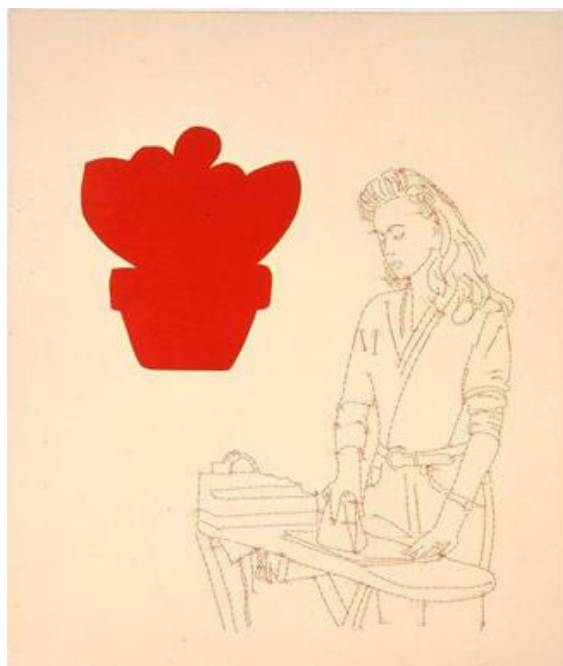
Slika 10: Ghada Amer, Žena koja glača (La femme qui repase) , 1992., akril i šivanje na platnu, (courtesy of Gagorian Gallery)

Inspiraciju za odabir tehnike pronašla sam u djelima suvremenih multimedijalnih umjetnica - egipatske umjetnice Ghade Amer i hrvatske umjetnice, profesorice Ines Matijević Cakić. One su za svoja djela često odabirale upravo tehniku šivanja, realizirajući je na subjektivan i vrlo različit način. Ghada Amer, na samom početku svoje umjetničke karijere, crtežima u tehnici šivanja konca na platno prikazivala je ženske likove u aktivnostima vezanim uz majčinstvo i održavanje doma (slika 9). Umjetnica je vrlo brzo svoje umjetničko djelovanje tematski uglavnom usmjerila ka preispitivanju ženske seksualnosti, nastavivši svoje radove realizirati u ovoj tehnici.