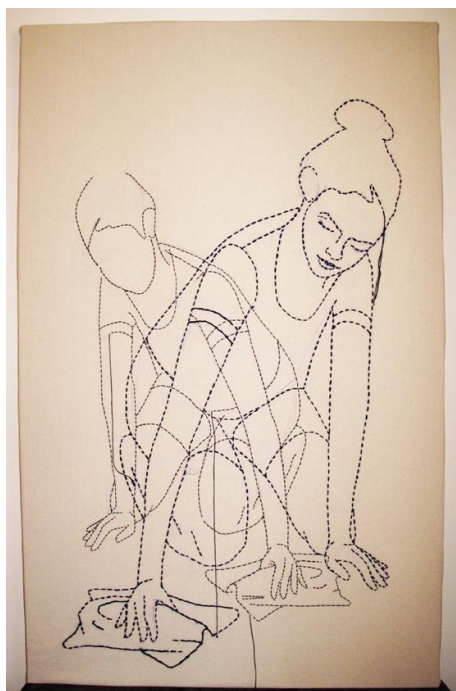
Slika 1: Martina Livović, Venera Símera 1 , crtež koncem na platnu, 160x 100 cm, 2017.

perilicom. Na crtežu Venera Símera 4 , (slika 4), prikazujem autoportret na kojem sjedim u naslonjaču s knjigom u ruci. Tim prikazom željela sam istaknuti vrijeme namijenjeno intelektualnom radu na sebi. Na tom istom prikazu suprotstavljen je autoportret na kojem perem toalet. Djelomično, ova dva motiva se preklapaju i načinjeni su u istoj veličini. Time sam željela usmjeriti pozornost na preklapanje vremena namijenjenog brizi o sebi i onog namijenjenog brizi o drugima. Budući da su crteži realizirani u tehnici šivanja, na crtežu Venera Símera 5 (slika 5), prikazala sam se tijekom šivanja. Na taj način sugeriram prikaz trenutka izrade mojih crteža. Taj prikaz najdoslovnije predstavlja sinergiju u kojoj se isprepliću privatno i javno. Šivanje, tj. izrada likovnog rada poput intimnog je čina prikazano kako se odvija iza odškrnutih vrata mog doma. Odškrnuta vrata pozivaju promatrača na pogled iz javnog u privatno, a likovni rad, namijenjen pogledu javnosti, nastaje u privatnosti i intimi mog doma.