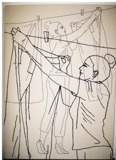
Slika 2: Martina Livović, Venera Símera 2 , crtež koncem na platnu, 140x 100 cm, 2017.