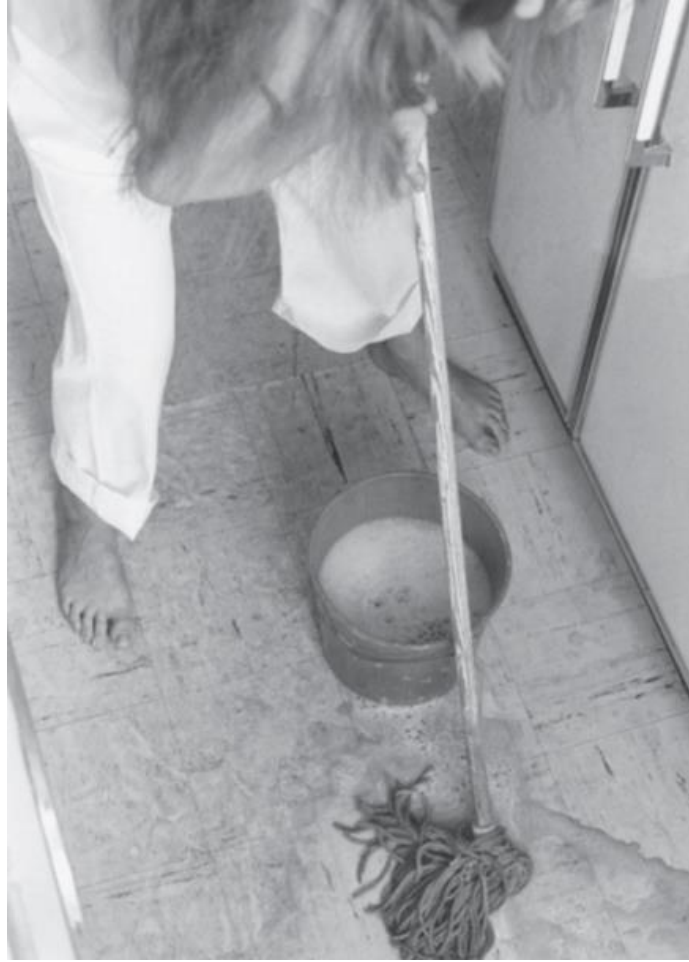
Slika 7 Mierle Lederman Ukeles, crno-bijela fotografija dijela privatnog performansa, "Umjetnost održavanja: pranje poda" ("Maintenance Art: Mopping the Floor"), 1969.