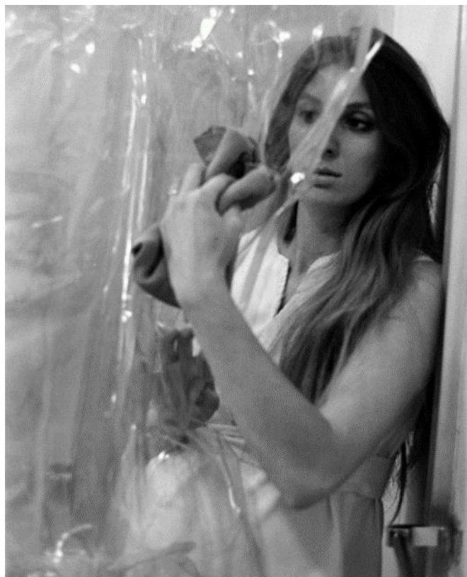
Slika 6 Mierle Lederman Ukeles, Umjetnost održavanja: brisanje pregrade ( Maintenance Art: Dusting a Baffle ), crno- bijela fotografija, 1969.

fotografijama, na kojima je umjetnica prikazana kako pere vanjsko stubište na ulazu u muzej (slika 8). 5