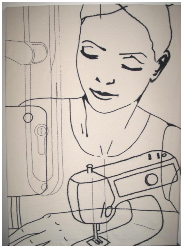
Slika 5: Martina Livović, Venera Símera 5 , crtež šivan koncem na platnu, 160 x100 cm, 2017. godina