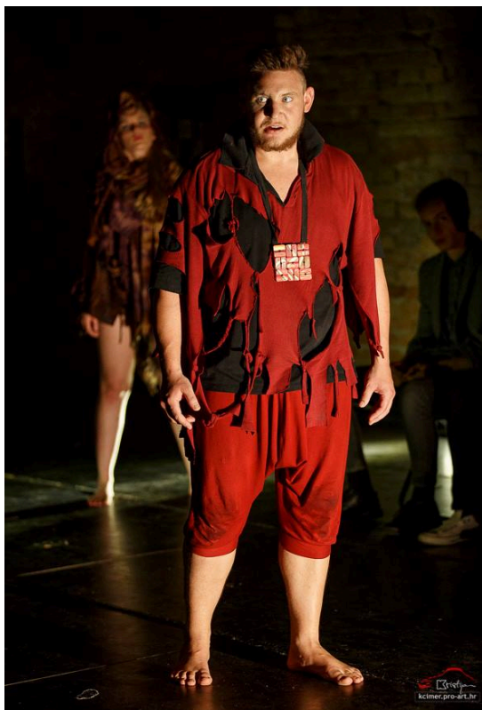
Slika 13 - Macbeth