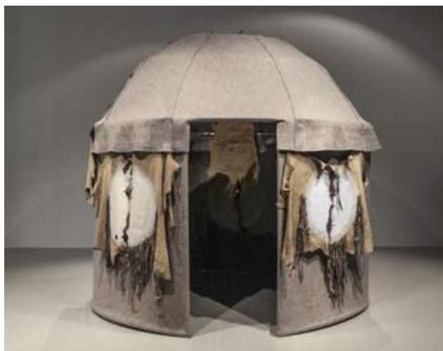
Prilog 8: Nil Yalter, Nomad's Tent , 1973.