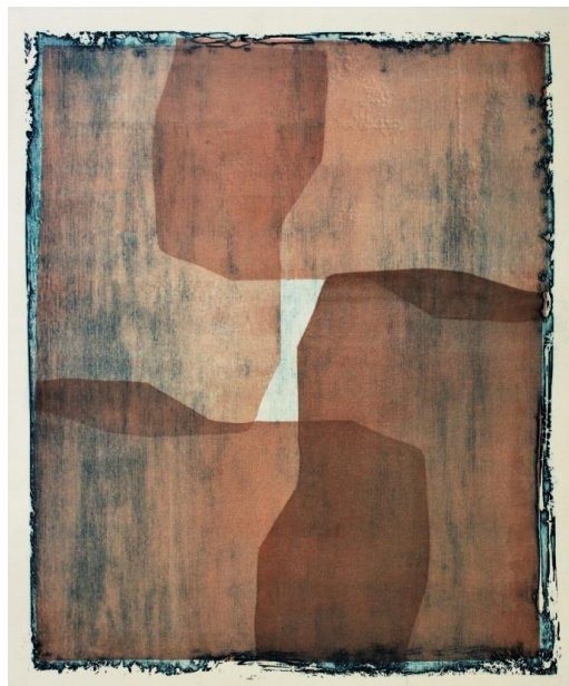
Slika 1 Apsorpcije I Izjetkana matrica druge faze otiskivanja