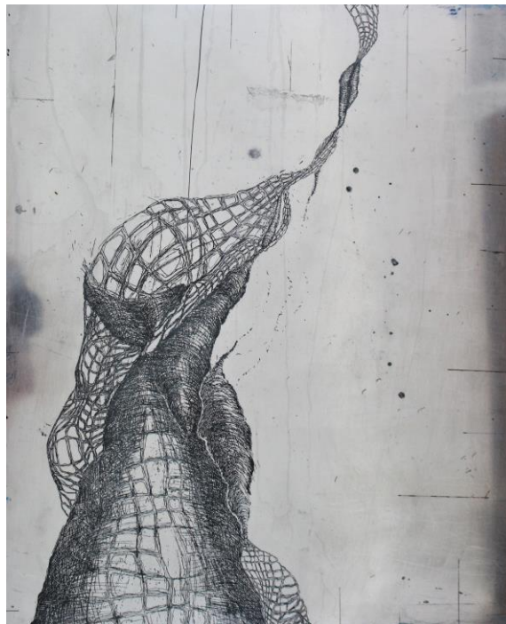
Slika 12 Apsorpcije VI Total izjetkane matrice (2)