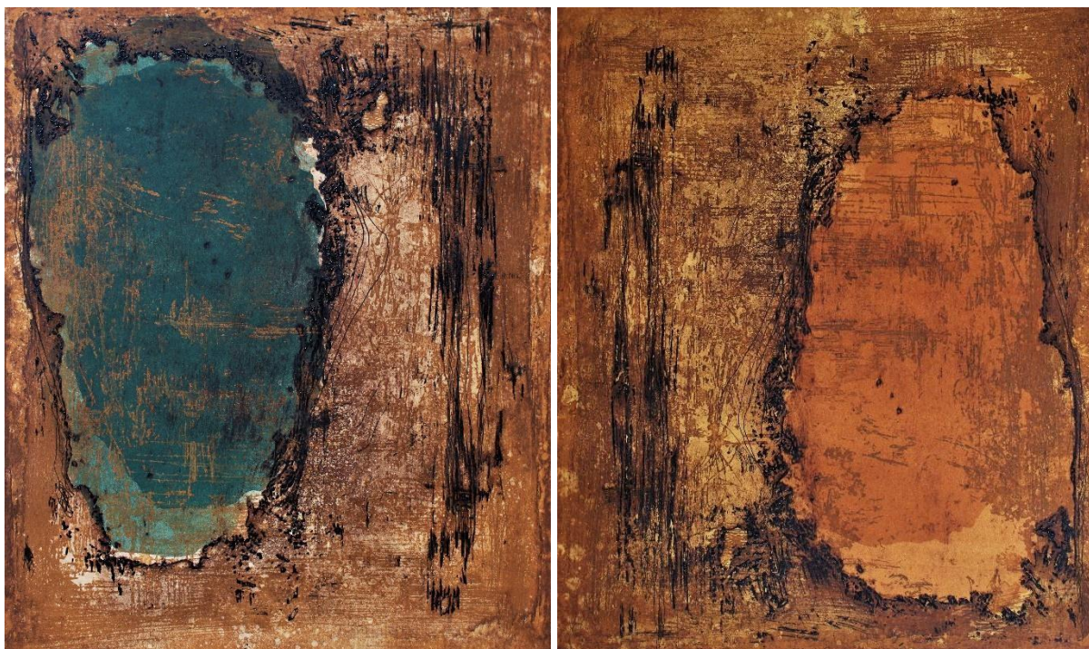
Slika 9 Apsorpcije IV , A.O. 1/1, kombinirana tehnika, matrica 41,5x33,5 cm, 50x70 cm vel. papira