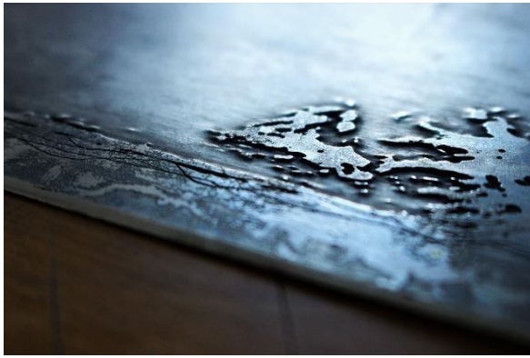
Slika 6 Apsorpcije IV i V Detalj izjetkane matrice