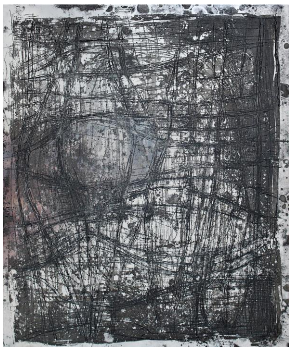
Slika 14 Apsorpcije VII Total izjetkane matrice

Apsorpcije VII zamišljene su s ciljem krajnje vizualne zasićenosti i zastupljenosti gotovo svih tehnika. Matrica na koju je tehnikom bakropisa iscrtana nepravilna amorfna mreža postavljena je u kiselinu na dugo jetkanje od 4 sata. Nakon zadovoljavajuće dubine izjetkanih linija skinut je grund te je matrica naprašena kolofonijskim prahom, a omjer naprskanog alkohola i vode ovisio je o dijelovima u kompoziciji kojima je vizualno bio potreban dodatan ton. Potom je kolofonij rastaljen, a matrica stavljena u kiselinu na 15-ak minuta (Slika 14). Otiskivanje je, uz početne dvije faze identične svim grafičkim listovima, bilo obavljeno u dva navrata; prvi, s otisnutim tonom čiste sepije uz sušenje od tri dana; i drugi, s tonom kombinacije sepije i ultramarin plave pri čemu je ploča bila zarotirana za 180°. U konačnici je dobiven grafički list izrazite zasićenosti i površinske reljefnosti (Slika 15).