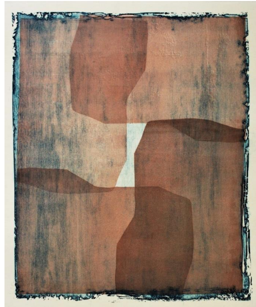
Slika 1 Apsorpcije I Izjetkana matrica druge faze otiskivanja