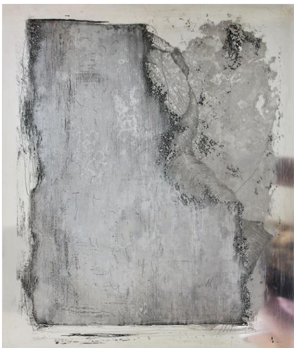
Slika 11 Apsorpcije VI Total izjetkane matrice (1)