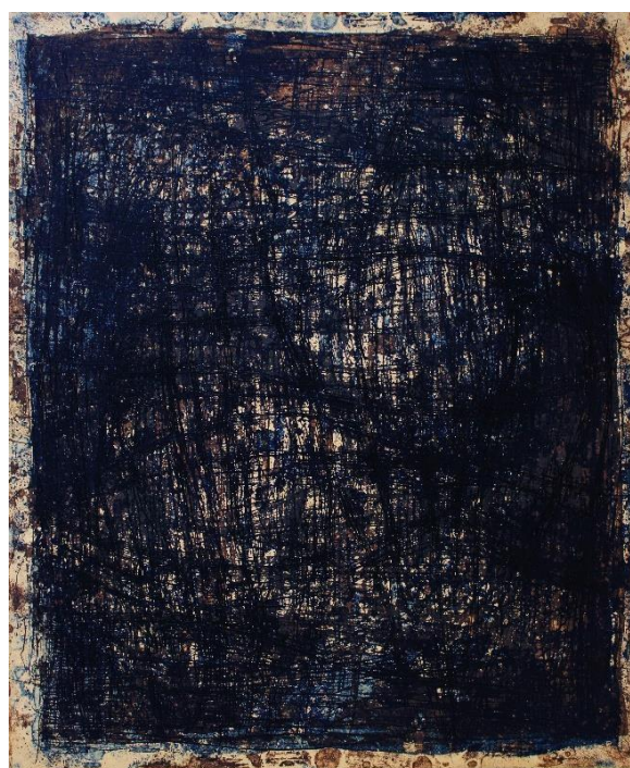
Slika 15 Apsorpcije VII , A.O. 1/1, kombinirana tehnika, matrica 41,5x33,5 cm, 50x70 cm vel. papira