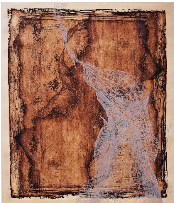
Slika 13 Apsorpcije VI , A.O. 1/1, kombinirana tehnika, matrica 41,5x33,5 cm, 50x70 cm vel. papira