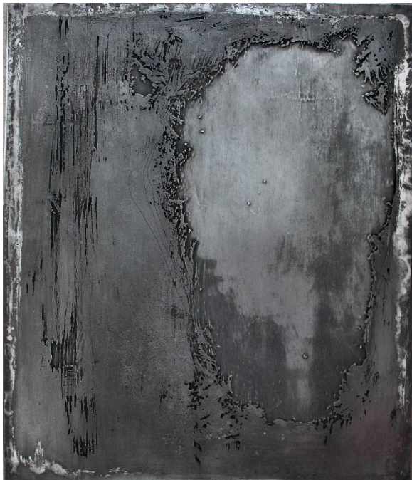
Slika 8 Apsorpcije IV i V Total izjetkane matrice