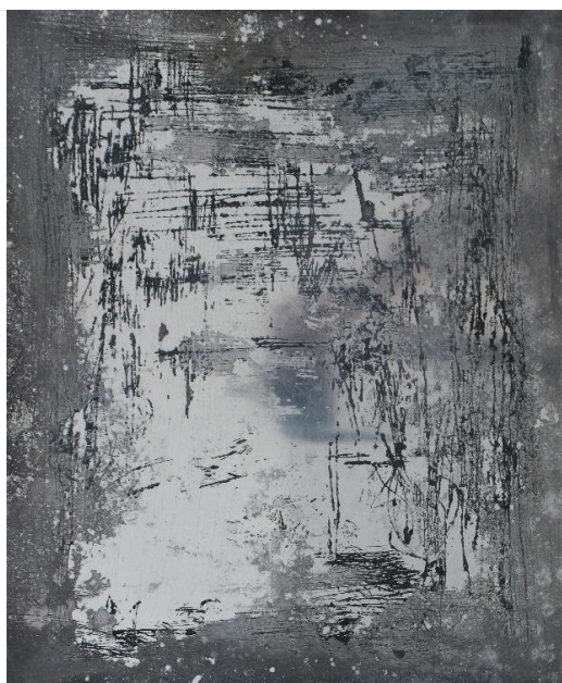
Slika 3 Apsorpcije II i III Total izjetkane matrice