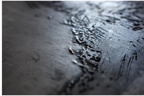
Slika 7 Apsorpcije IV i V Detalj izjetkane matrice