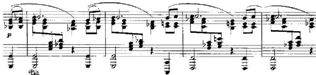
Primjer 8 – Zajedničko djelovanje najvišeg i najnižeg glasa (op. 118, br. 3, 11. – 14. takt).

Brahmsova melodija razlikuje se od drugih melodija po tome što je ona u suštini kombinacija ljestvičnog nizanja, akordskog pristupa, arpeggiranja , balansiranih tako da se ne može reći koji je pravac dominantan i ključan, smatra Wolff (1990.). Objašnjava nadalje kako se ponekad čini da melodija lebdi iznad jednog središnje postavljenog tona, kao pčela oko cvijeta, te da je melodija bez početka i bez kraja, potpuno otvorena, što ga pak definira kao punopravnog predstavnika romantizma.