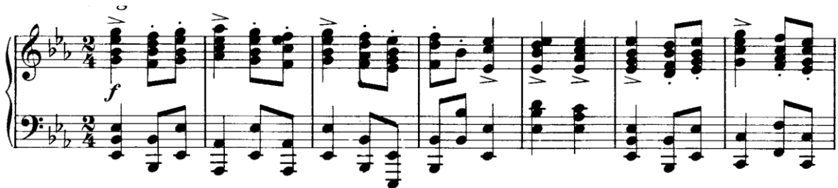
Primjer 9 – Melodijska linija u vanjskom glasu kao sastavni dio akorda (op. 119, br. 4).

Također, melodija jasno ocrta njegovu introvertiranost, skromnost, čežnju za lijepim i harmoničnim, kao i njegovo sjevernonjemačko porijeklo, smatra isti autor. Integralni su dio Brahmsovog stila melodije inspirirane njemačkim folklorom, po svojoj preciznosti i logičkoj konstrukciji. Takva je i tema Intermezza u a-molu , op. 116, br. 2 koju u prvih osam taktova možemo zamijeniti s nekom narodnom pjesmom, da bi tek odjek u devetom taktu donio Brahmsov dodir. Sličnost s njemačkim narodnim pjesmama još je izraženija kada je melodija mirna i kada se kreće gore-dolje u malim razmacima. Melodija teme čuvenog Intermezza u A-duru , op. 118, br. 2 bila bi zatvorena u najvećem intervalu male sekste da Brahms i ovdje ne nudi iznenađenje te u drugom taktu čini nagli skok za septimu.