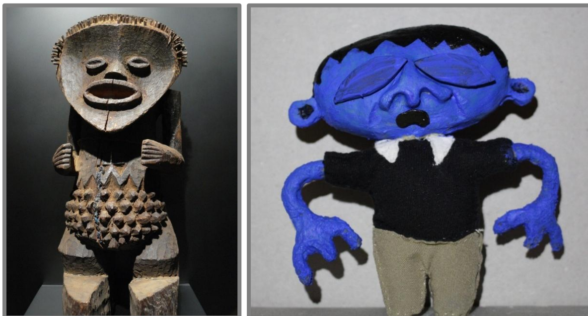
Slika 3 – Statua iz Nigerije i lutka iz animiranog filma Čemer

Lutki koja je izrađena po predlošku iz stripa nastojao sam dodati elemente koji bi ju činili plošnijom nego što ona zaista jest. To sam postigao tako što sam usta i oči izradio plosnato i ravno i dodao ih na glavu lutke. Poza koju je lutka također preuzela iz stripa jest poveznica na tradicionalne afričke skulpture zbog koje one djeluju statično. Prilikom izrade nastojao sam se ne opterećivati teksturom koju će površina lutke imati, a nepravilnosti, koje bih inače odstranio, sam ostavio takvima kakve jesu.