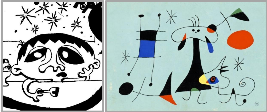
Slika 1 –Joan Miro Figura, Pas, Ptice i kadar iz stripa Čemer