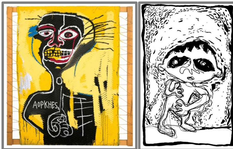
Slika 2 – Jean-Michel Basquiat, Cabeza , 1982. i kadar iz stripa Čemer

Prilikom crtanja intenzivnih emotivnih stanja u kojima bi se likovi nalazili služio sam se slikom Cabeza Jeana-Michela Basquiata za referencu. Slobodno povučene linije nastojao sam prilagoditi estetici stripa no tako da se zadrži njihova ekspresivnost. U nastojanju da dobijem prikaz emocija što autentičnije, linije sam povlačio desnom rukom koja nije moja dominantna ruka ( Slika 2 ).