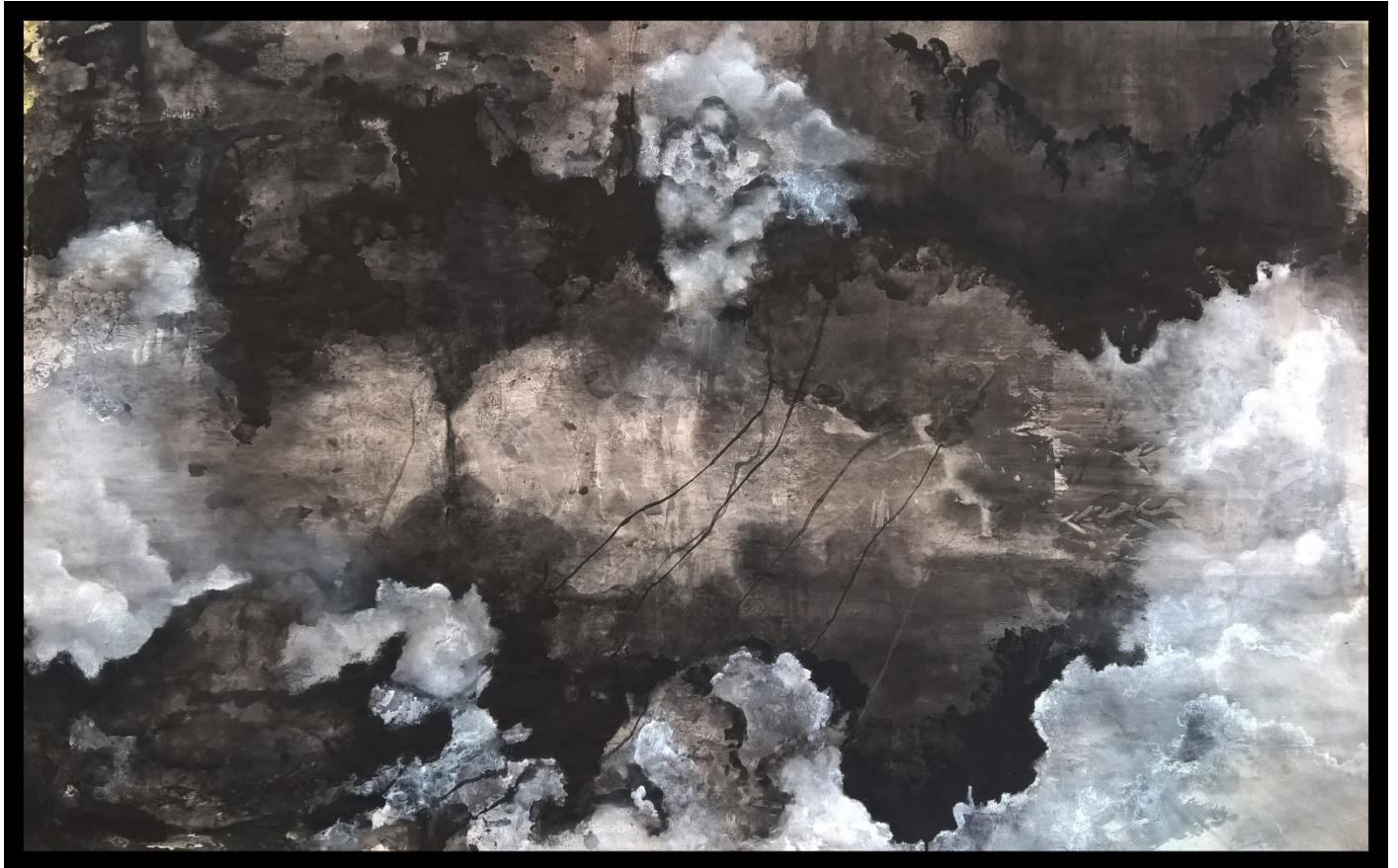
Gotovi rad 3